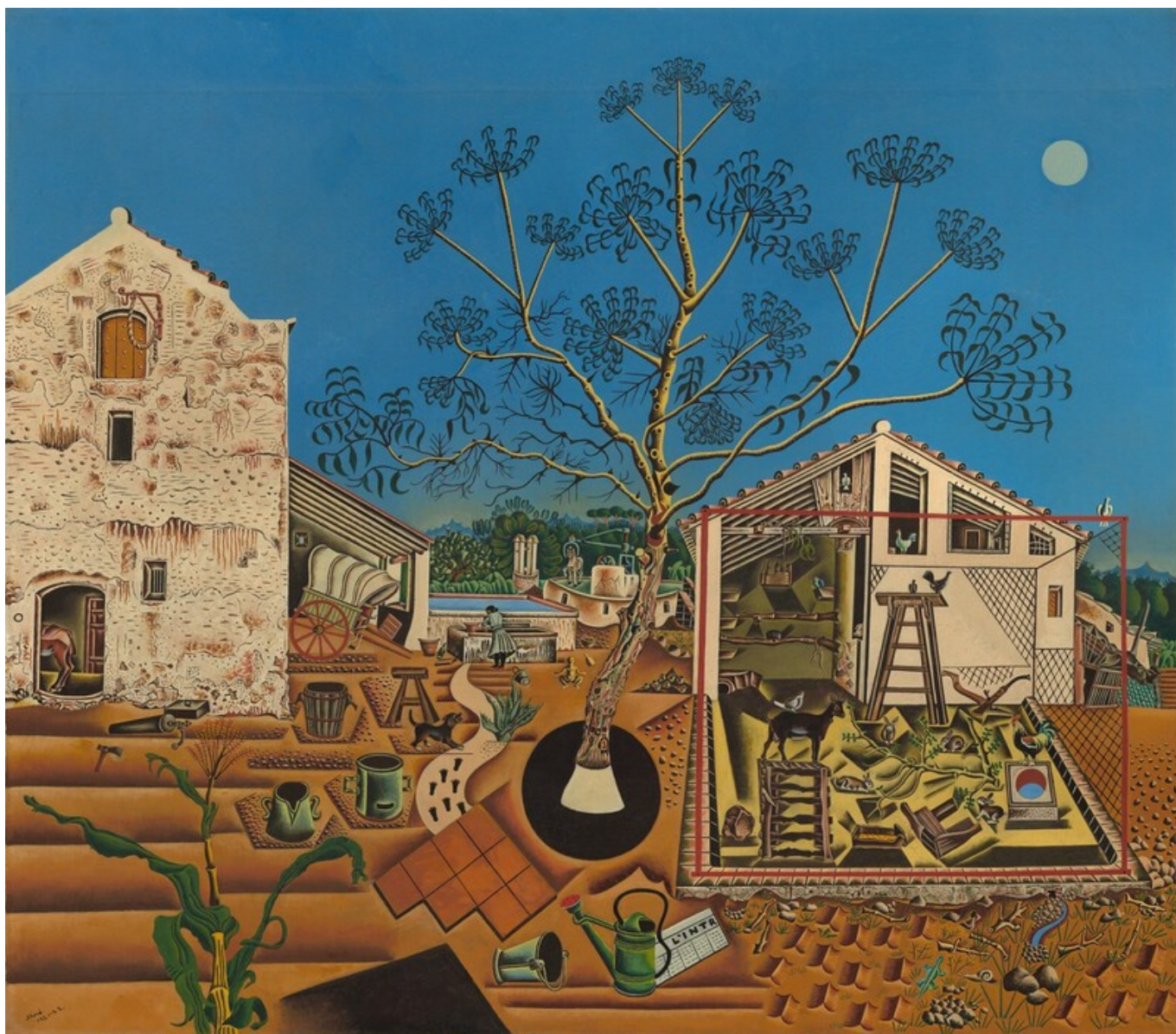
《农场》，胡安·米罗（西班牙）作于1921 - 1922年。