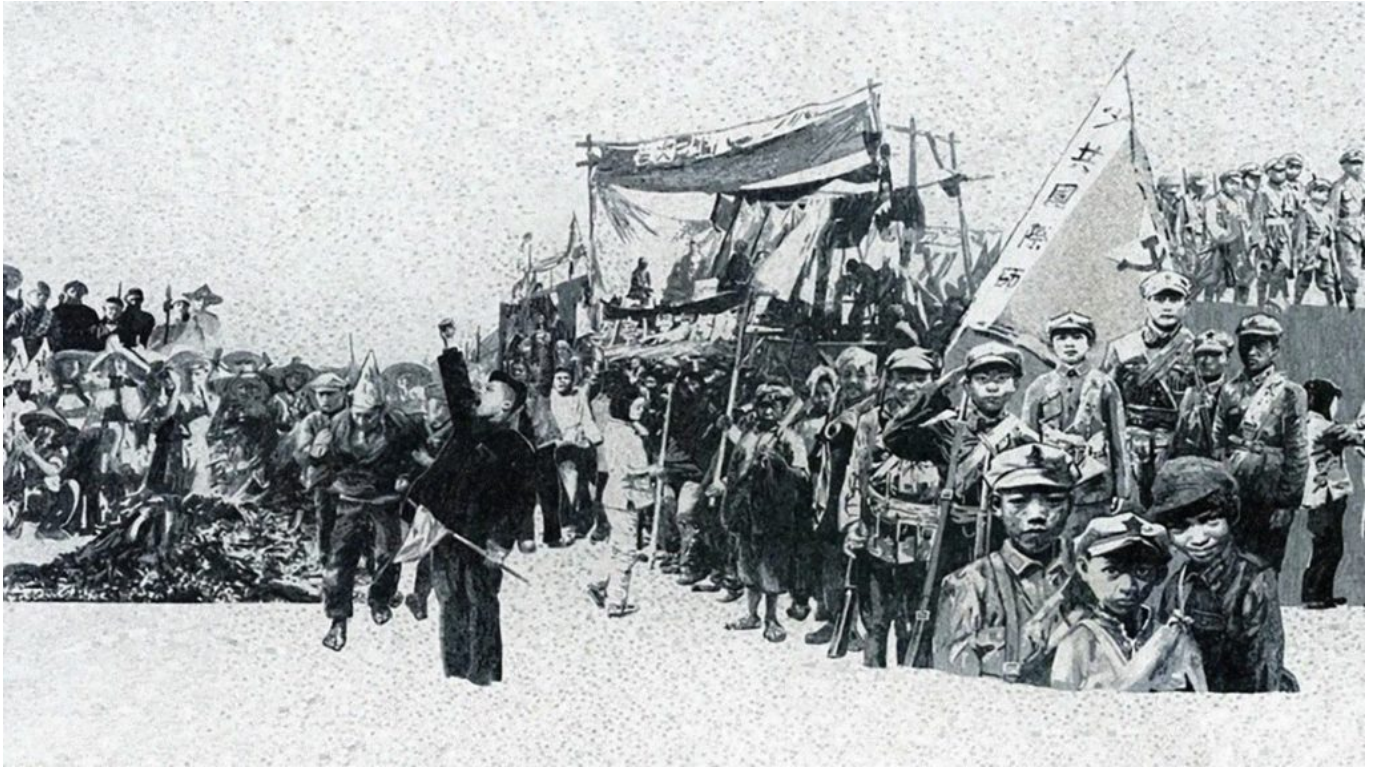
《红星颂》（局部）叶武林（中国）作于2015年

人。对他们来说，去殖民化进程需要世界和平与平等，这样前殖民地的人民才能站起来，有尊严地营造自己的生活。在 2024 年阅读和反思这些文字，我们既能体会到 1949 年以来世界人民取得的进步，也能体会到老牌殖民国家的顽固不化，它们长期以来一直试图阻止建立新世界。美以对巴勒斯坦人实施种族灭绝并轰炸黎巴嫩反映了殖民国家的野蛮行径，企图把我们束缚在想要超越的过去。老牌殖民国家强加给我们的态度和战争使我们无法建设“自己的文明和幸福”，也无法促进“世界的和平与自由”。毛泽东的话实际上是所有摆脱殖民主义的人民之声，他为世界提供了一个选择：要么我们是对手，将资源投入丑陋而无意义的战争；要么我们建立一个“爱好和平自由的世界各民族的大家庭”。