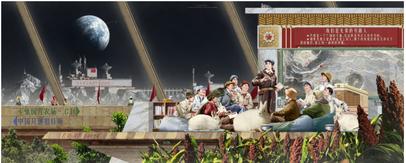
《嫦娥同志》范文南（中国）作于2022年

6584 辆行驶在北京街头。虽然北京的空气要达到自己的标准还有很长的路要走，但空气污染程度已经明显下降。