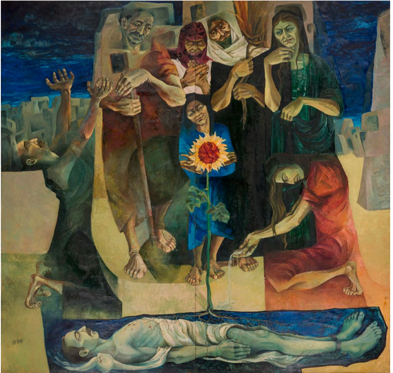
阿尤布·埃姆达迪安（伊朗）《自由之苗》作于1973年

捕令。2023年11月至12月，卡里姆·汗访问了以色列，他对“过度行为”提出警告，但表示由于“以色列有训练有素的律师为指挥官提供建议”，他们可以防止任何骇人听闻的违反国际人道法的行为。