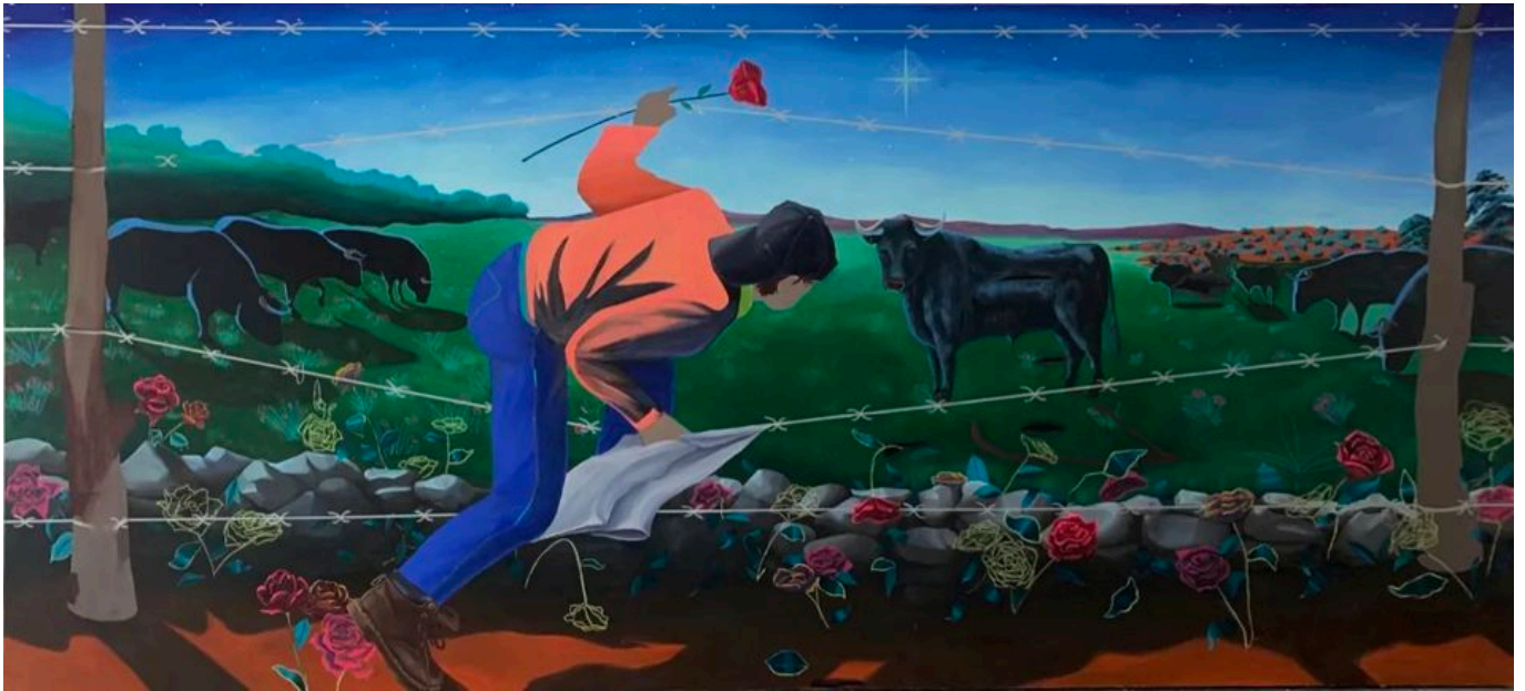
《瓦潘戈斗牛士》安娜·塞戈维亚（墨西哥）作于2019年