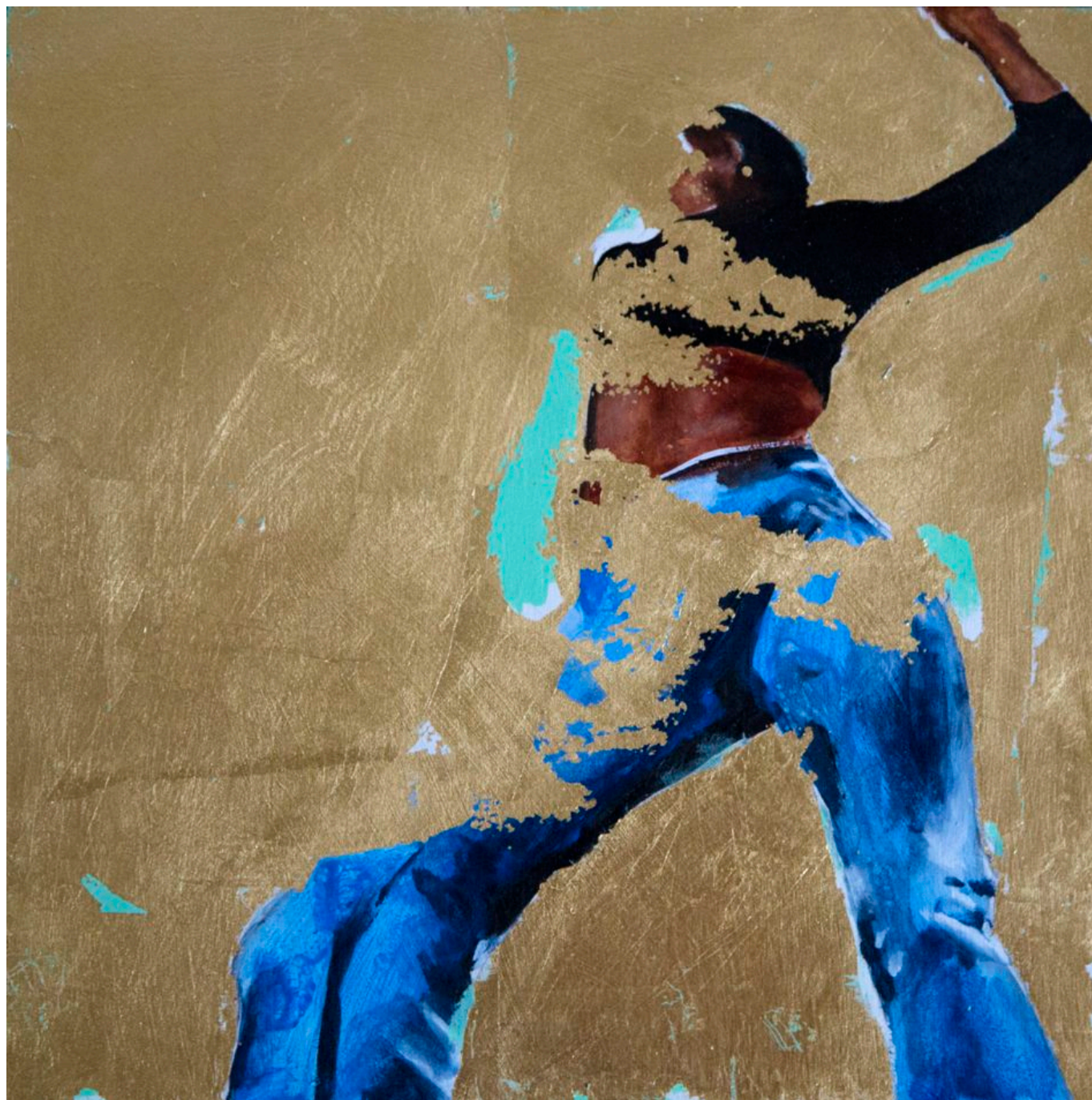
《这么做》道恩·欧科罗（尼日利亚）作于2017年

美国政府大为光火。2020年6月11日，美国总统特朗普批准第13928号行政命令， 授权 美国政府冻结国际刑事法院官员的资产，禁止他们及其家人进入美国。2020年9月，美国对冈比亚籍的本苏达和莱索托籍的国际刑事法院高级外交官法基索·莫乔乔科 实施 制裁。美国律师协会 谴责 了这些制裁，但制裁并未撤销。