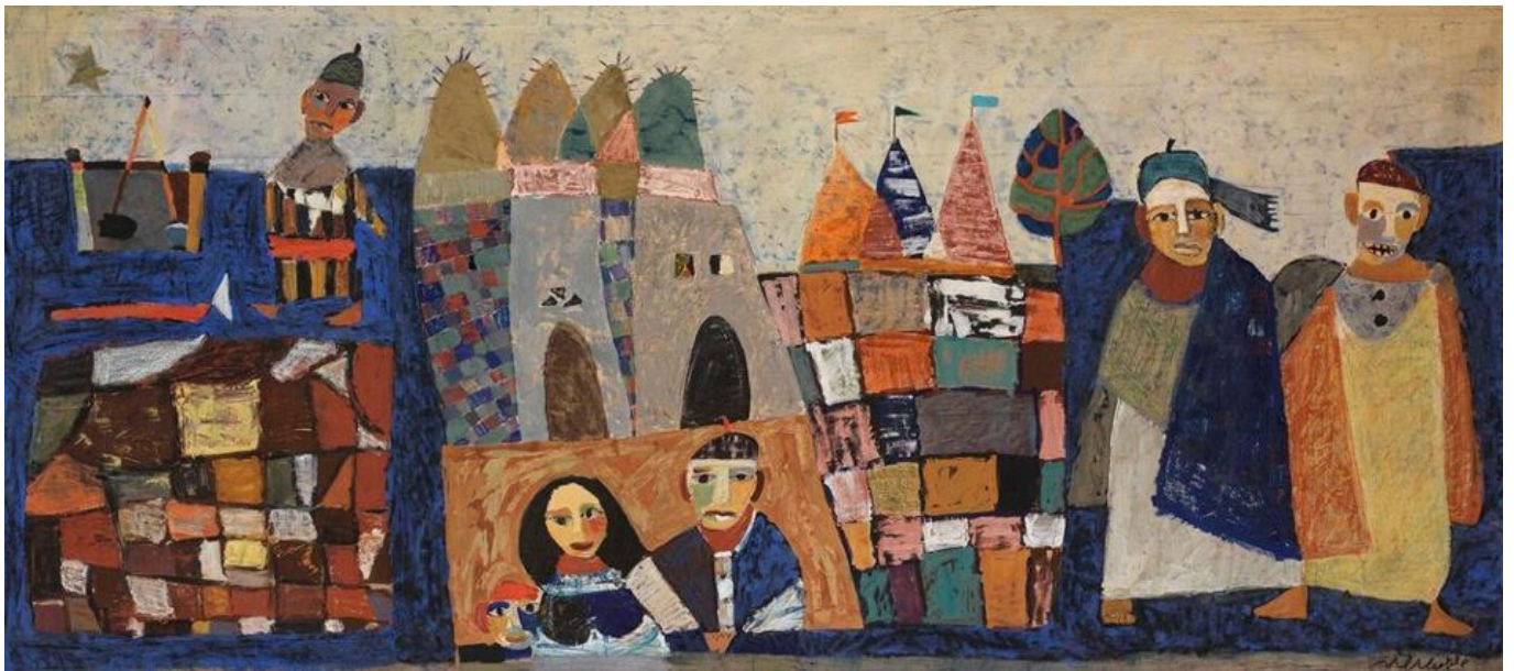
《大地的良知》哈米德·阿布达拉（埃及）作于1956年

卡里姆·汗的新闻声明中有一个有意思的片段：“我坚持认为，所有阻碍、恐吓或不当影响本法院官员的企图都必须立即停止。”八天后的5月20日，《卫报》与其他刊物合作发表了一份 调查报告 ，揭露以色列利用“情报机构进行监视、黑客攻击、施压、诽谤，据称还威胁国际刑事法院的高级工作人员，企图破坏法院的调查”。以色列情报机构摩萨德前负责人约西·科恩曾 骚扰 并威胁本苏达（卡里姆·汗的前任检察官），警告她“你不想卷入危及自己或家人安全的事情吧。”此外，《卫报》还指出，“在2019年至2020年期间，摩萨德一直在积极搜寻有关检察官本苏达的不利信息，并对她的家庭成员感兴趣。”“感兴趣”是一种委婉说法，即收集她家人的信息（包括针对她丈夫菲利普·本苏达的盯梢行动）来讹诈和恐吓她。这些都是黑手党的惯用伎俩。