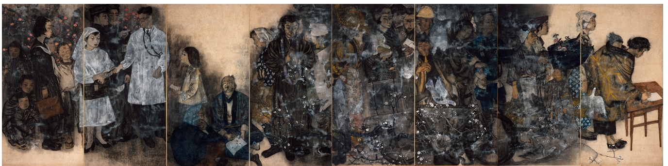
《原爆图之十：签名》丸木位里、丸木俊作于1955年

汇编的最后一部分“东北亚和平之路”介绍日本冲绳、朝鲜半岛和中国的人民运动希望找到一条和平之路。这条道路有五项简单原则：终结危险结盟、终结美国在该地区主导的战争游戏、终结美国对该地区的干预、支持该地区各斗争之间相互团结、结束亚洲军事化。例如，生活在冲绳嘉手纳空军基地和边野古湾以及韩国萨德反导系统和济州海军基地附近的人们正在多条战线上为结束亚洲军事化而斗争。