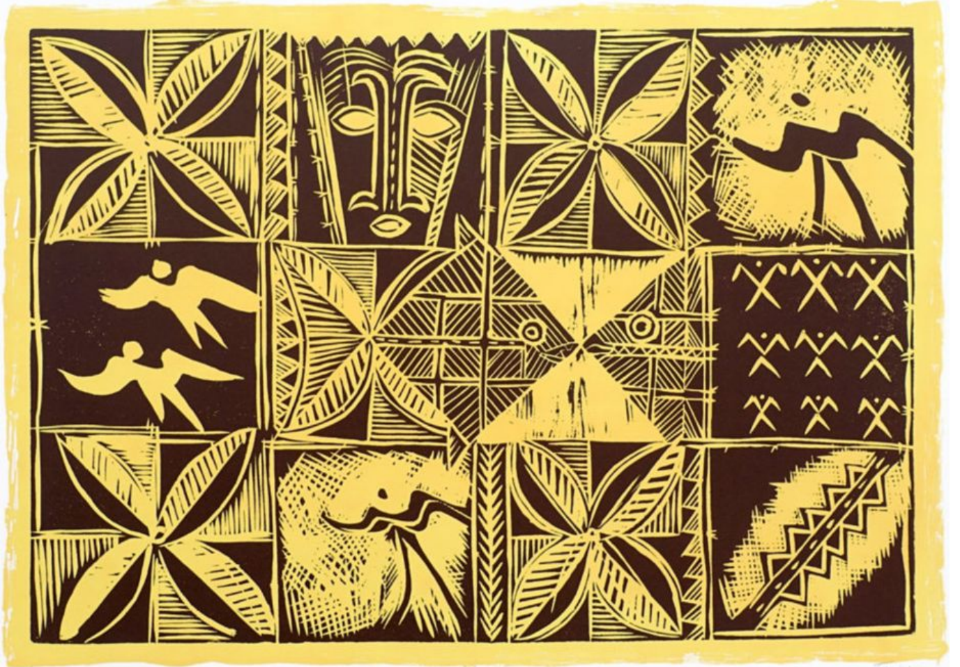
《玛塔·索吉娅》法图·费乌（萨摩亚）作于2009年

“环太平洋2024”军演于6月28日 开始 ，将一直持续到8月2日。军演活动在美国非法占领的夏威夷举行。夏威夷独立运动历来抵制环太平洋军事演习，认为这也属于美国的侵占行为。参加演习的有来自29个国家的150多架飞机、40艘水面舰艇、3艘潜艇、14个国家的陆军和其他军事装备，其中大部分来自美国。演习的目标是“互操作性”，这实际上意味着将其他国家的军事力量（主要是海军）与美国相整合。掌控着演习主要指挥和控制权的美国是“环太平洋”军演的核心和灵魂。