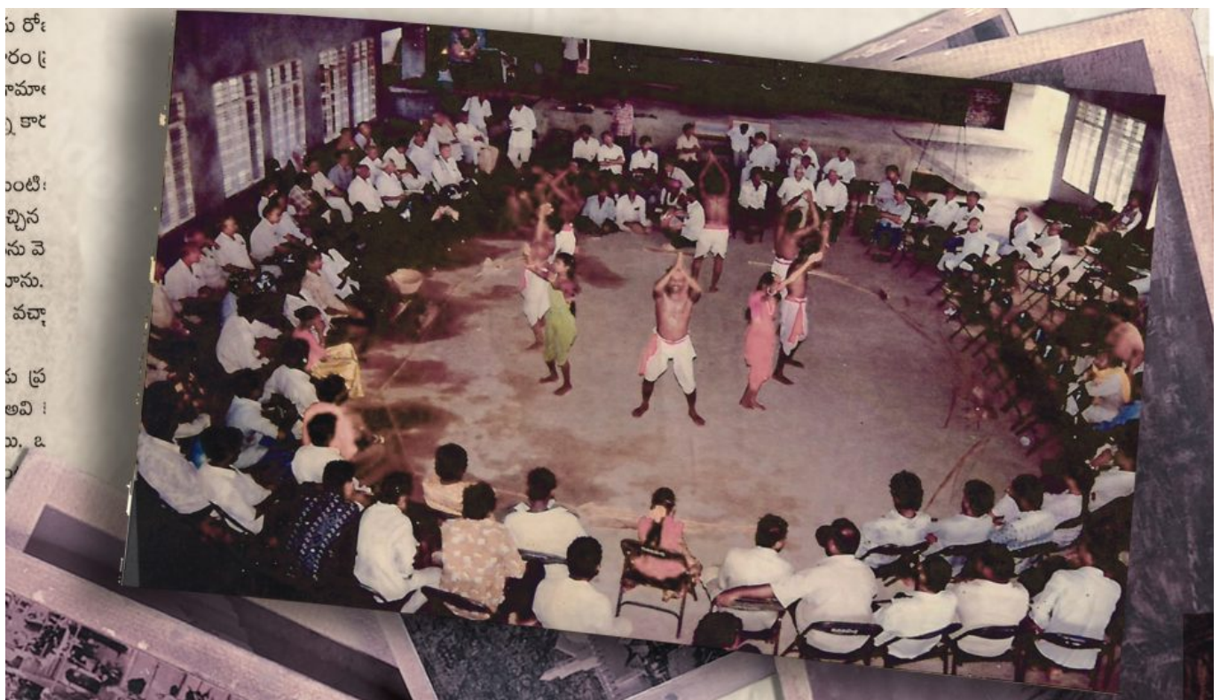
普拉亚·纳提亚·曼达利表演街头剧。

这些革命者歌曲以农民歌谣和形式为基础，精心打造新文化元素：在歌词中，他们摒弃农村的等级制度；在节奏中，他们让农民发出了比在地主面前更响亮的声音。这些歌曲的内容和形式都体现了新世界的大胆精神。