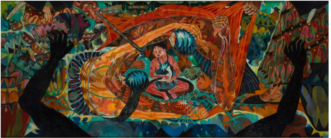
《那些被赶出家园的人》作于1960年 供图：印尼革命文化组织印尼人民文化协会（Lekra）成员阿姆鲁斯·纳塔尔西亚