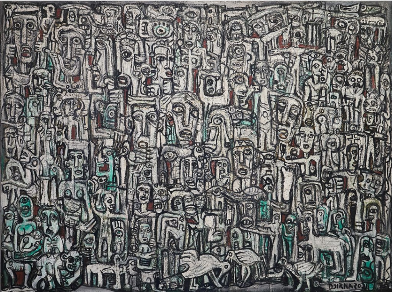
《图腾，图腾》马德·迪尔真纳（印度尼西亚）作于2021年