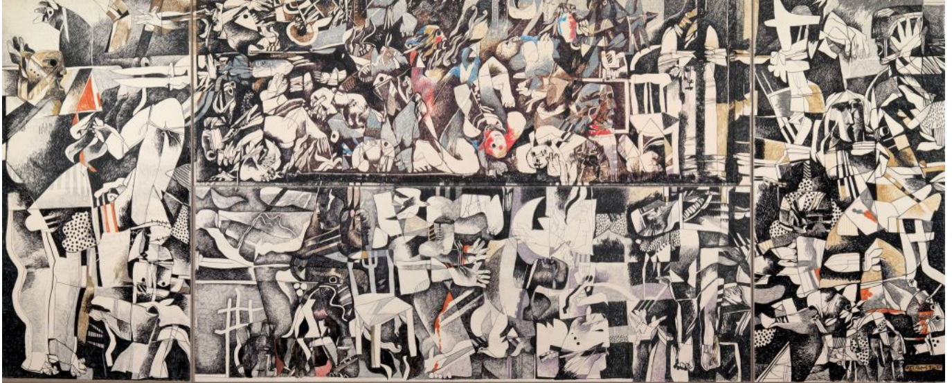
《贝鲁特难民营大屠杀》迪亚·阿扎维（伊拉克）作于1982—1983年

推动这一转变的“划时代力量”（the epochal forces that propelled）。然而，这种转型并不完全。西方对金融、资源、科学和技术的控制已经减弱，但对信息和军事力量的控制并未式微。这种军事力量是一种幽灵般的存在，它以巨大的破坏力威胁着世界，以维持大都市或核心国家的影响力和权力。