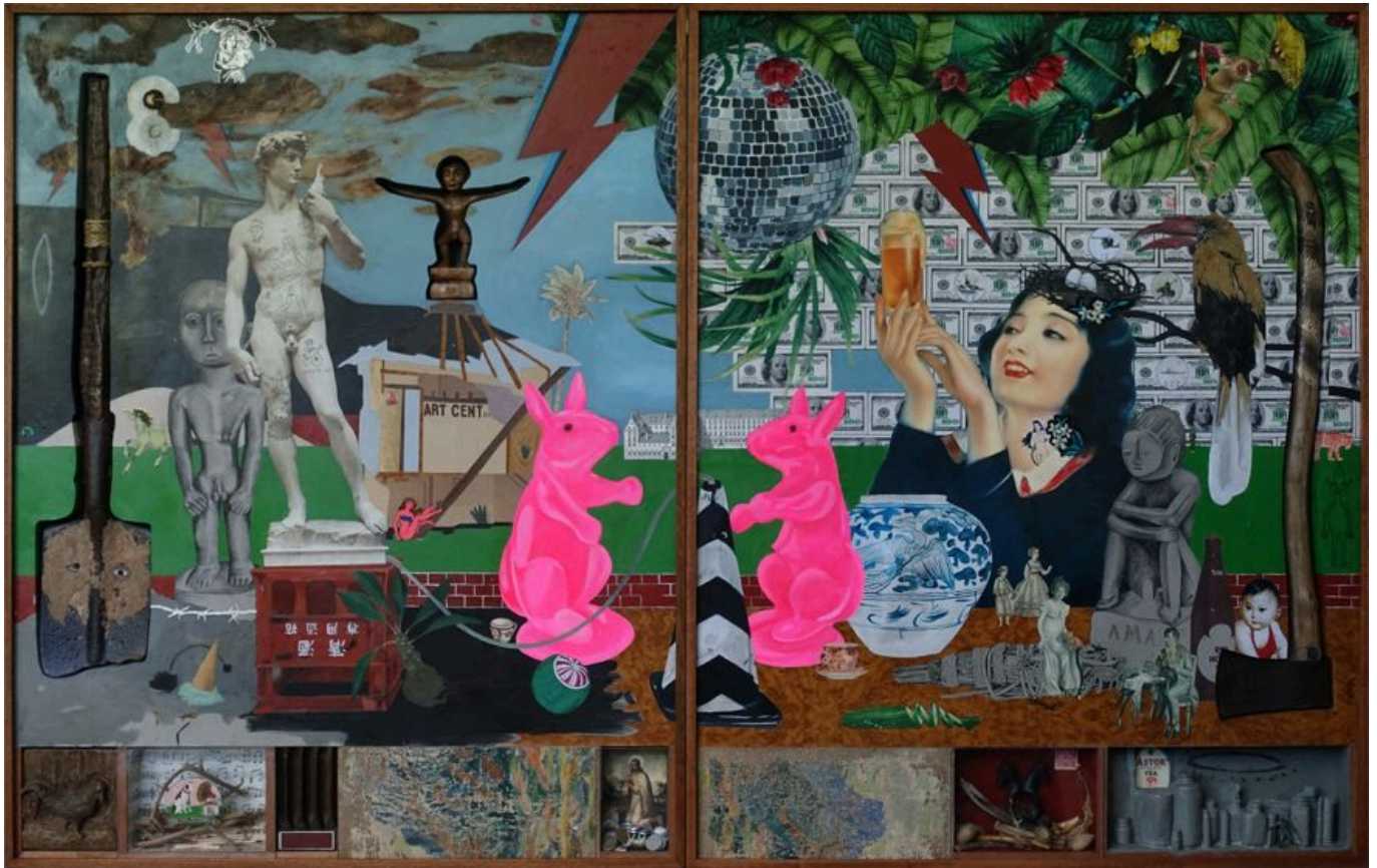
《货币的本质》卡瓦扬·德古亚（菲律宾）作于2017年