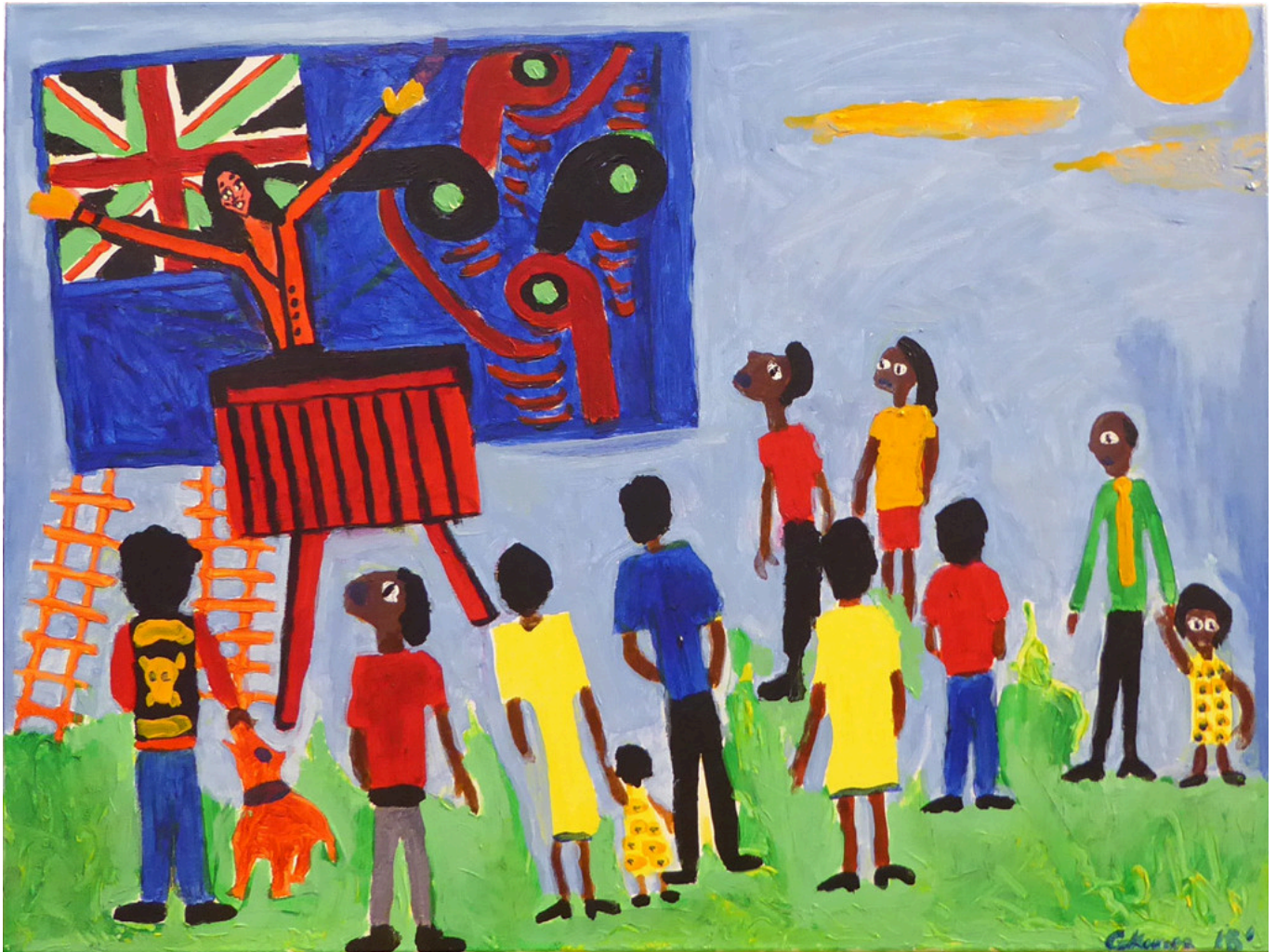
《杰辛达的计划》乔治·帕拉塔·基瓦拉（恩加蒂-波罗乌部族和特艾唐阿-阿马哈基部族[新西兰]） 作于2021年

中国对东亚和南太平洋的其他国家构成威胁，而在于中国正在阻止美国在该地区和周边水域发挥主导作用——包括中国领海范围外的水域，美国在那里与其盟国举行了“航行自由”联合军演。肯德尔继续道：“我并不是说太平洋地区的战争迫在眉睫或不可避免。事实并非如此。但我要说的是，这种可能性正在增加，并将继续增加。”