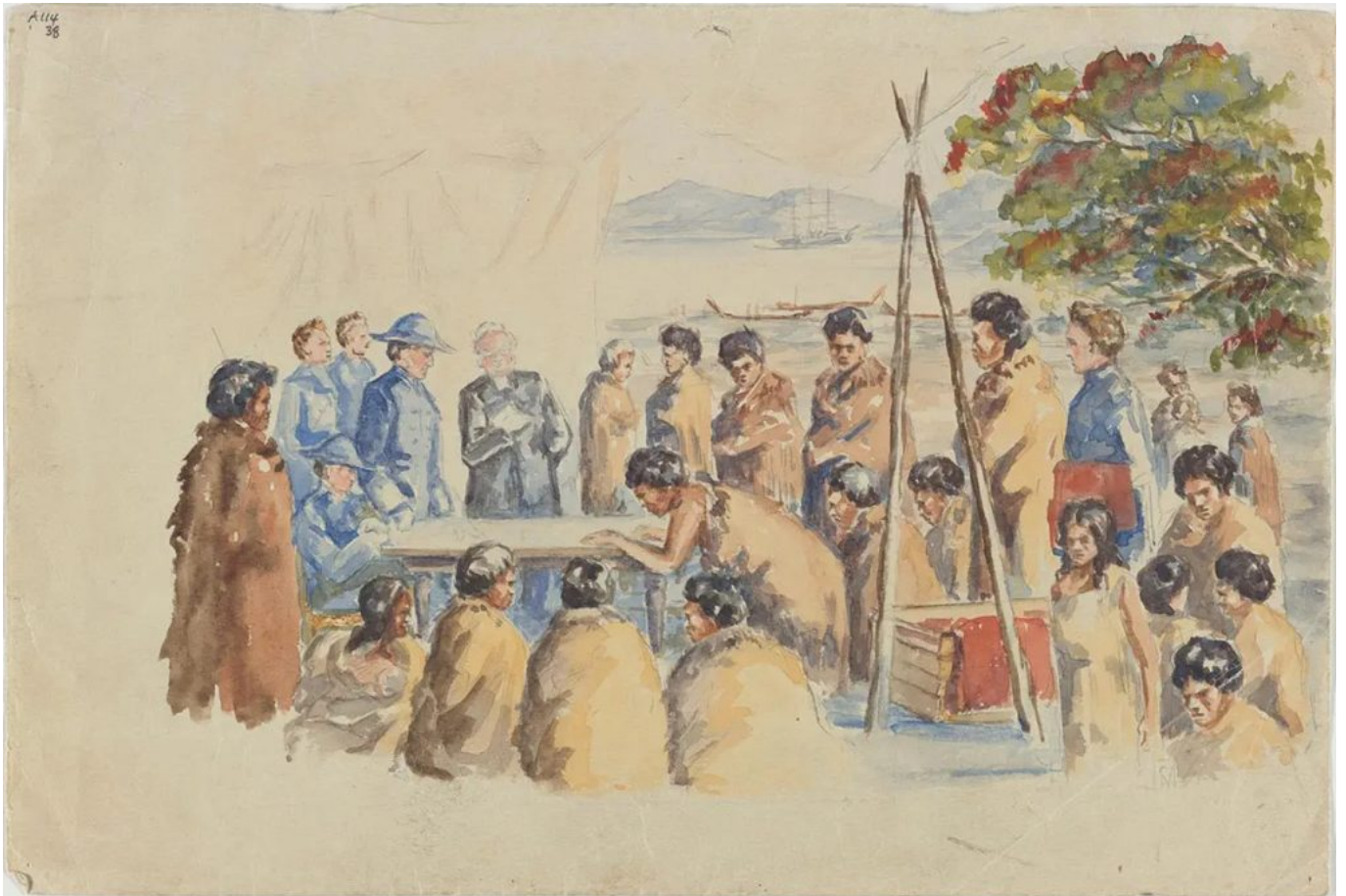
《〈怀唐伊条约〉签订时的场景重现》奥里瓦·塔胡波蒂基·哈登（恩加提-鲁阿努伊部落[新西兰]）作于约 1940 年