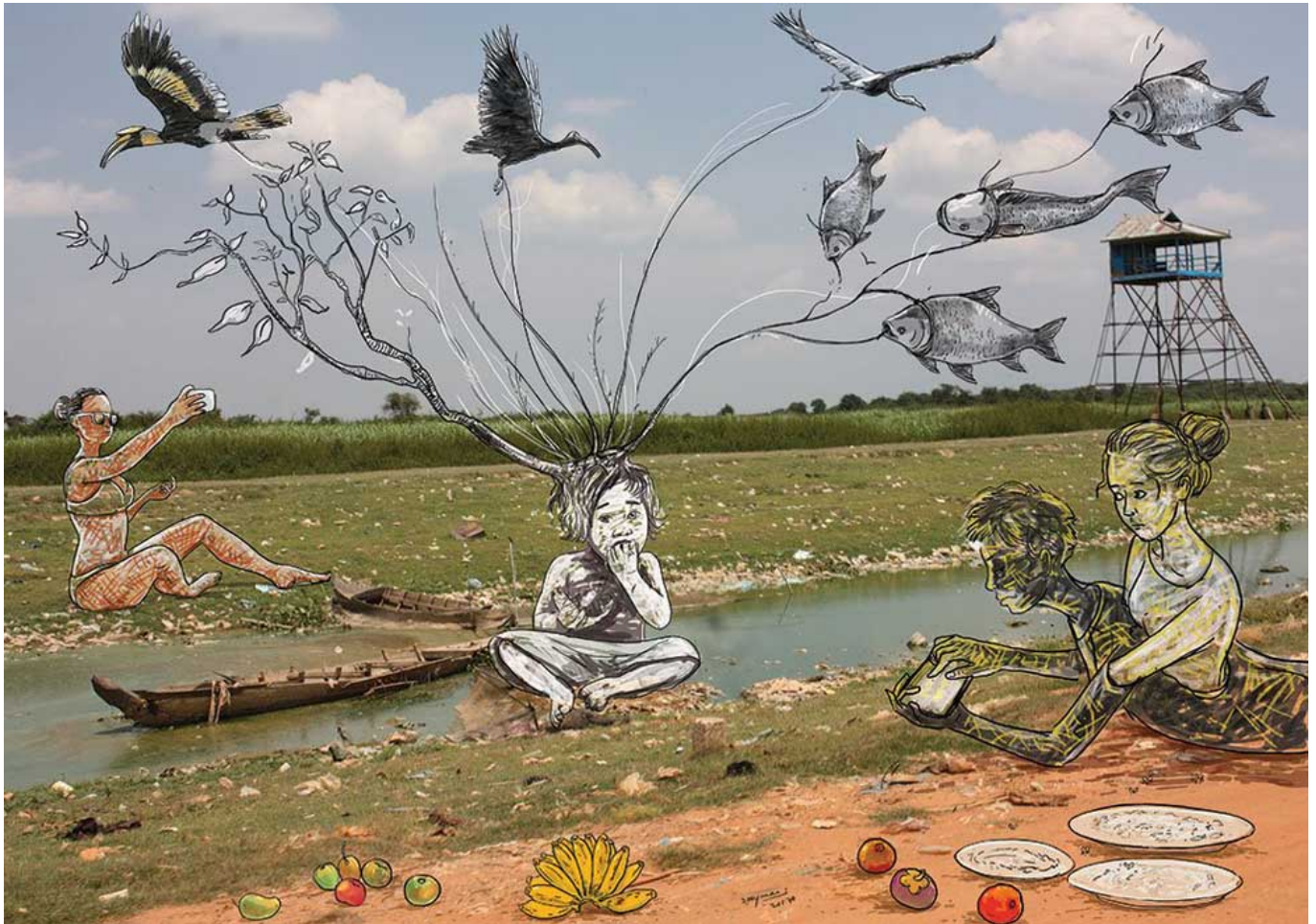
《剩余》，萨奥·斯雷茂（柬埔寨）作于2017年