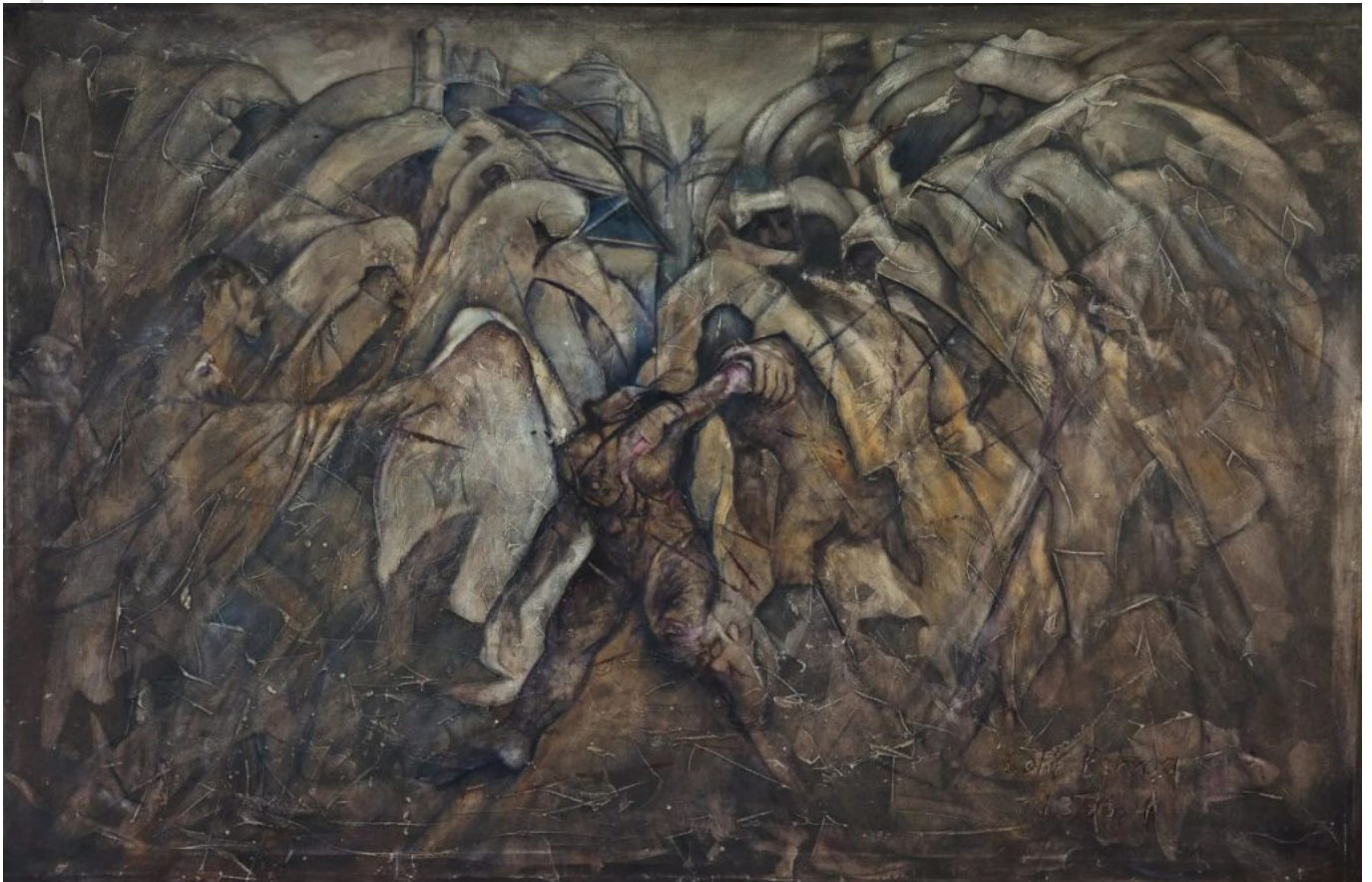
《法尔洪达》，拉蒂夫·埃什拉克（阿富汗）作于2017年

结论： 目前全球人口为80亿。因此，目前的粮食产量不仅足以养活全世界所有人口，还能额外供养30亿人。