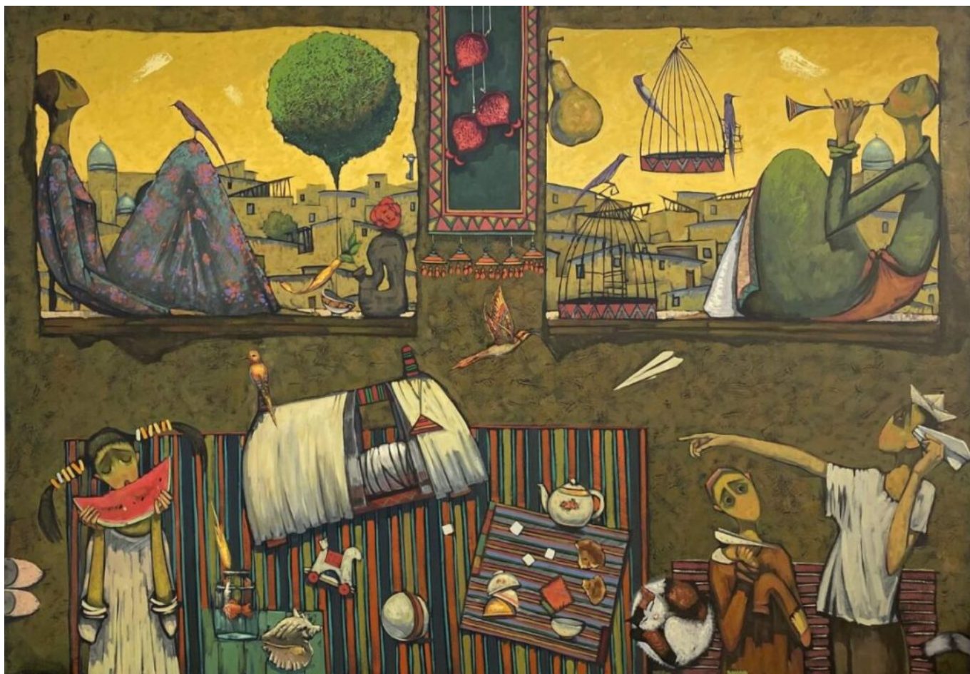
《炉火》，马克苏德·米尔穆哈梅多夫（塔吉克斯坦）作于2020年