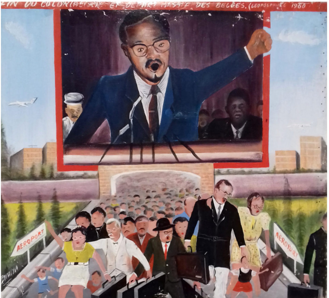
《卢蒙巴的演讲》多米尼克·布瓦利亚·姆万多（刚果民主共和国）作于2005年

在上世纪70年代和80年代，这些努力汇聚成建立世界信息与传播新秩序的运动，以解决发达国家和发展中国家之间在此领域上的全球失衡。这一想法影响了联合国教科文组织的国际传播问题研究委员会（International Commission for the Study of Communication Problems），又名麦克布赖德委员会（MacBride Commission），它成立于1977年，主席是爱尔兰政治家、诺贝尔和平奖得主肖恩·麦克布赖德。该委员会在1980年就此话题发布了一份重要但读者寥寥的 报告 ，题为《多种声音，一个世界》（ Many Voices, One World ）。而美国对这些倡议的回应就是在1984年退出联合国教科文组织。上世纪80年代的媒体私有化进程最终扼杀了第三世界建立主权媒体网络的努力，哪怕有些网络是反共的，比如1981年在马来西亚吉隆坡成立的亚太新闻网（Asia-Pacific News Network）。