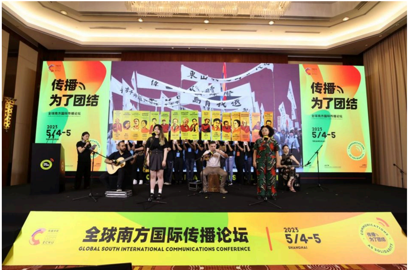
2023年5月4日，全球南方国际传播论坛开幕式文化表演

完全失语，而一种狭隘的外来世界观却对这些国家自身面临的困境（比如战争、饥饿等）指手画脚。在这场复兴之中，今年5月初，全球南方数百位编辑、记者在中国上海相会，参加全球南方国际传播论坛。在为期两天的热烈讨论之后，与会者起草并通过了《全球南方国际传播论坛（2023）上海学术共识》，以下是全文：