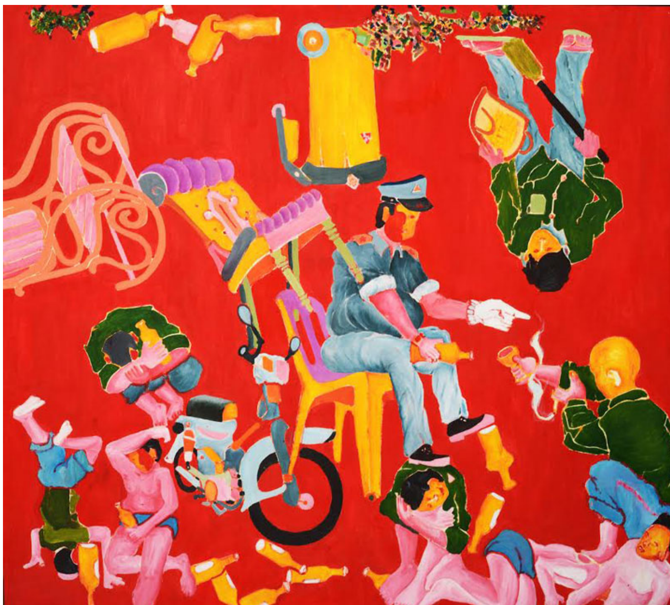
《颠倒的下水道》麻斯·索克霍恩（柬埔寨）作于2014年