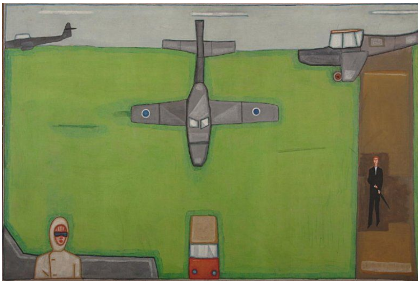
《偌大的机场》耶日·诺沃谢尔斯基（波兰）作于1966年

在一个剥夺了必要社会保障的利益体系中，数十亿人艰难维持着最基本的生活状态。饥饿和文盲等问题就是这一悲惨世界的明证。无怪乎，众多难民、饥民、洪灾灾民要四处流浪了。