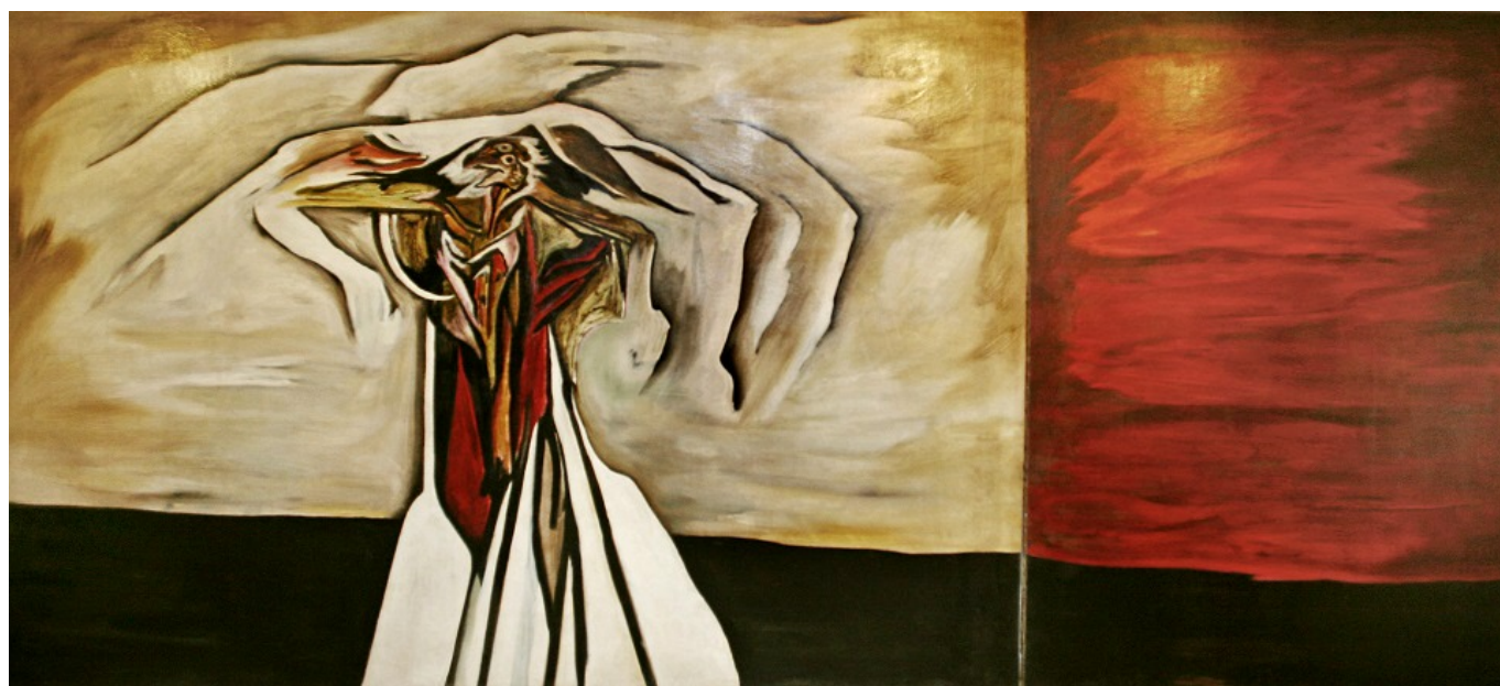
《变形记2》海梅·德·古兹曼（菲律宾）作于1970年