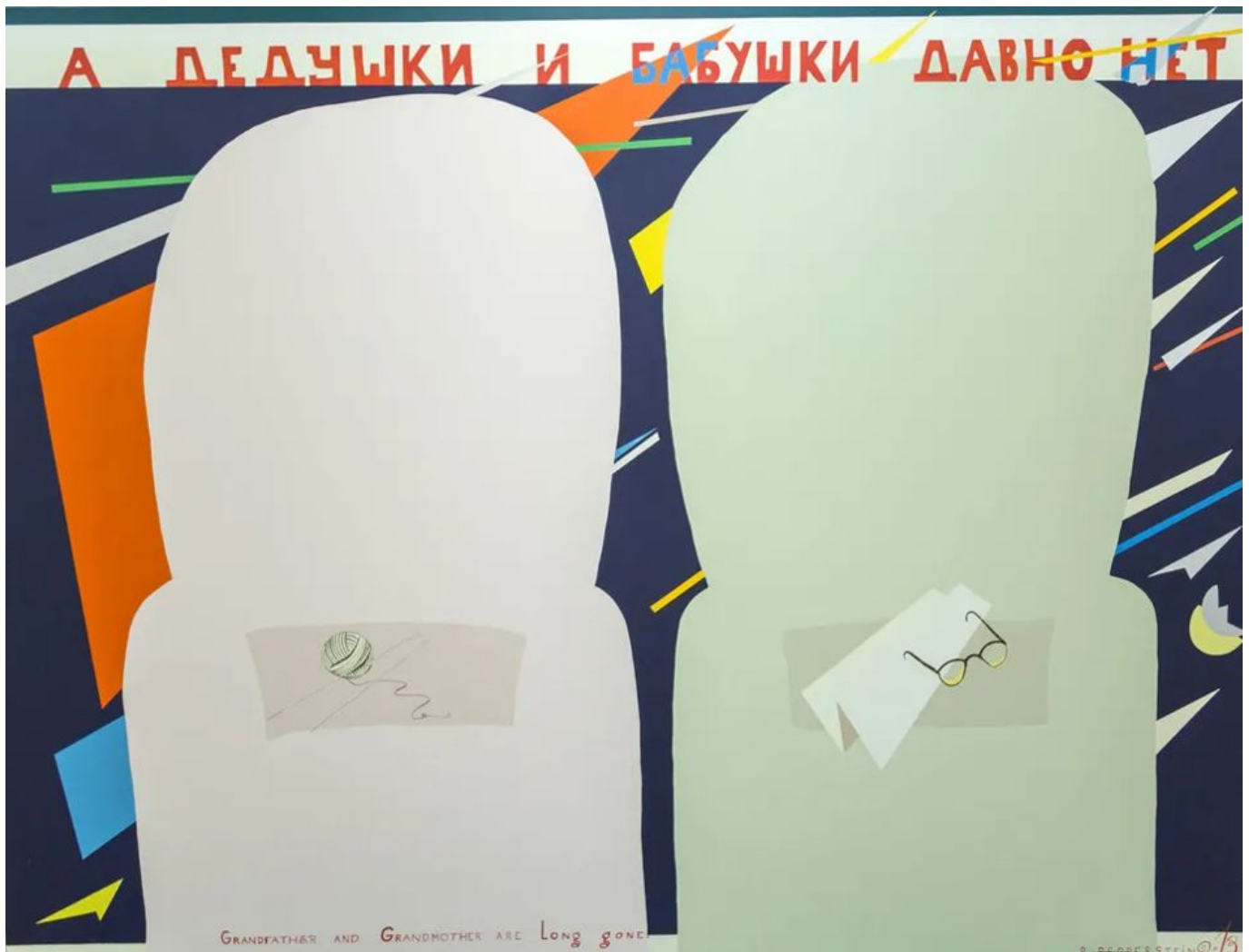
《教父教母早就不在了》帕维尔·佩珀斯坦（俄罗斯）作于2013年

然而，北约的野心大大超越了“欧洲一大西洋”地区，而延伸到了全球南方。为在亚洲建立据点，北约首次欢迎日本、韩国、澳大利亚、新西兰参加峰会，宣称“印太地区对北约很重要”。更为甚者，北约《战略概念》与200年前的门罗主义（1823年）一脉相承，称“非洲和中东”为“北约的南方邻居”。斯托尔滕贝格还心怀不轨地 表示 “中俄在（北约）南方邻居的影响力日益增强”，构成了“挑战”。