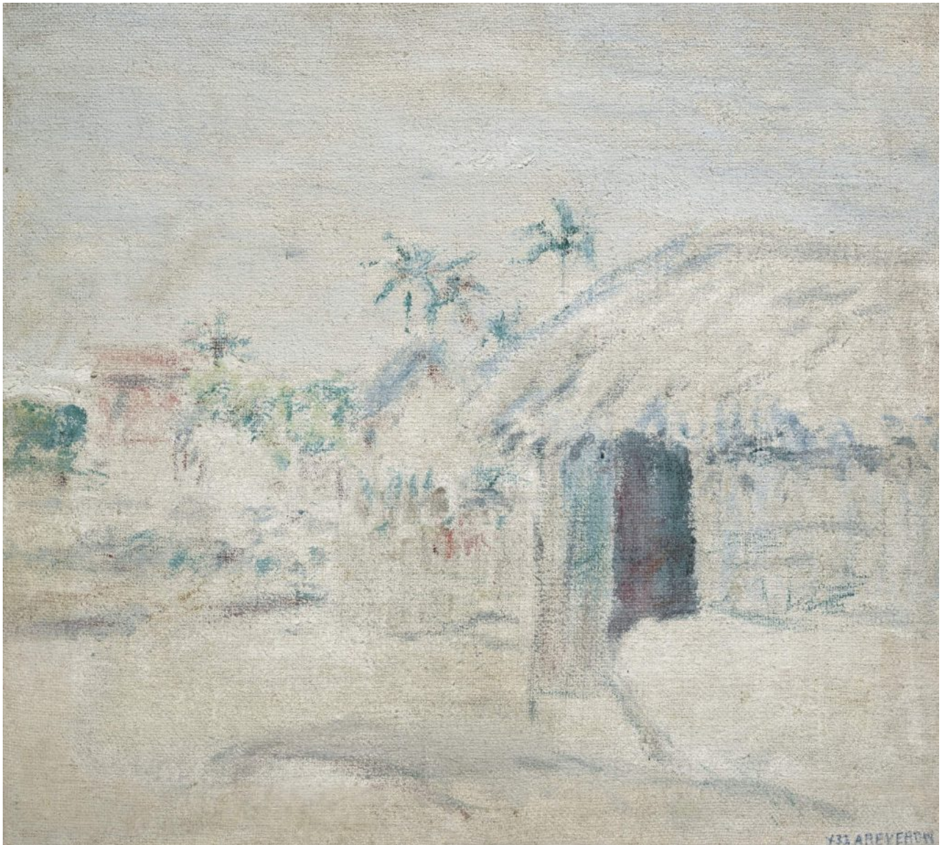
《牧场》，阿曼多·雷韦龙（委内瑞拉）作于1933年

例如，美国拥有国际货币基金组织董事会 16.49% 的投票权，却仅占全球人口的 4.22%。鉴于国际货币基金组织《 协定条款 》（Articles of Agreement）规定，任何修改都必须获得85%的投票支持，美国因此组织的决策拥有否决权。结果，国际货币基金组织的高级职员在政策制定上往往听从美国政府的意见；此外，鉴于该组织总部设在华盛顿特区，国际货币基金组织还经常就其政策框架和具体政策决定与美国财政部进行磋商。