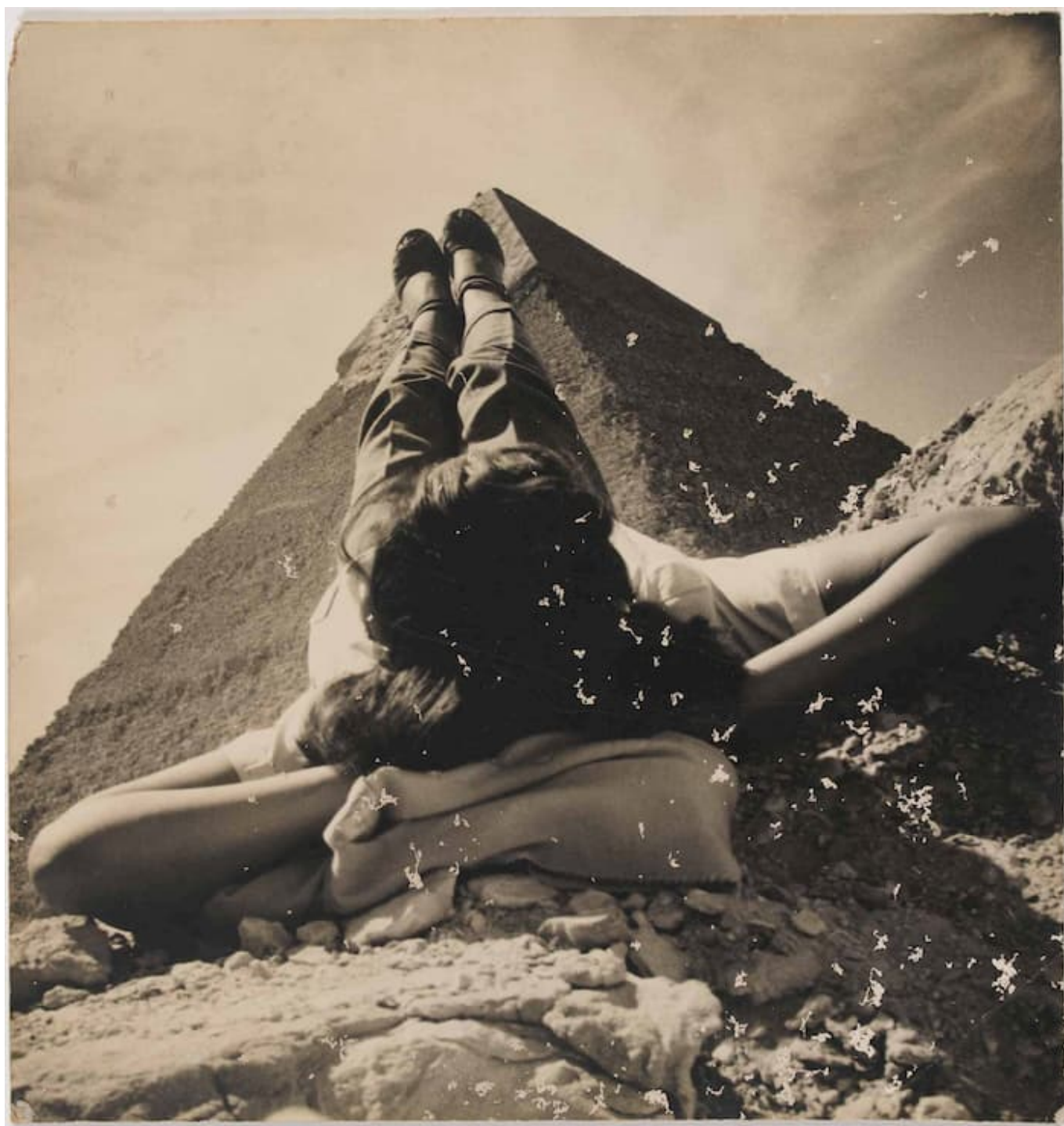
Abduh Khalil (埃及), 《无题》, 1949

现在，冠状病毒已经悄然进入巴勒斯坦。最令人震惊的是，在加沙，世界上最大的露天监狱中，至少有一例确诊病例。巴勒斯坦共产主义诗人萨米·阿尔卡西姆 (Samih al-Qasim) (1939-2014) 曾称自己的祖国为“大监狱”，在这个被隔绝的国度，他写出了伟大的诗歌。其中一首《午间的坦白》简要介绍了紧缩政策和新自由主义对世界造成的精神损害：