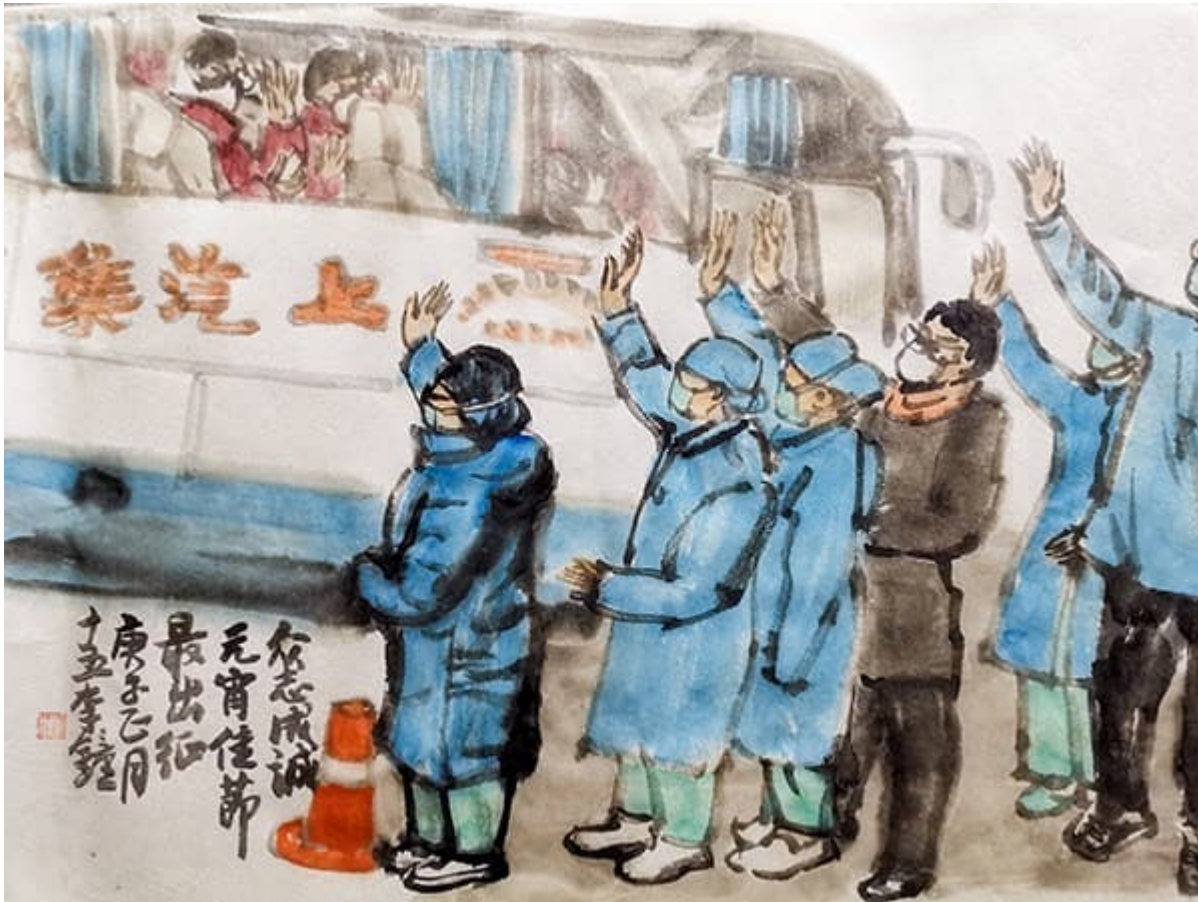
李钟（中国），《众志成城抗击疫情》，2020

都没有基础防护。在迅速蔓延的全球性流行病面前，挽救生命的人往往得到的回报是最少的。当全球性流行病来袭时，私营部门的紧缩模式直接分崩离析了。