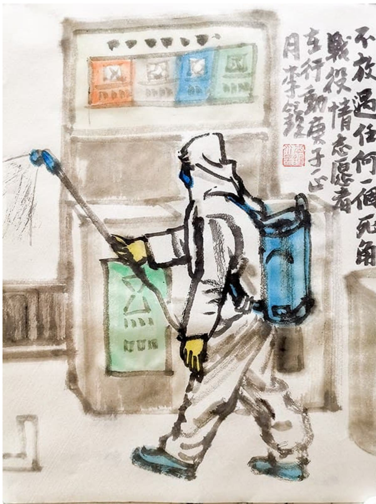
李钟（中国），《众志成城抗击疫情》，2020