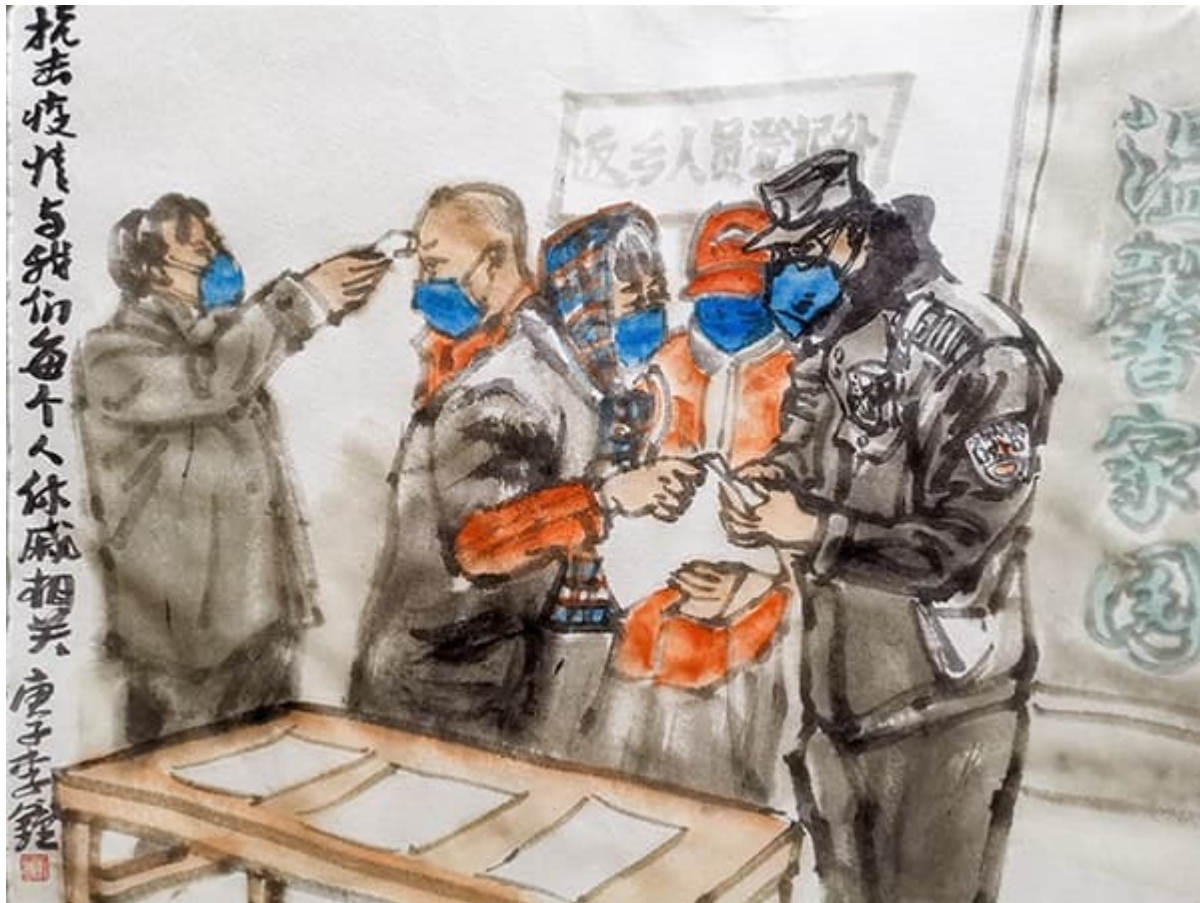
李钟（中国），《众志成城抗击疫情》，2020

当然，冠状病毒是一个严重的问题，可以肯定的是，其对人体的危害导致了它的传播。但是有些社会问题需要认真思考。任何讨论的关键都必须是大多数资本主义世界中国国家机构的彻底崩溃，在资本主义世界中，国家机构已被私有化，而私人机构在努力使成本最小化和利润最大化。