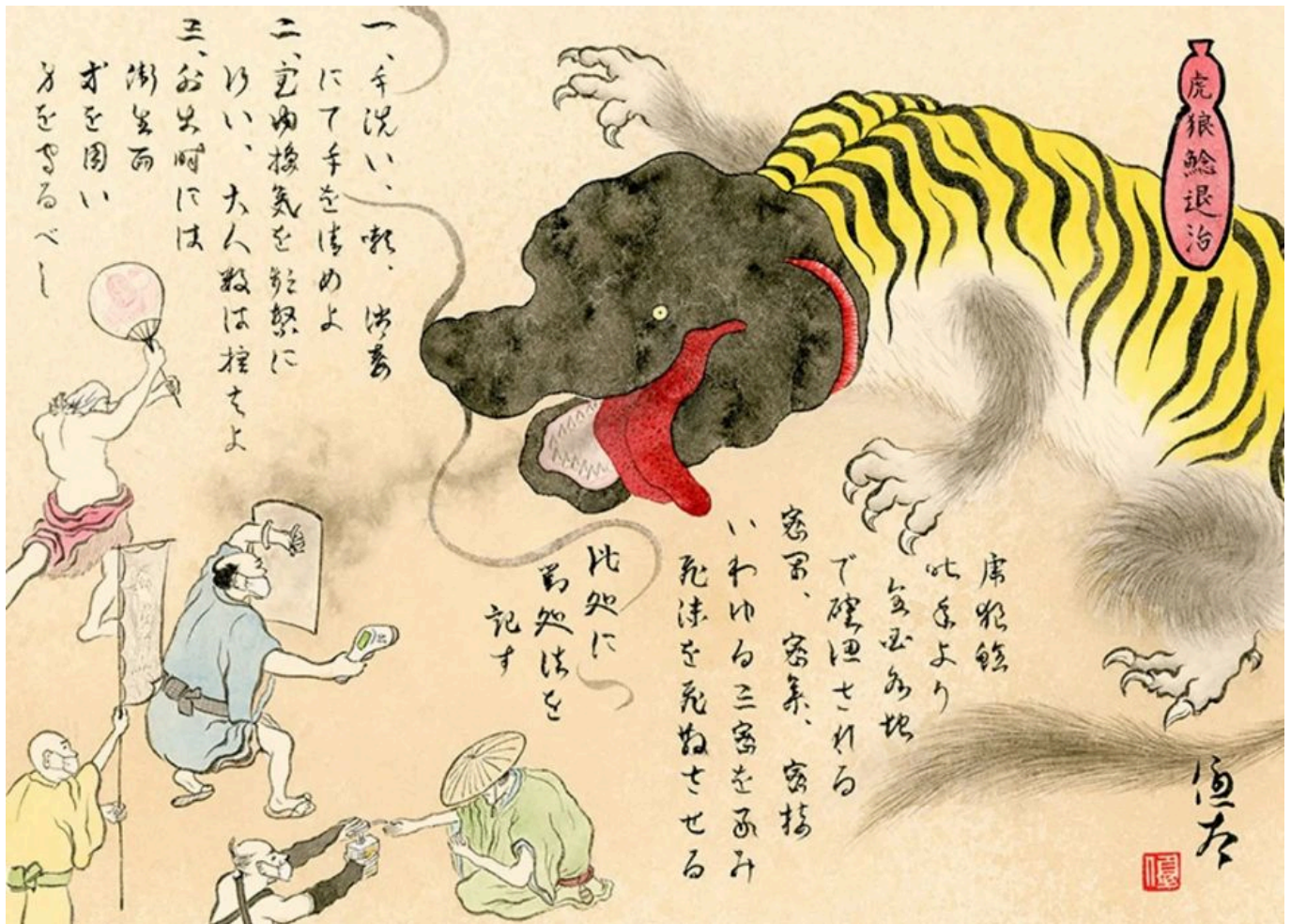
《消灭虎狼鯨》丹羽優太（日本）作于2021年

美日韩三边同盟是在亚洲达到北约级能力（即武装部队、基础设施和信息方面的互操作性）的重要一步。今年8月戴维营会议上达成的协议要求各国 承诺 每年召开年会和军事演习。通过这些战争演习，三国军队能够演练实时共享数据和协调活动。此外，美国孜孜以求的日韩《军事情报安全总协定》（GSOMIA） 扩大 了两国间的军事情报共享，“不仅限于朝鲜导弹和核计划，还包括来自中国和俄罗斯的威胁”。这使美日韩能够形成共同作战构想，而这正是东北亚军事战场互操作性的基础。