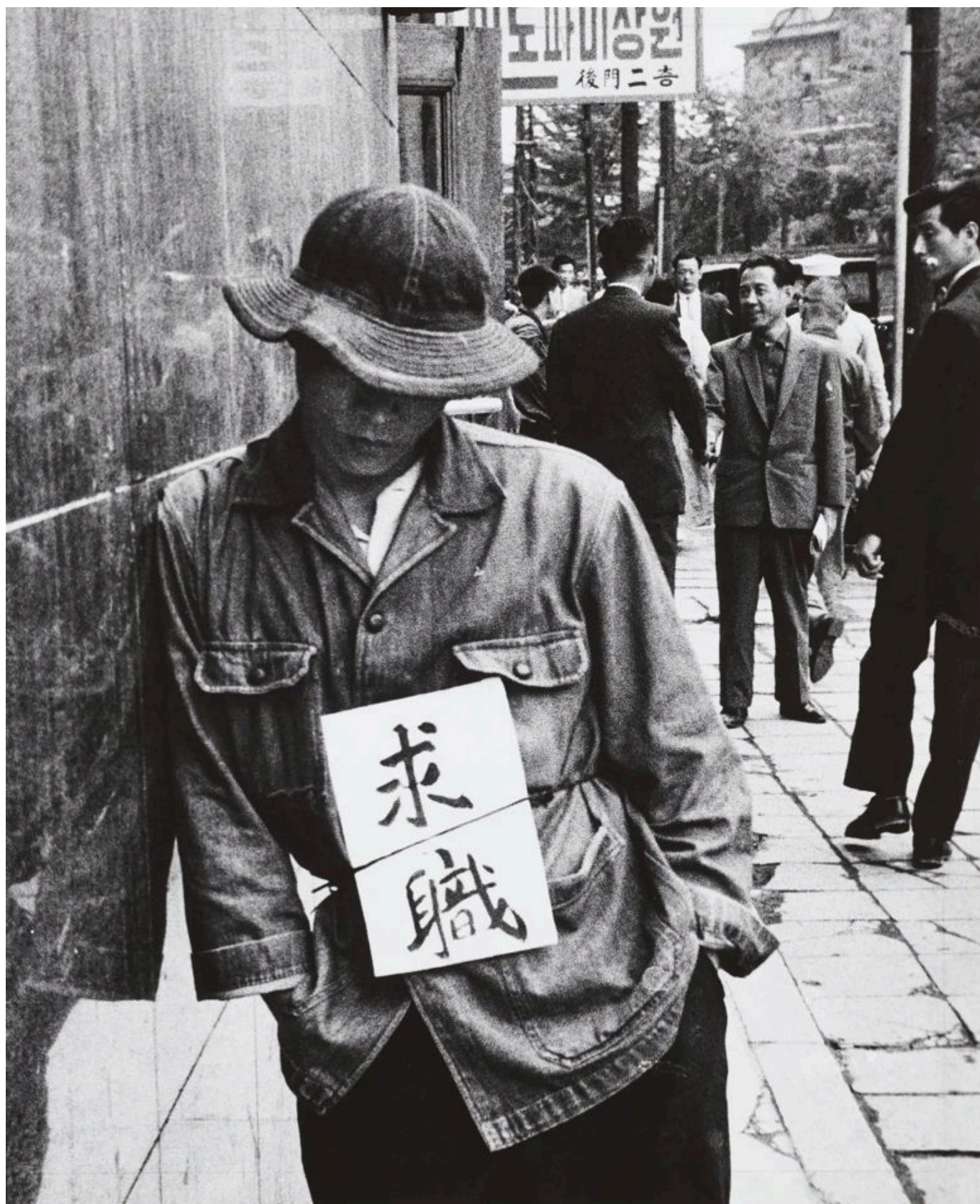
《求职》林应植（韩国）摄于1953年