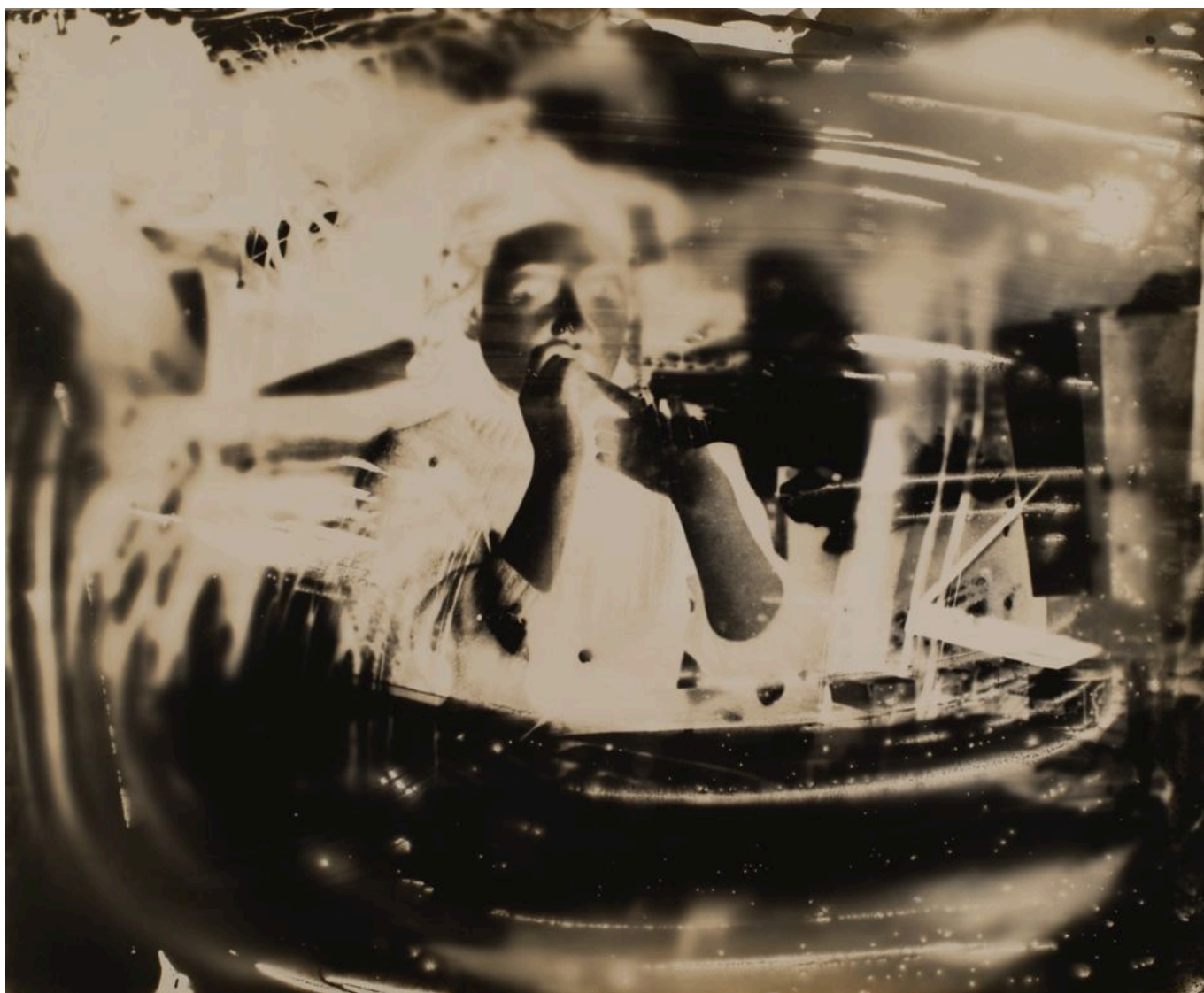
《闪烁之相》大西茂（日本）作于20世纪50年代