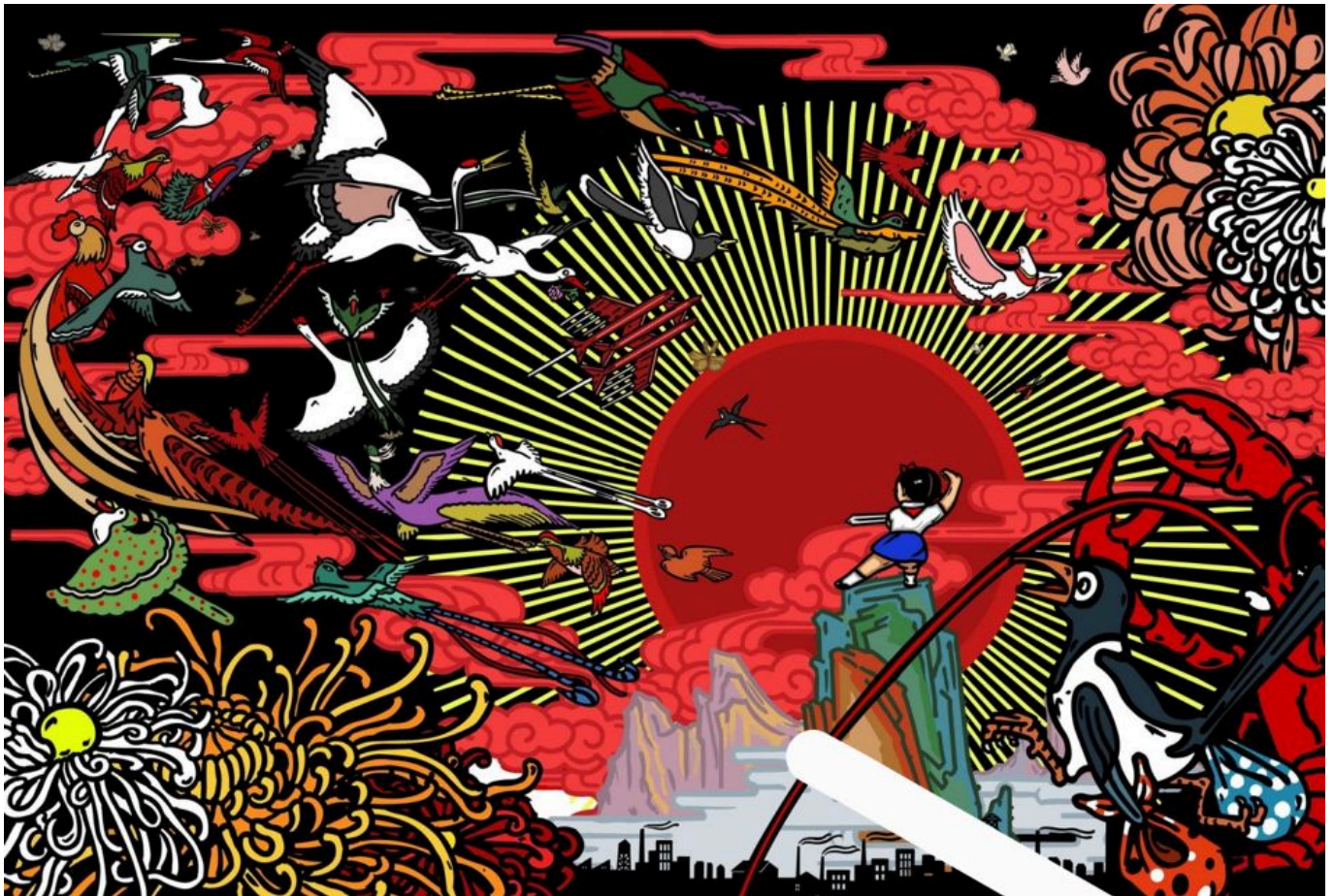
《精进勇猛》，卜桦（中国）作于2014年

正是阿莲、多纳·尼娜和“巴托丽娜”们起草了“世界妇女大游行”（ World March of Women ）的经济自主权诉求。本期新闻稿的结尾就引用她们的呼吁：