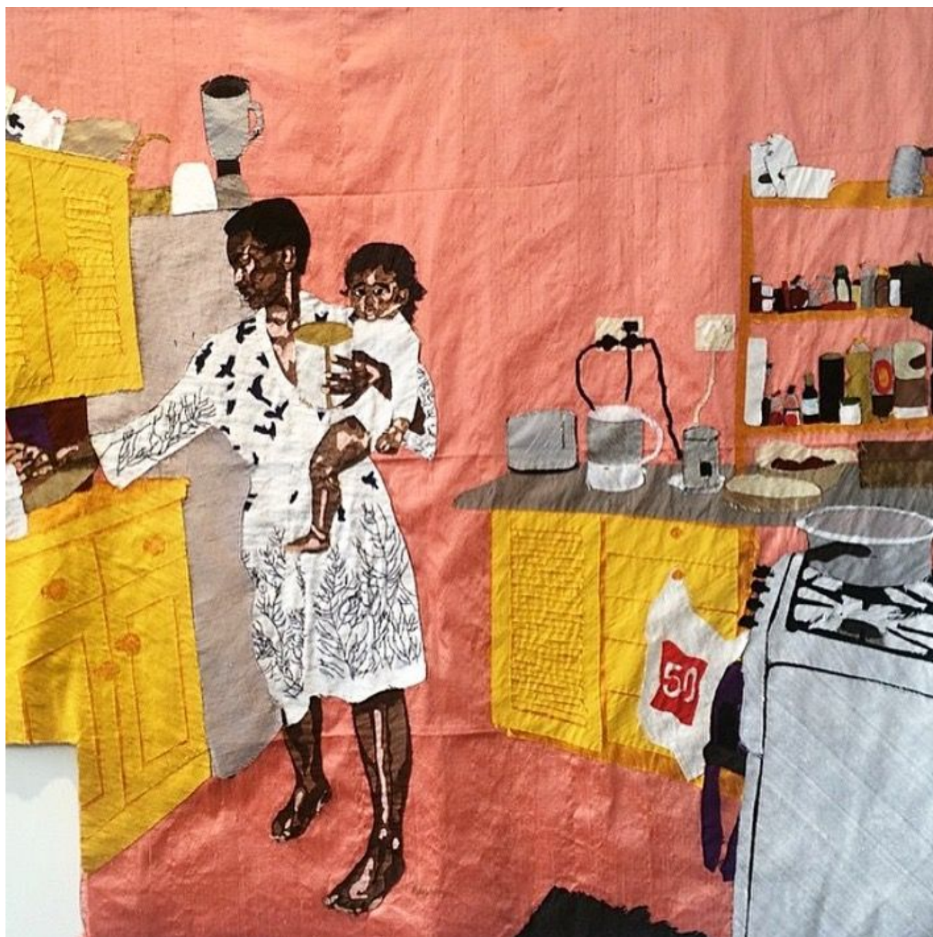
《玫瑰少年》比莉·赞格瓦（马拉维）作于2015年