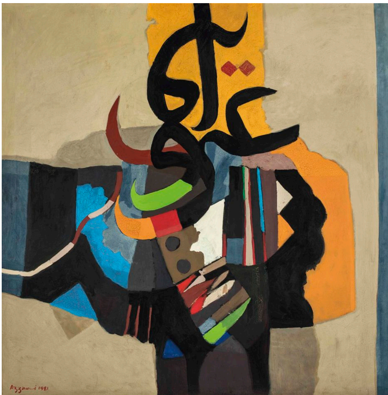
《献给伊拉克》迪亚·阿尔阿扎维（伊拉克）作于1981年

在美国1945年对广岛、长崎进行核打击后，世界和平理事会发表了《斯德哥尔摩和平呼吁书》：