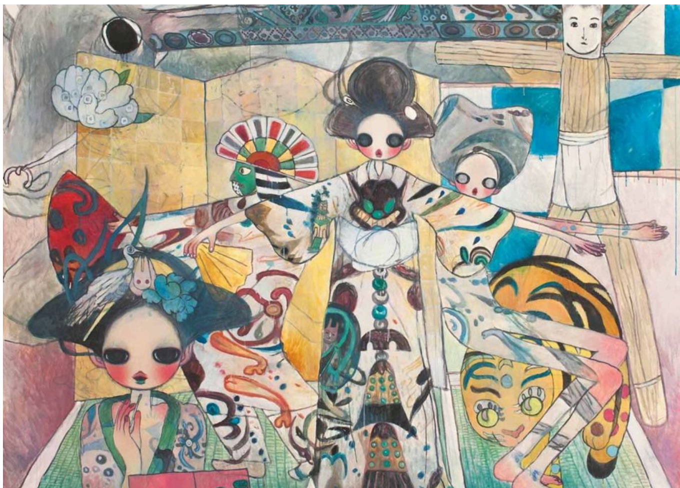
《敦煌的房间》高野绫（日本）作于2006年

该专题的第一份 研究报告文集 《美国正在发动一场新冷战：社会主义视角》（ The United States Is Waging a New Cold War: A Socialist Perspective ）是我们与《每月评论》（ Monthly Review ）、“拒绝新冷战”（ No Cold War ）组织合作编写的，其中的文章全面评价了美国通过谋求核优势、不惜发动“有限核战争”等手段企图继续主导国际体系的政策。普林斯顿大学2020年 模拟 的核战争显示，任一核大国的一次战术打击就足以直接导致9150万人死亡。研究人员认为：“核微粒等长期因素所致死亡人数将大大增加上面的估计。”