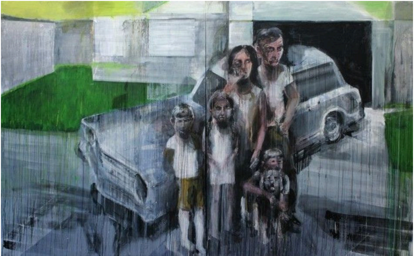
《美国人》 博什蒂扬·尤里奇·维加（斯洛文尼亚）作于2011年

“以短期痛苦换取长期收益”的态度决定了美国及其西方盟友与中俄两国的危险对抗升级。美国的立场耐人寻味之处在于，它企图阻止一个看似不可避免的历史进程，即欧亚一体化进程。在美国房地产市场崩溃，西方银行业发生严重信贷危机之后，中国政府与其他南方国家一道着手建立一系列不依赖欧美市场的平台。这些平台包括2009年成立的金砖国家组织（巴西、俄罗斯、印度、中国、南非）、2013年宣布的“一带一路”计划。俄罗斯的能源供应及庞大的金属和矿产资源，加上中国的工业产能和科技能力吸引许多政治倾向不同的国家加入了“一带一路”计划，而俄罗斯的能源出口也很好地支撑了这些合作。这些国家包括波兰、意大利、保加利亚、葡萄牙等，而德国现在是中国最大的商品贸易伙伴。