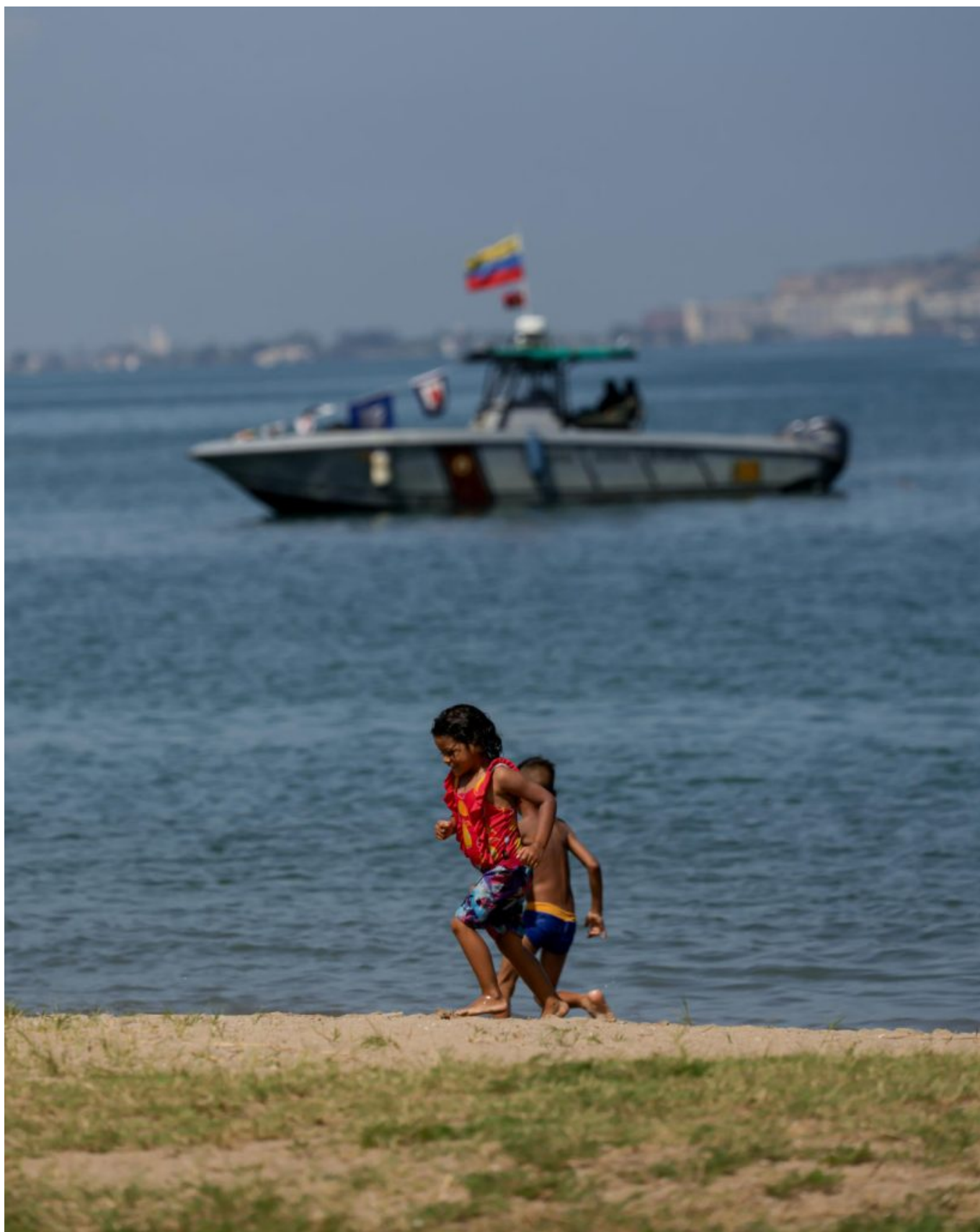
2025年9月19日的一次安全部署期间，儿童在委内瑞拉安索阿特吉州的海滩上玩耍。