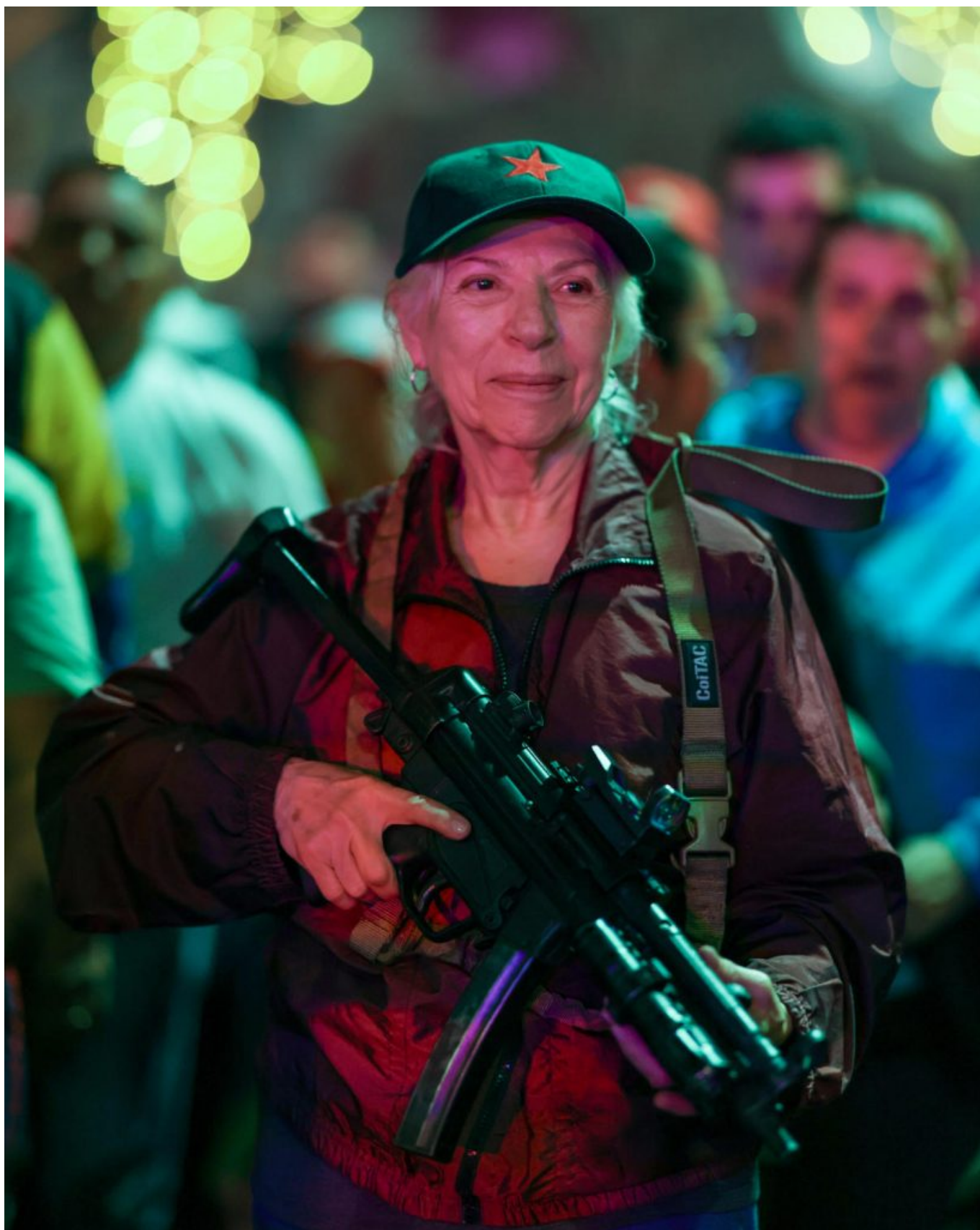
2025年10月15日，委内瑞拉加拉加斯佩塔雷社区的一次安全部署期间，一名女子手持步枪。