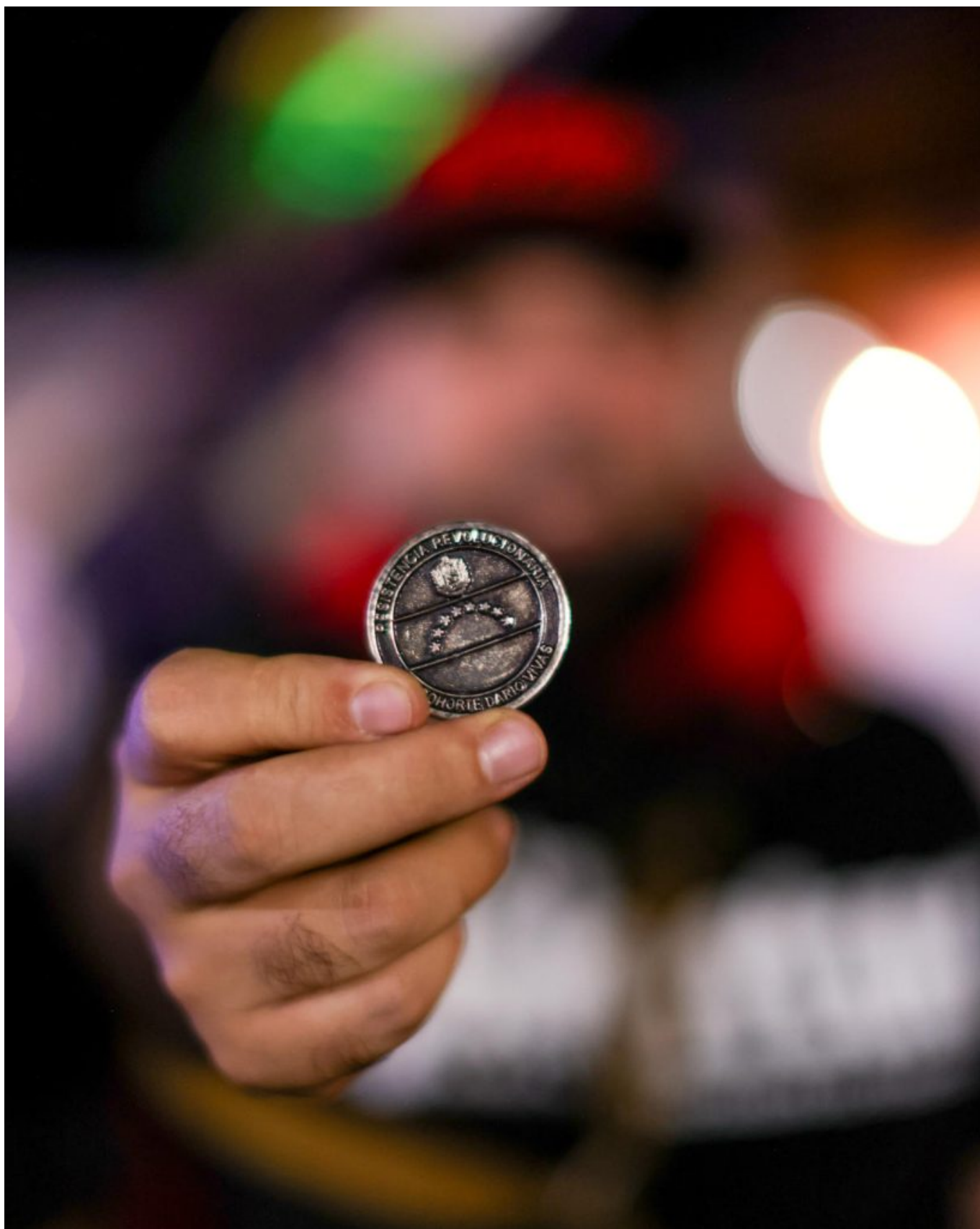
2025年10月，在拉瓜伊拉的一次安全部署期间，委内瑞拉社会主义青年团（Socialista de Venezuela）的一名成员展示“革命抵抗战术方法”课程毕业生的纪念币。该课程以越南武元甲大将（General Võ