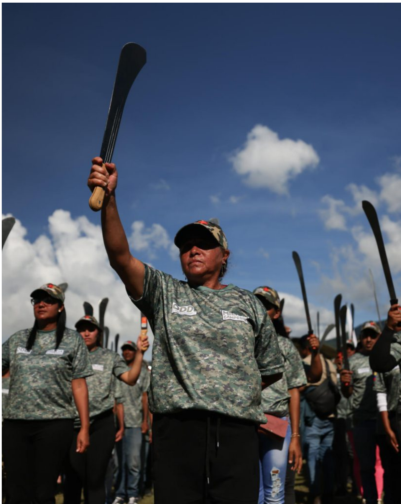
2025年10月，一位女性农民民兵（Milicia Campesina）在“革命抵抗战术方法”课程战斗员毕业仪式上手持砍刀。