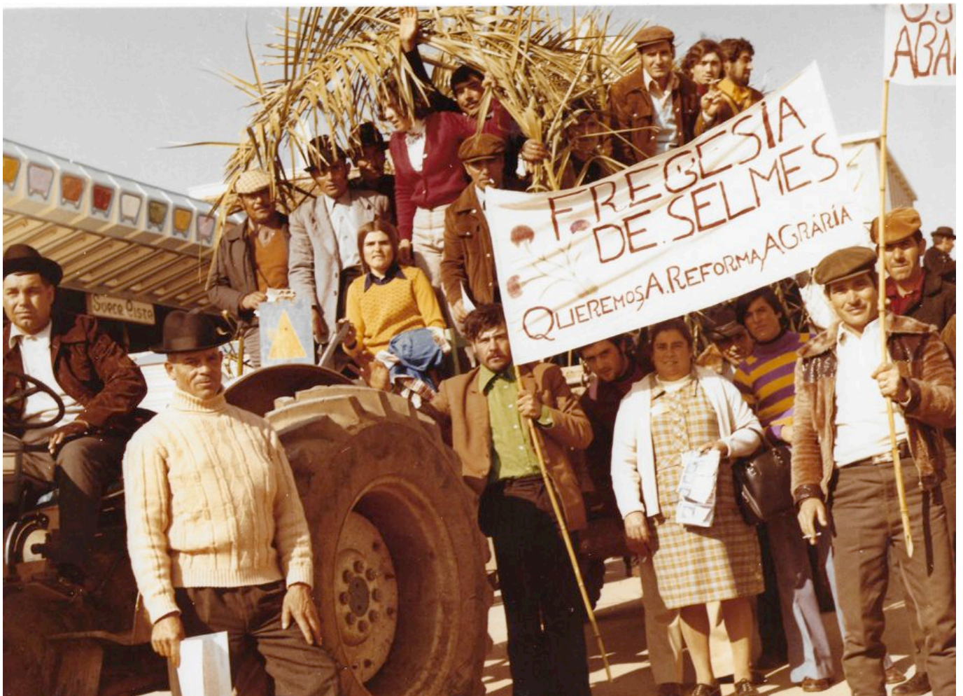
《贝贾农民要求土地改革》约翰·格林（英国）作于1974年

十多年前，我参观了里斯本的阿尔朱贝抵抗与自由博物馆（Aljube Museum – Resistance and Freedom），这里在1928年到1965年间曾是关押政治犯的酷刑场所。在此期间，数以万计的工会会员、学生活动分子、共产主义者和各类造反者被带到这里遭受酷刑，许多人被杀害，且往往是用极其残忍的方式。博物馆保存的数百个案例无不体现出这种残忍司空见惯。例如，1958年7月31日，施刑者将电焊工劳尔·阿尔维斯从阿尔朱贝监狱带到秘密警察总部的三楼，将他推下楼活活摔死。当时巴西驻葡萄牙大使阿尔瓦罗·林斯的妻子赫洛伊萨·拉莫斯·林斯开车路过，看到阿尔维斯掉下来摔死，并告诉了她的丈夫。当巴西大使馆找到葡萄牙内政部询问发生了什么事时，“新国家”独裁政府的回应是“不用这么震惊。只是一个无关紧要的共产党员。”