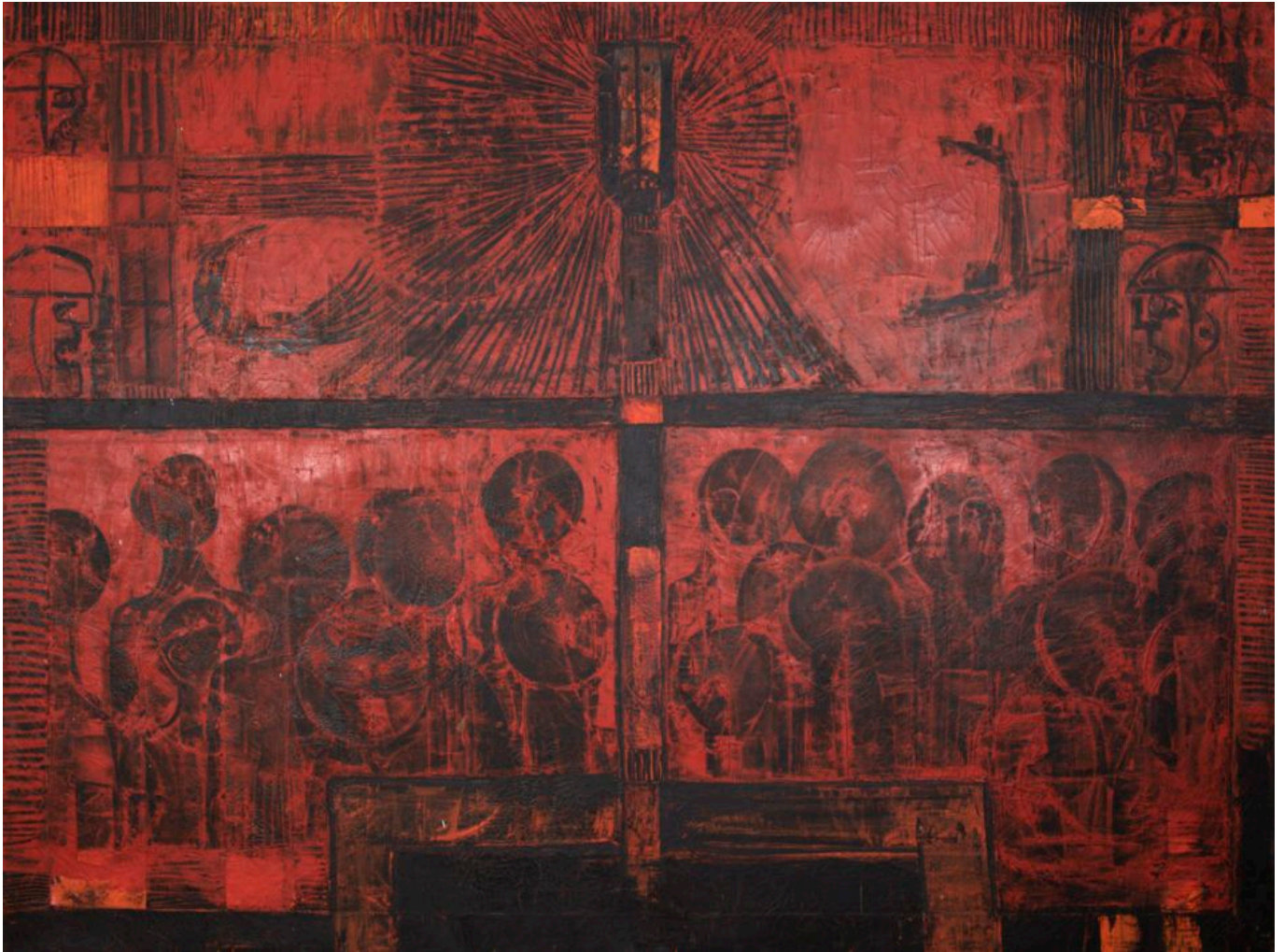
《致敬阿米尔卡·卡布拉尔》贝尔蒂娜·洛佩斯（莫桑比克）作于1973年

阿米尔卡·卡布拉尔（1924—1973）出生于整整100年前的那个9月，他在发展非洲力量反对“新国家”殖民主义方面比许多人做得都要多，但没能活着看到葡属非洲殖民地获得独立。1966年在古巴哈瓦那举行的三洲会议上，卡布拉尔警告说，仅仅摆脱旧政权是不够的，比推翻旧政权本身更困难的是在旧世界的基础上建立新世界，从葡萄牙到安哥拉，从佛得角到几内亚比绍，从莫桑比克到圣多美和普林西比都是如此。卡布拉尔说，去殖民化后的主要斗争是“与我们自身弱点的斗争”。他接着说，这场“与我们自己的斗争”是“最困难的斗争”，因为其斗争对象是我们社会“内部矛盾”、殖民主义造成的贫困以及我们复杂的文化结构中可悲的等级制度。