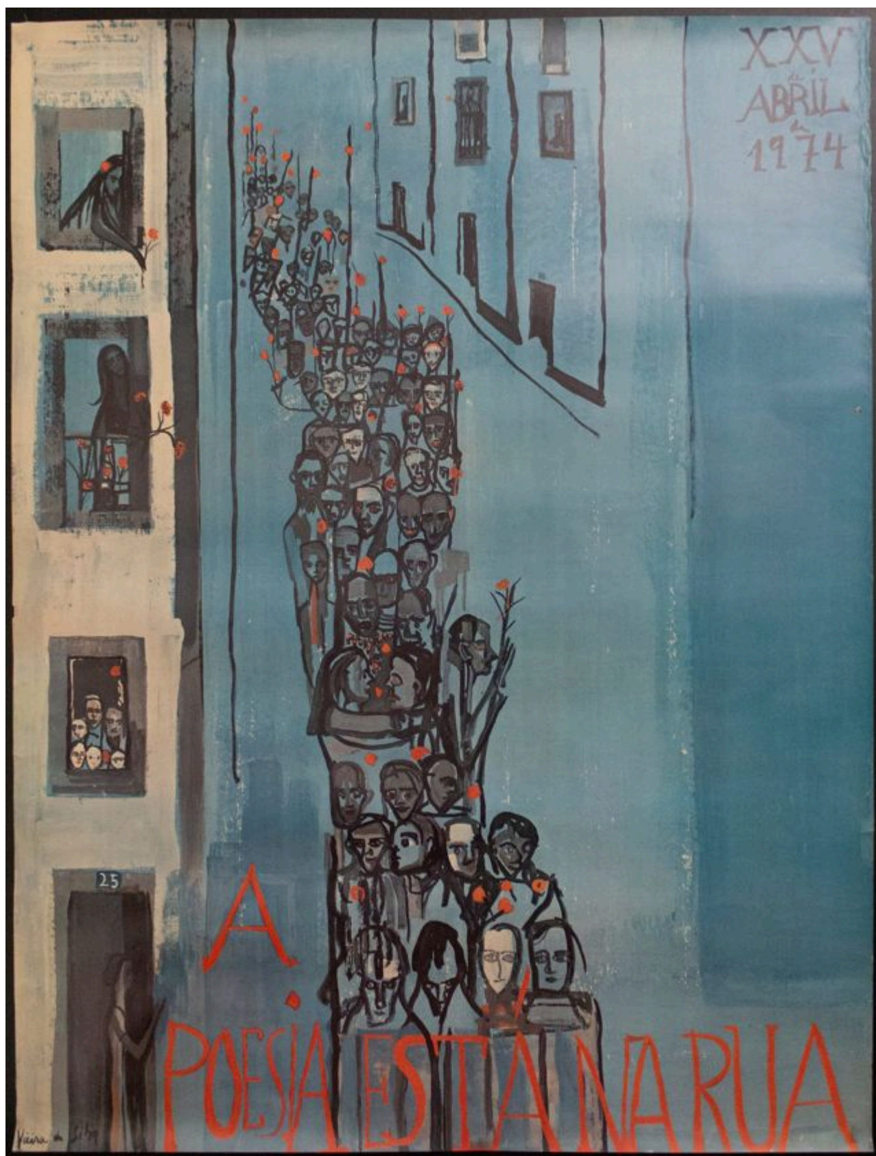
《诗歌走上街头·其一》玛丽亚·海伦娜·维埃拉·达·席尔瓦（葡萄牙）作于1974年