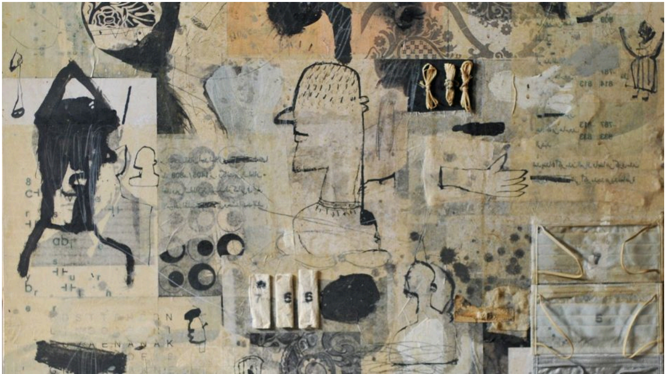
《无题》马哈茂德·奥拜迪（伊拉克）作于2008年

在一个由帝国主义阵营岌岌可危管理着的世界体系。不存在多重帝国主义，也不存在帝国主义之间的冲突。