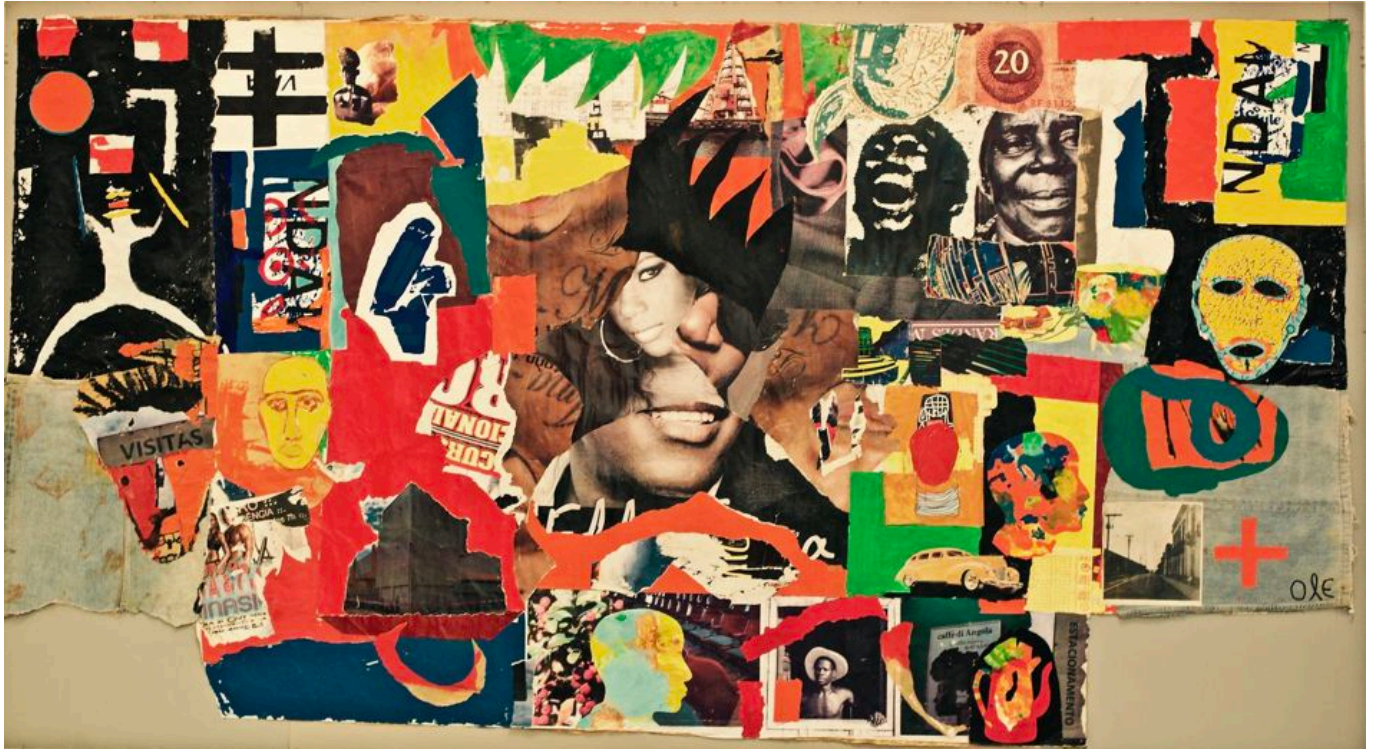
《马库卢索壁画》安东尼奥·奥莱（安哥拉）作于2014年

去年，欧盟和全球北方的核心机构北约联合 承诺 “调动自身拥有的政治、经济、军事等各种手段，努力实现我们的共同目标，造福于我们的10亿公民。”如果还没明白，再说明一下：这种力量（主要是军事力量和军事外交）不是为了服务人类，而只是为了服务他们的“公民”。