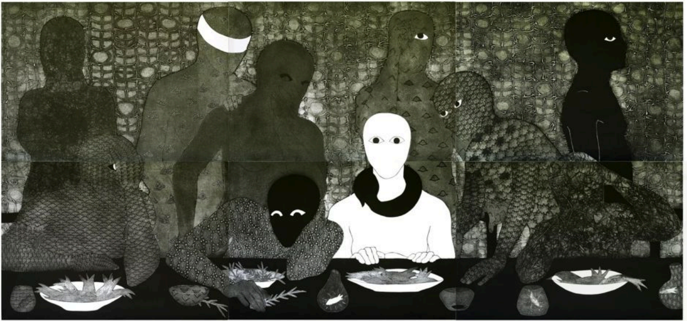
《晚餐》贝尔金斯·阿永（古巴）作于1991年

今年联合国大会关于终止美国对古巴长达60年封锁的年度决议，仅有美国、乌克兰和以色列三国没有投赞成票，这并非巧合（美国总统约翰·肯尼迪于 1962 年2月3日正式 实施 封锁，但封锁实际始于1960年）。美国封锁的不仅是古巴这个国家，还有古巴革命进程。1959年古巴革命明确宣布将捍卫古巴领土主权和提升古巴人民尊严，而美国认为这不仅威胁到其在古巴岛上的罪恶利益，还威胁到其维持对全球事务控制的能力，而革命进程的潜在蔓延有可能破坏这种控制。如果古巴能够在不屈从美国跨国公司的要求之下就能照顾好本国人民，甚至声援他国争取同样的权利，那么其他国家可能也会采取类似的态度。美国正是出于这种对主权的恐惧而启动了封锁政策。