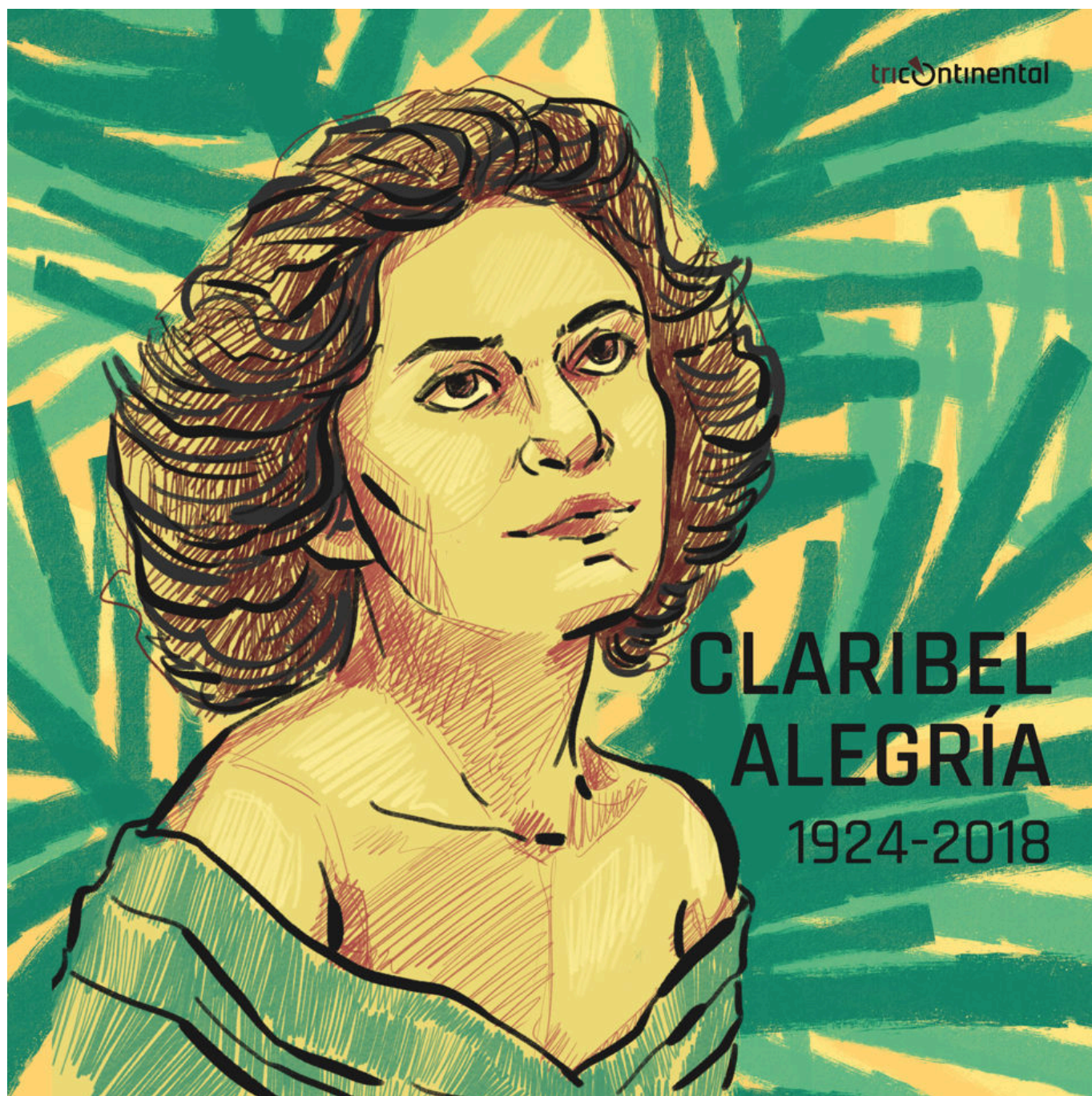
克拉里贝尔·阿莱格里亚

洪都拉斯正朝着这个方向前进。1月27日，希奥玛拉·卡斯特罗总统就任，成为该国第一位女性政府首脑。她当即承诺为本国近1000万人口中的100多万人免费供电。此举有助于最贫困的洪都拉斯人扩大文化视野，提高儿童在疫情期间的学习机会。希奥玛拉总统就职当天，我读到了尼加拉瓜-萨尔瓦多诗人克拉里贝尔·阿莱格里亚的优美诗句，她推动中美洲人民前进的拳拳之心流露于字里行间。1978年尼加拉瓜革命前夕，阿莱格里亚凭诗集《我生存》荣获美洲之家文学奖。她与D·J·弗拉科尔合著了《尼加拉瓜桑地诺革命：1855-1979年政治纪实》，这本关于桑地诺革命权威历史著作于1982