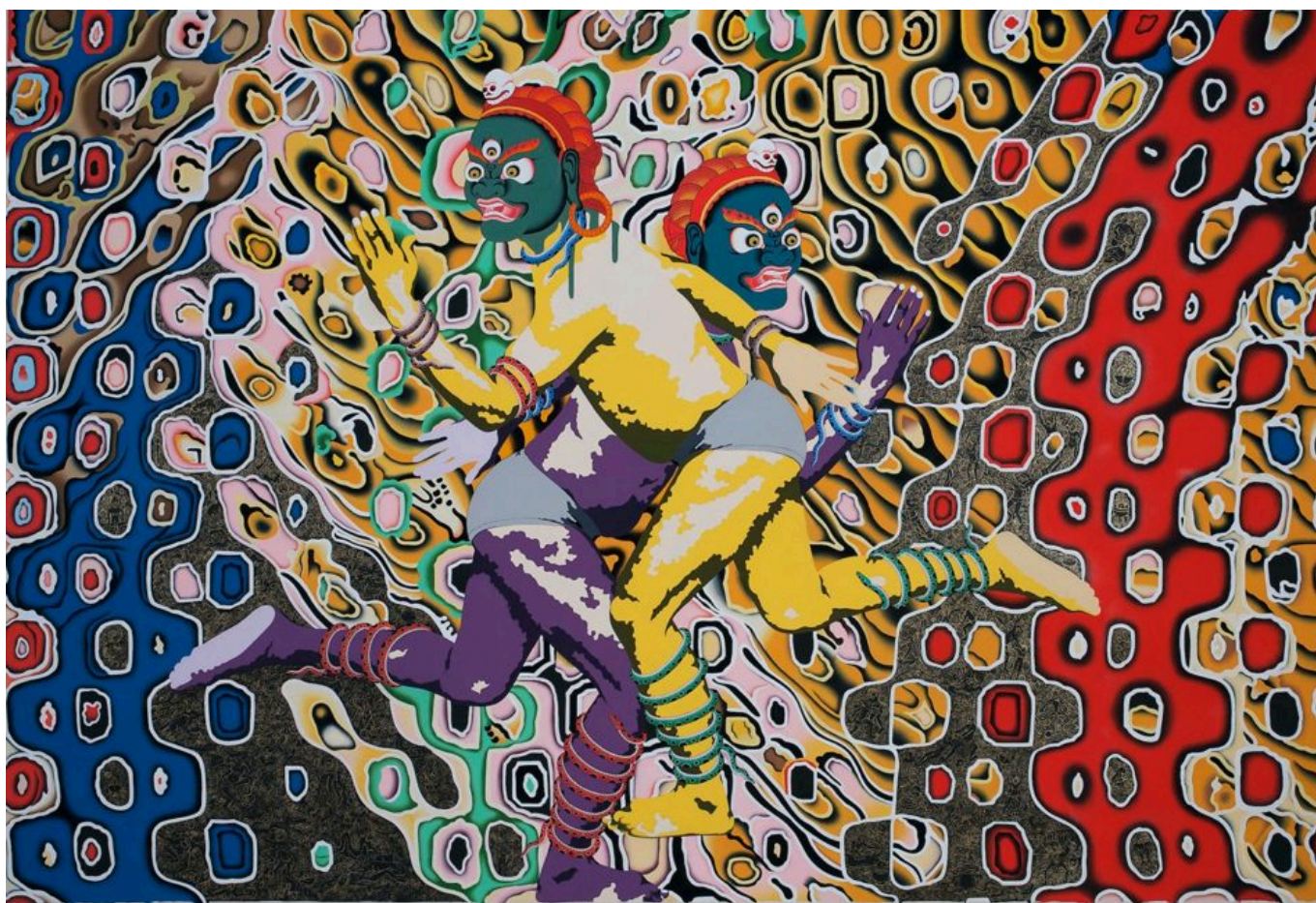
《失落的灵魂》雪林·夏帕（尼泊尔）作于2014