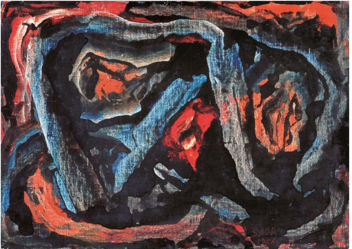
《无题》贝贾特·萨德尔（伊朗）作于1956年

多重危机的一个方面是性别不平等和暴力侵害妇女问题日益加深。联合国妇女署最新发布的 报告 《可持续发展目标进展：2023年性别问题概况》列出了一些令人极为担忧的数字。从目前的趋势来看，该报告预计，到2030年，全球将有3.424亿妇女和女童（估计占全球女性人口的8%）生活在极端贫困之中，近四分之一的妇女和女童将面临中度或重度的粮食不安全状况。报告估计，按照目前的速度，将有1.1亿女童和年轻女性失学。令人震惊的是，尽管多年来人们一直在为同工同酬而奋斗（这一点在苏联1920年6月颁布的工资率法令中得到确立）但男女薪酬差距仍然“居高不下”。 报告指出 ，“在全球范围内，男性每挣1美元的劳动收入，女性只挣51美分。在适龄劳动人口中，女性劳动参与率仅为61.4%，而男性则达90%。”联合国妇女署2023年报告重点关注65岁及以上的妇女。报告显示，在提交数据的116个国家中，有28个国家的老年妇女只有不到一半人有养老金，让人大失所望。而且所有的趋势线都在走低。