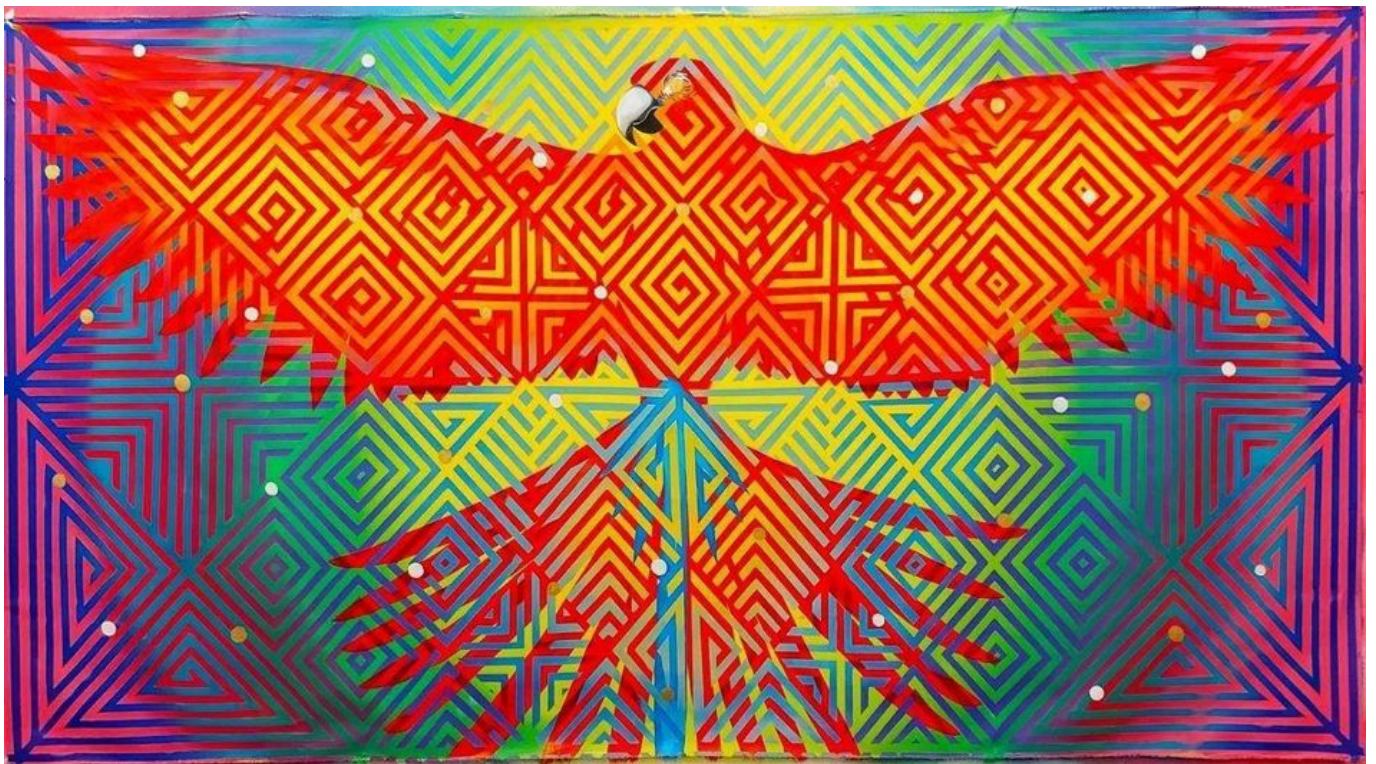
《红金刚鹦鹉Mahá》戴亚拉·图卡诺（巴西）作于2021年

当然，从马克思主义的角度来看，“多重危机”一词也有其模糊之处，因为它表明，这些危机并非步调一致，归根结底在于资本主义制度未能将它们作为一个整体逐个解决。例如，自1992年里约地球峰会以来，已经有几项非常明确的建议来应对 破坏 亚马逊雨林等环境危机，但由于资本主义私有财产掌控大量地球资源，并且左右对全球和与亚马逊有利害关系的各国 公共政策架构 ，这些建议都没能实施。