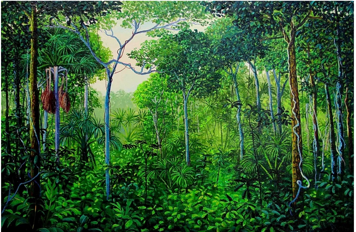
《绿色丛林》米格尔·潘哈（巴西）作于2017年

全球雨林遭受劫掠的规模和速度令人触目惊心。2021年，全球雨林覆盖面积 损失 了1110万公顷，略等于古巴面积。用时下世界杯的足球行话说，全世界每分钟损失的雨林相当于十个足球场。博索纳罗执政下的巴西去年经历了最严重破坏，损失了150万公顷雨林。往日植被浓密、动物繁多的雨林现已一去不返。卢拉在COP27上说：“我们将对非法森林砍伐进行严厉打击。”