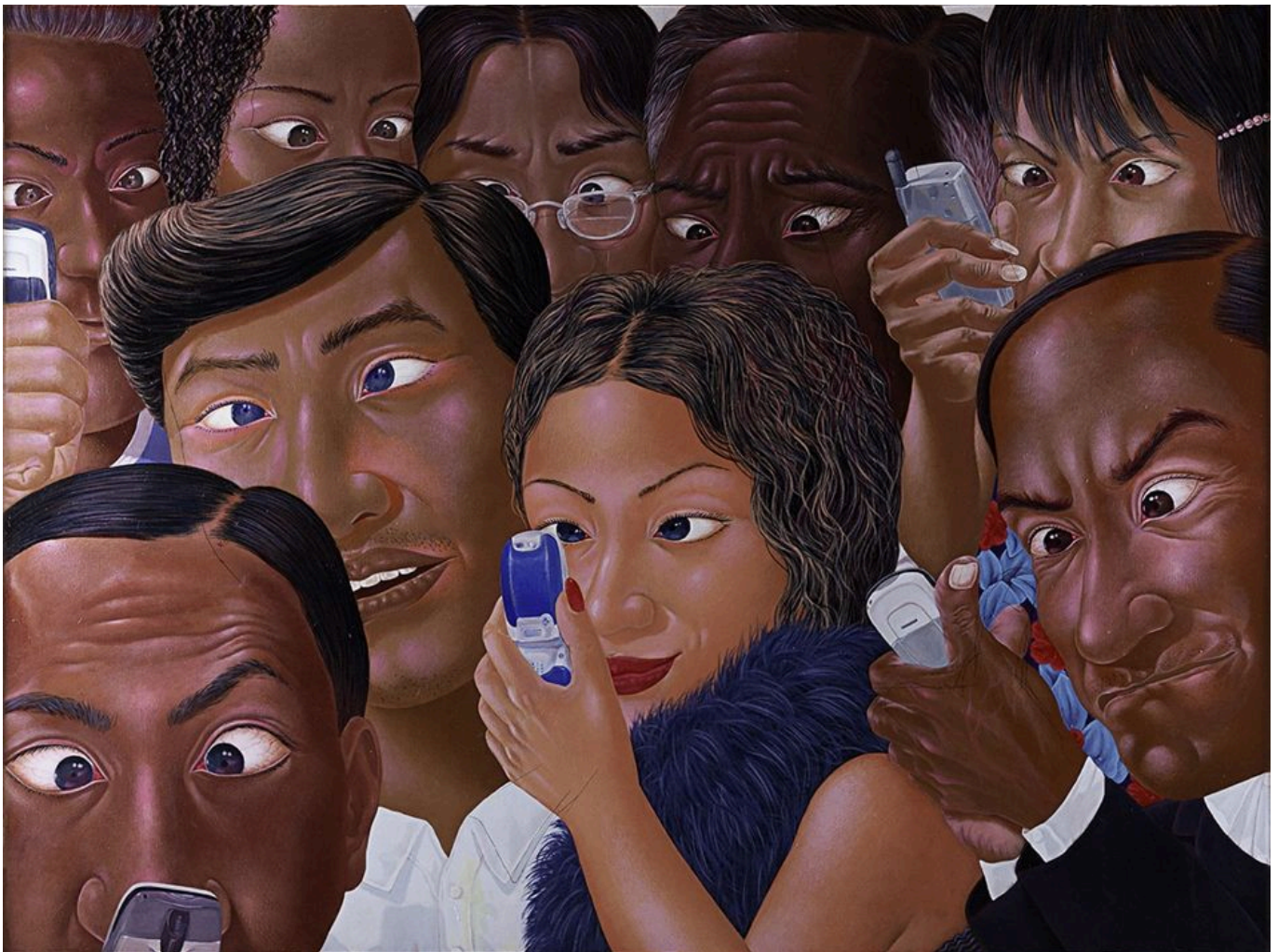
《斗鸡眼》 尼奥曼·马斯里亚迪（印尼）作于2005年

巴西、民主刚果、印尼的做法是在缓解、适应、投资的框架内酝酿的，而不是通过COP的空泛讨论。印尼环境与森林管理部副部长纳尼·亨德里亚蒂解释说，印尼将通过“蓝碳”计划（blue carbon）推广红树林生态游，制止旅游业对红树林的破坏，努力遏制国内长期泛滥的森林砍伐现象（比如，1980到2005年间，印尼广阔的红树林系统足足毁坏了40%）。例如，印尼采取新措施推广红树林间的螃蟹养殖，以阻止红树林破坏。本着这种精神，在COP27之后召开的二十国集团巴厘岛峰会期间，印尼总统佐科·维多多邀请各国领导人在努拉莱伊森林公园种下红树林种子。