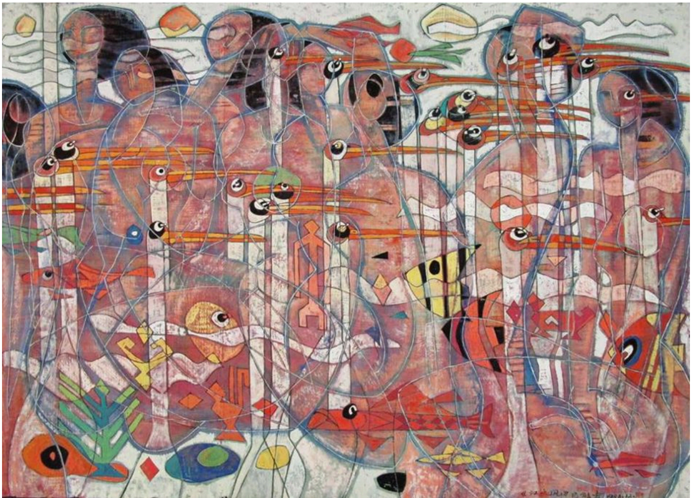
《湖滨》何能（中国）作于1986年

里约宣言所倡导的“共同但有区别的责任”影响了1997年的《京都议定书》和2015年的《巴黎协定》。承诺成了一纸空谈。发达国家承诺进行“气候融资”，以减轻气候灾难造成的严重后果、用其他能源代替碳基能源。然而 绿色气候基金会 的资金远低于2009年所承诺的每年1000亿美金。G20罗马峰会也未能就这一空头支票达成共识。而以发达国家为主的政府在2020年3月到2021年3月疫情期间为刺激经济共 支出 了高达16万亿美元的财政拨款，这一鲜明对比不容忽视。鉴于严肃讨论气候融资已不现实，COP26极有可能以失败告终。