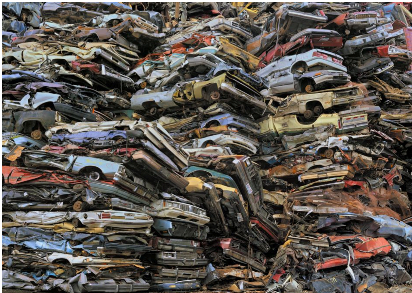
《塔库玛的报废汽车#2》 克里斯·乔丹（美国）摄于2004年