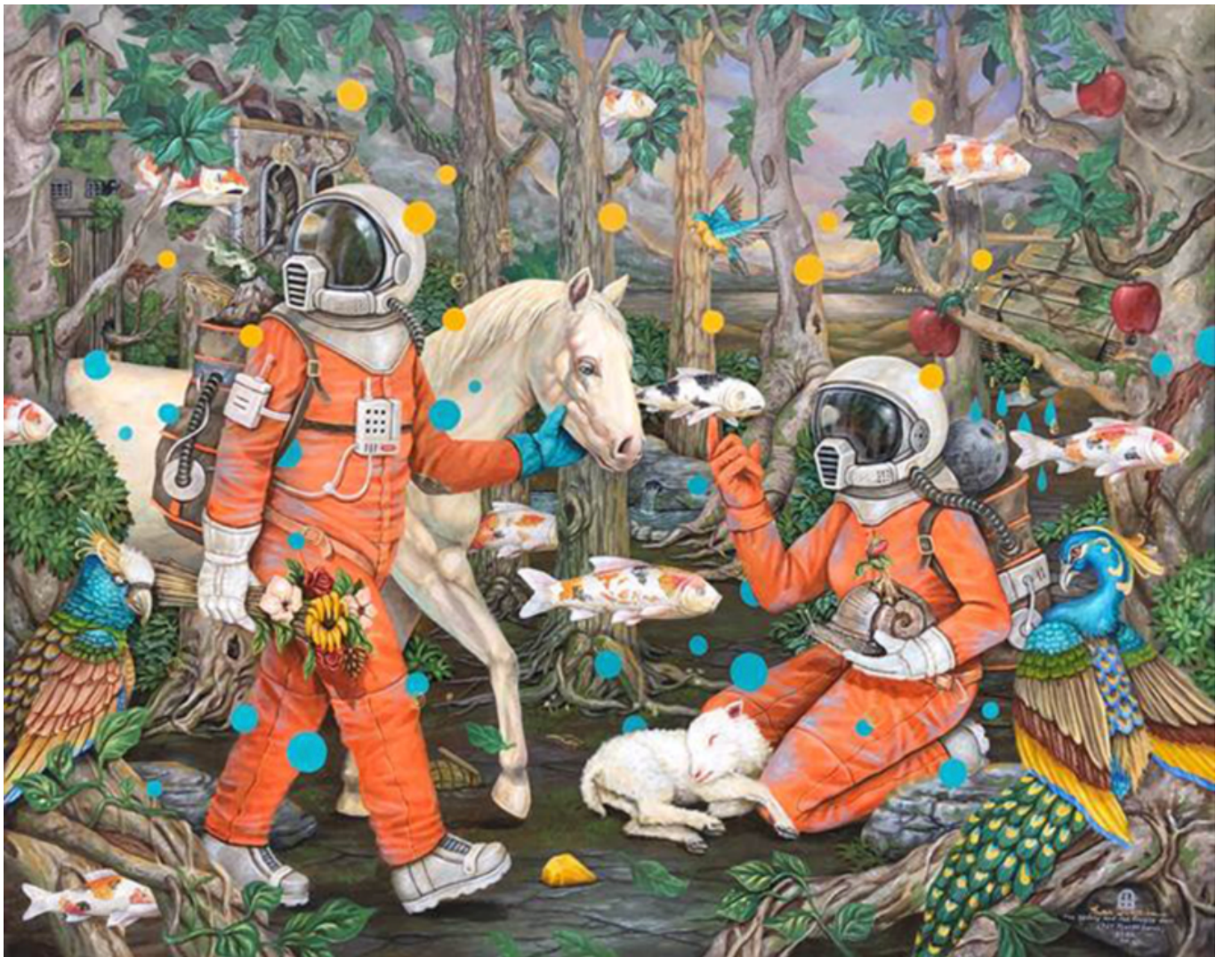
《美丽而脆弱的地球生物》伊万·苏斯蒂卡（印度尼西亚）作于2020年

2015年巴黎第21届联合国气候变化大会上，各大国对“净零排放”只字不提。多亏IPCC报告和针对气候危机的群众行动，以“爱车人”自居的领导人现在不得不开始谈论这个话题。虽然2050年必须实现净零排放已经提出多年，但G20的声明仍然将其忽略，只模糊地表述为“到本世纪中叶前后”必须实现。甲烷是仅次于二氧化碳的人为温室气体，它的全球排放问题也少有提及。