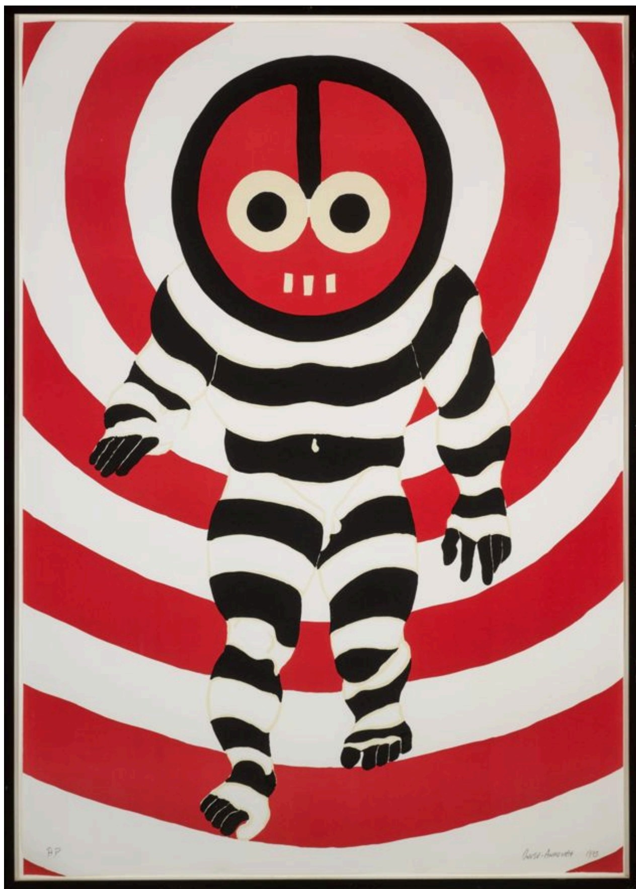
《巴彭德》奥乌苏-安科马（加纳）作于1993年