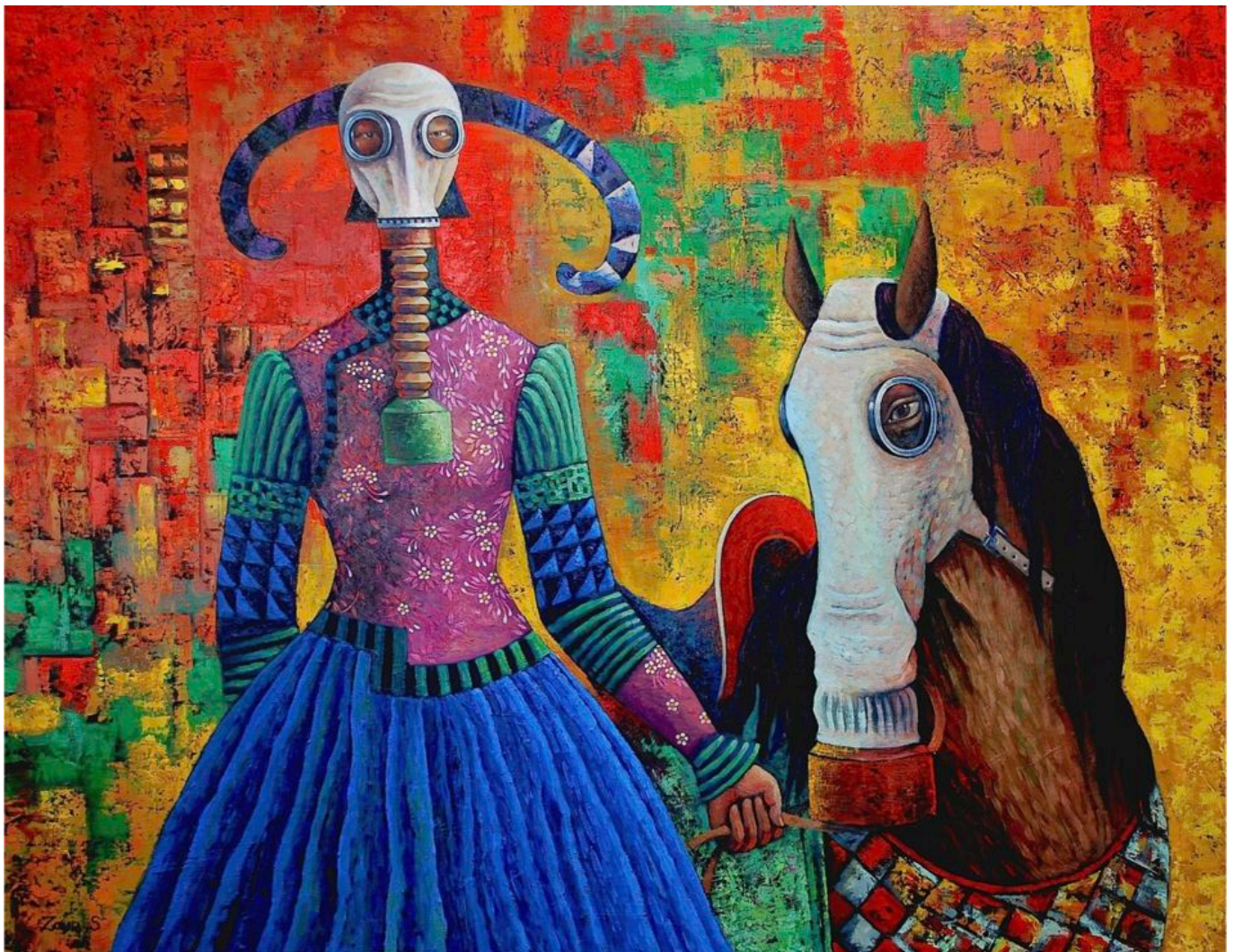
《幸存者》扎亚赛克汗·桑布（蒙古）作于2013年

3. 全球南方广大城乡工人阶级和部分下层小资产阶级（统称为大众阶级）与美国领导的帝国主义权力精英之间的矛盾。这一矛盾正逐渐尖锐。西方在全球南方所有阶级中拥有巨大的软实力优势。然而，几十年来第一次，非洲青年站出来支持西非地区马里、布基纳法索等国驱逐法国部队。哥伦比亚的大众阶级第一次选出了一个拒绝让国家沦为美国军事、情报势力附属哨所的新政府。工人阶级妇女站在许多重要的工人阶级斗争和社会斗争的前线。年轻人奋起反抗资本主义的环境犯罪行为。工人阶级越来越多的人正将他们争取和平、发展、公正的斗争认同为公开的反帝斗争。他们能够看清美国“人权”思想的谎言、西方能源和采矿公司对环境的破坏、美国发起的混合战争与制裁之残暴性。