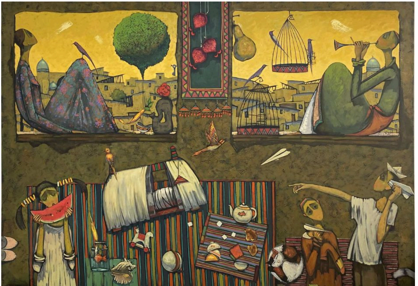
《壁炉》 马克苏德·米尔穆哈梅多夫（塔吉克斯坦）作于2020年

世界经济中心正在转移，俄罗斯和包括中国在内的全球南方按购买力平价计算的GDP已占到全球总量的65%。美国按购买力平价计算的GDP在全球总量中的占比已从1950年的27%下降到现在的15%。美国的GDP增长率50多年来持续下降，现在年增长率已跌至仅2%左右。美国没有新的大型市场可以拓展。西方经历着持续的资本主义总危机以及利润率长期下降趋势的苦果。