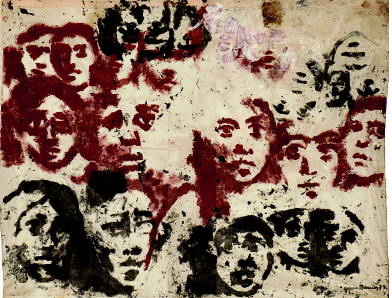
《失踪者》格拉西亚·巴里奥斯（智利）作于1973年

民众绝望的可怕循环由此开始，持续至今。正如南非种族隔离时期的债务一样，这些没有取消的“恶债”揭露了国际金融的丑陋现实。