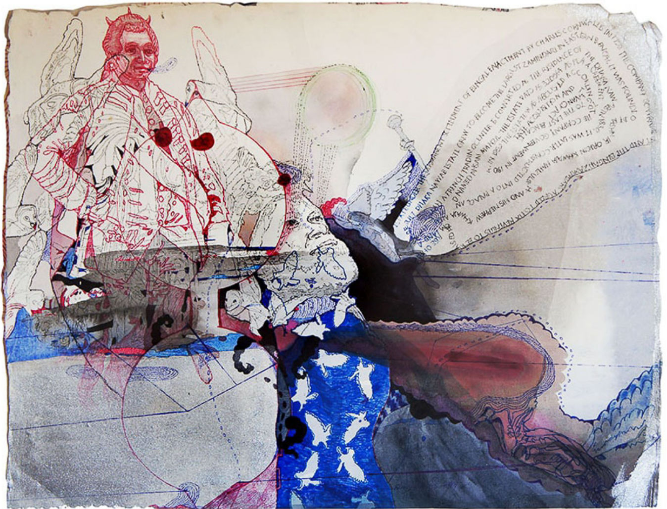
《殖民时代及后殖民时代》 菲罗兹·马哈茂德（孟加拉国）作于2017年

为了讨好美国，莫雷诺将维基解密创始人朱利安·阿桑奇 驱逐 出了厄瓜多尔驻伦敦使馆，以莫须有罪名 逮捕 了计算机程序员、隐私保护主义者奥拉·比尼，并对“科雷亚派”进行正面打击。科雷亚派的政治组织遭到瓦解，领导人被捕，重组参选的努力均遭 否决 。其中一例便是“社会妥协力量”（Social Compromise Force）这一平台，它是科雷亚派用于 参加 2019年地方选举的，在2020年遭到 禁止 。2018年2月 一次遭到操控 的全国公投使政府破坏了全国选举委员会、宪法法院、最高法院、司法委员会、总检察长、总审计长等民主机构。民主制度遭到架空。