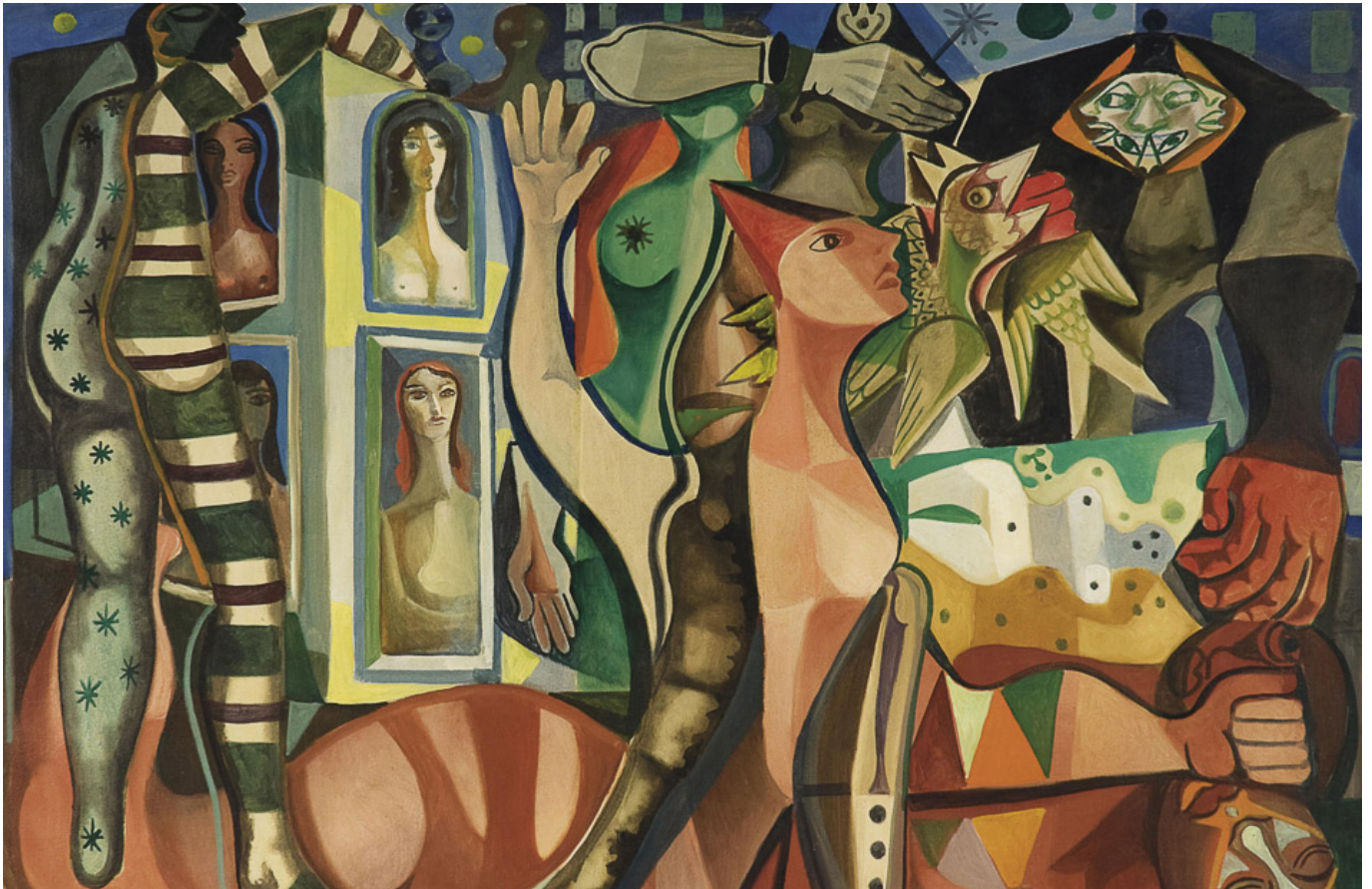
《狂欢节之梦》 卡瓦尔坎蒂的阿米利安（巴西）作于1955年

总统费尔南多·卢戈以及2016年巴西总统迪尔玛·罗塞夫均因法律战而下台，这些领导人都是都是“司法政变”的受害者。2018年，巴西前总统路易斯·伊纳西奥·卢拉·达席尔瓦在所有民调均预测他将获胜的情况下，被一桩毫无根据的诉讼案剥夺了竞选总统的权利。阿根廷前总统克里斯蒂娜·费尔南德斯·德基什内尔从2016年开始面临一系列的诉讼案，因此无法在2019年再次参选（她现在是副总统，证明她在国内的受欢迎程度）。