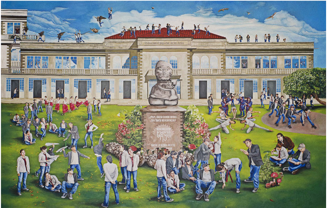
《艺术大学的壁画》 奥斯瓦尔多·泰雷罗斯（厄瓜多尔）作于2012年