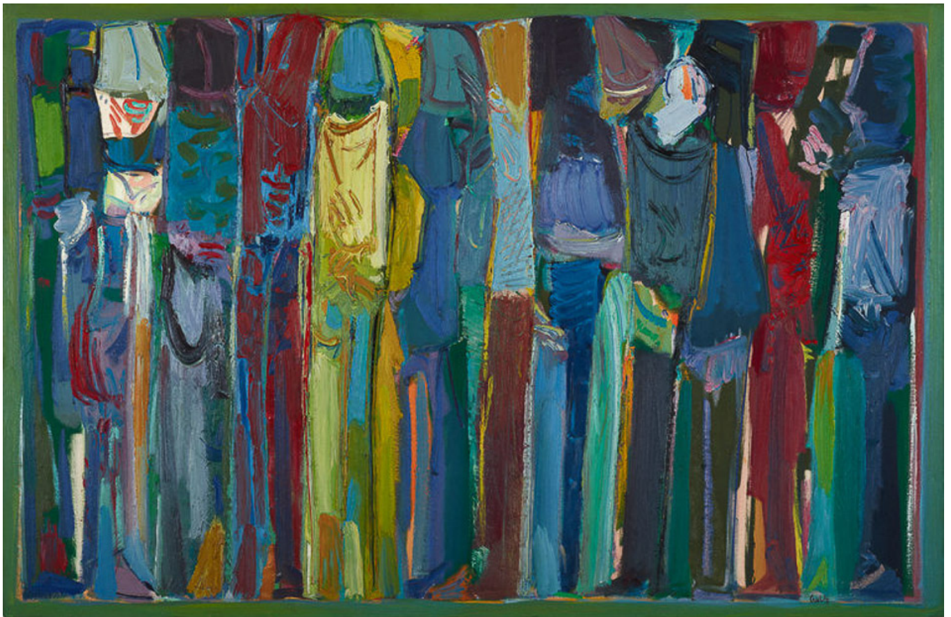
《艰难求生》保罗·吉拉戈辛（黎巴嫩）作于1988年

金钱泛滥于整个体系，蚕食政治家的忠诚，腐蚀民间社会机构，把控媒体的叙事方式。重要的是，当今世界的统治阶级掌握了主要传播渠道，这些渠道塑造了世人解读周遭世界的方式。虽然联合国的《世界人权宣言》申明“人人有发表意见和表达的权利”（第19条），但事实确凿，媒体集中在了少数企业手中，限制了“可通过任何媒体传递信息和思想”的自由。因此，无国界记者组织正在就媒体所有权进行监测，追踪企业掌控的媒体合并壮大的情况，这种情况又反过来推动了现行政府体制内的政治议程。