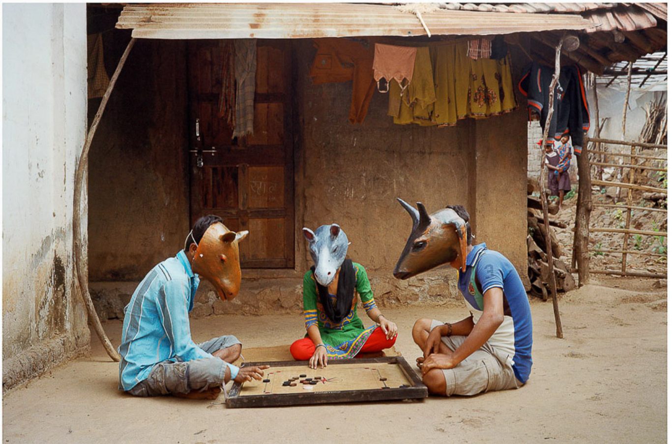
Gauri Gill, 《无题(32)》选自《面子工程》系列, 2015