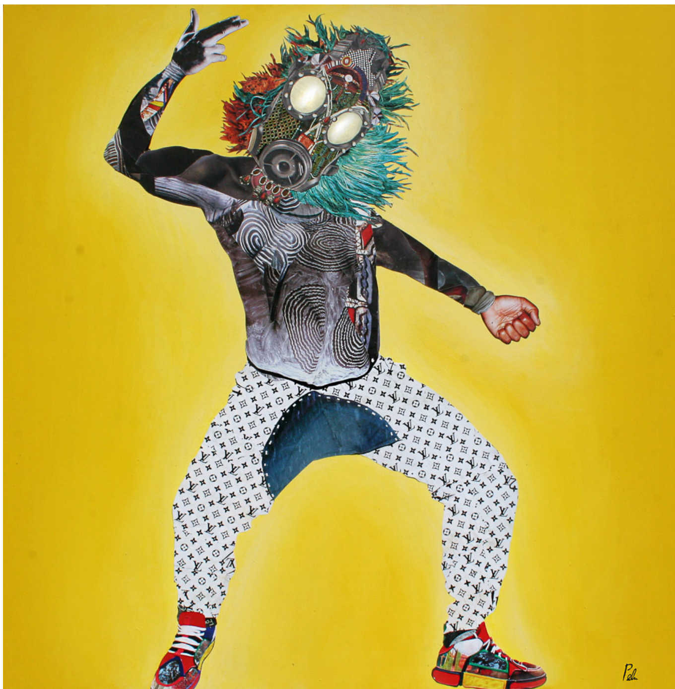
Penda Diakité (马里), Bouana (2019)

随着工会、政党和宗教团体走上街头，反对2020年3月易卜拉欣·布巴卡尔·凯塔再度当选的抗议活动升级。媒体的注意力聚焦在别具魅力的萨拉菲派传教士马哈茂德·迪克(Mahmoud Dicko, 他有一个耸人听闻的外号——“马里的霍梅尼”)身上；但是迪克仅仅代表了街头势力的一部分。6月5日，这些组织，如马里库拉希望运动(Mouvement espoir Mali Koura)和民主保卫阵线(Front pour de sauvegarde de la démocratie)，以及迪克的协会，呼吁在巴马科独立广场举行大规模抗议。他们组织了“六五运动——爱国力量集会”(M5-RFP)，继续向IBK施压，要求其下台。国家暴力(包括23人死亡)