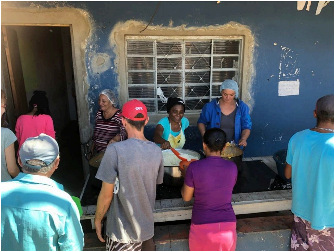
马里耶勒永生营的社区食堂 摄于2019年

马里耶勒永生营并非普通的“贫民窟”，贫民窟一词有着太多的负面含义。许多贫民窟的状况是荒凉的，犯罪团伙、宗教组织为它们提供着脆弱的社会纽带。但马里耶勒永生营却散发着截然不同的气息。无地农民运动组织的旗帜随处可见，居民和蔼可亲、不卑不亢，不少人穿着该组织的T恤衫，或戴着它的帽子。他们时刻准备着：准备保卫营地，反抗当地政府的驱逐，准备建设一个真正属于自己的社区。