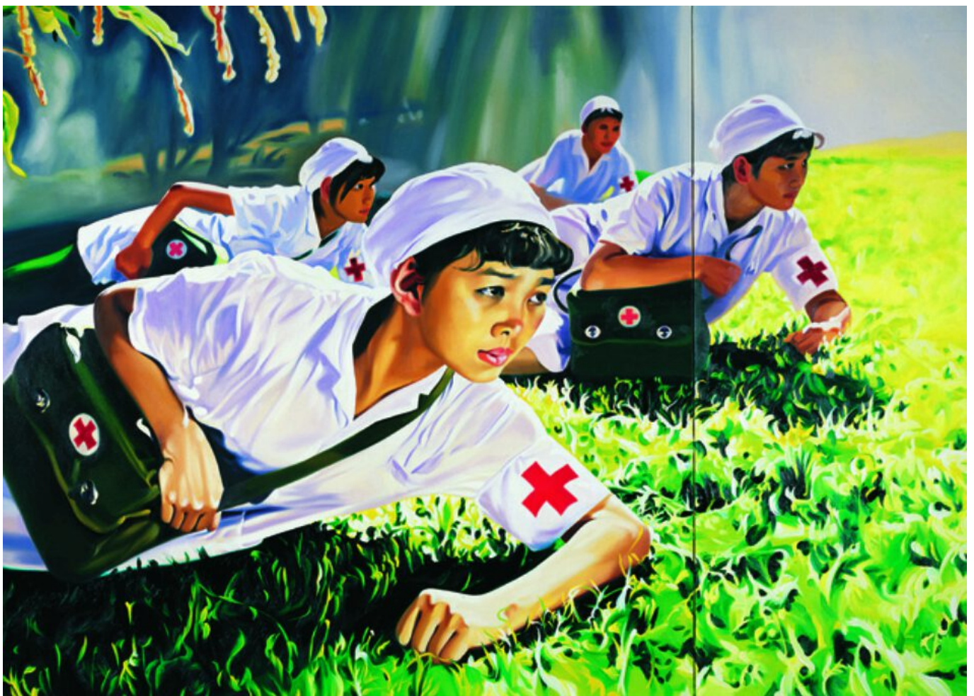
景柯文（中国），《梦想2008一（护士）》，2008

对中国以及世卫组织的攻击似乎是蓄意转移公众视线，掩盖美国和巴西等政府抗疫不力的真相。在巴西，总统雅伊尔·博尔索纳罗（Jair Bolsonaro）已经暂停了关于病毒引起的感染以及死亡率的基础数据的发布。他同时也威胁要中止宪法并发动“自动政变”(auto-coup)来掌握绝对权力。