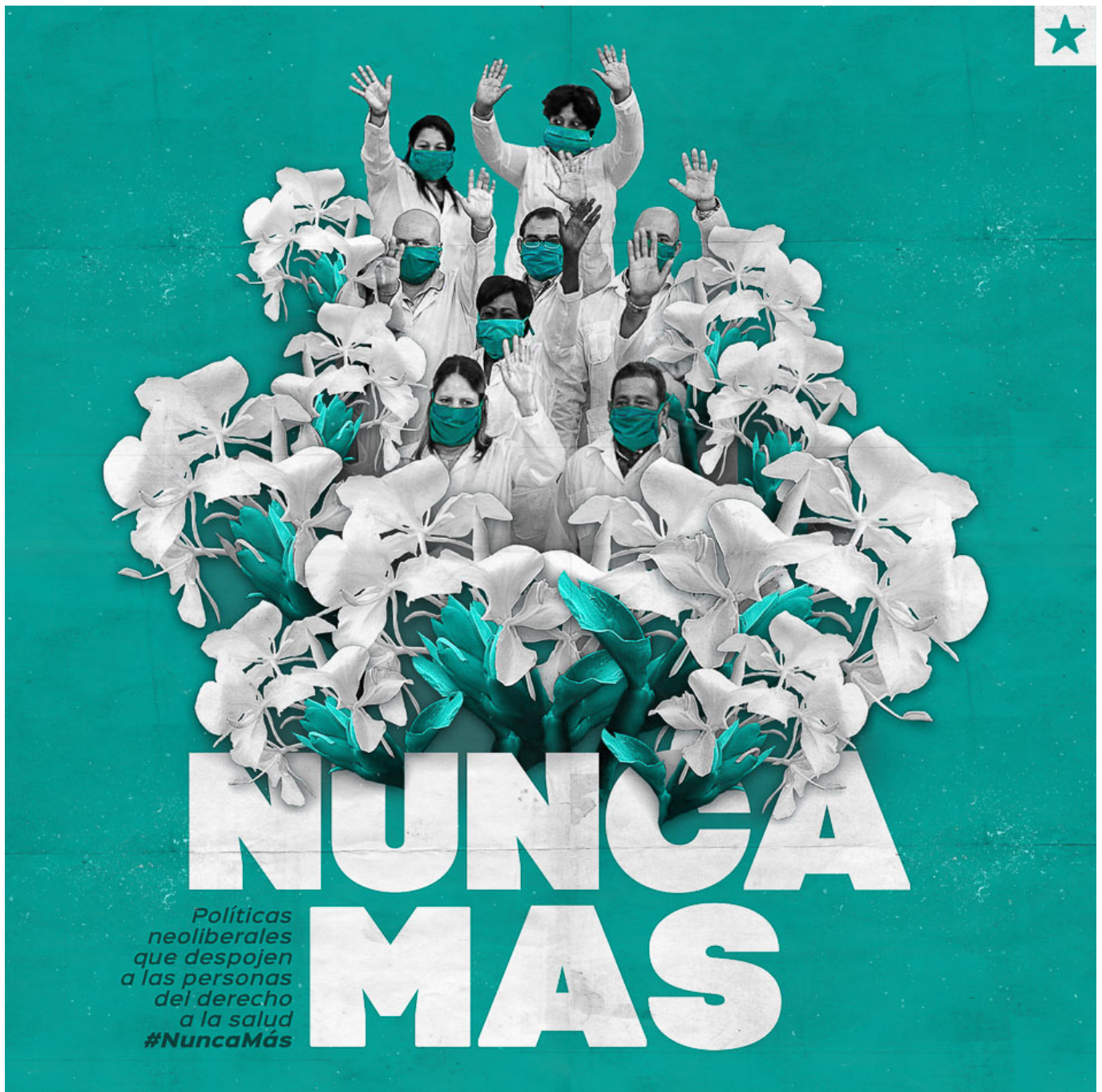
Kalia Venereo (古巴多米尼奥), 《再也不会》，2020