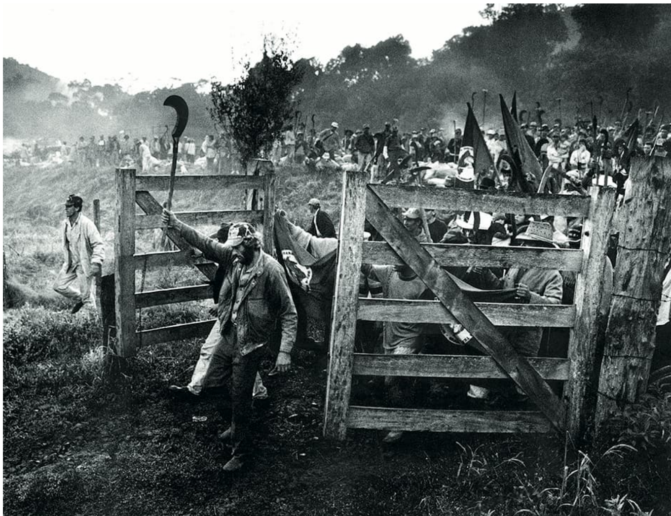
Sebastião Salgado, 《为土地而抗争：人类的前进》，1997

育，包括农村地区的人口。这项大众的农业改革惠及的不仅仅是农民，而是所有人口（他们中的很多人现在都已经居住在城市了）。