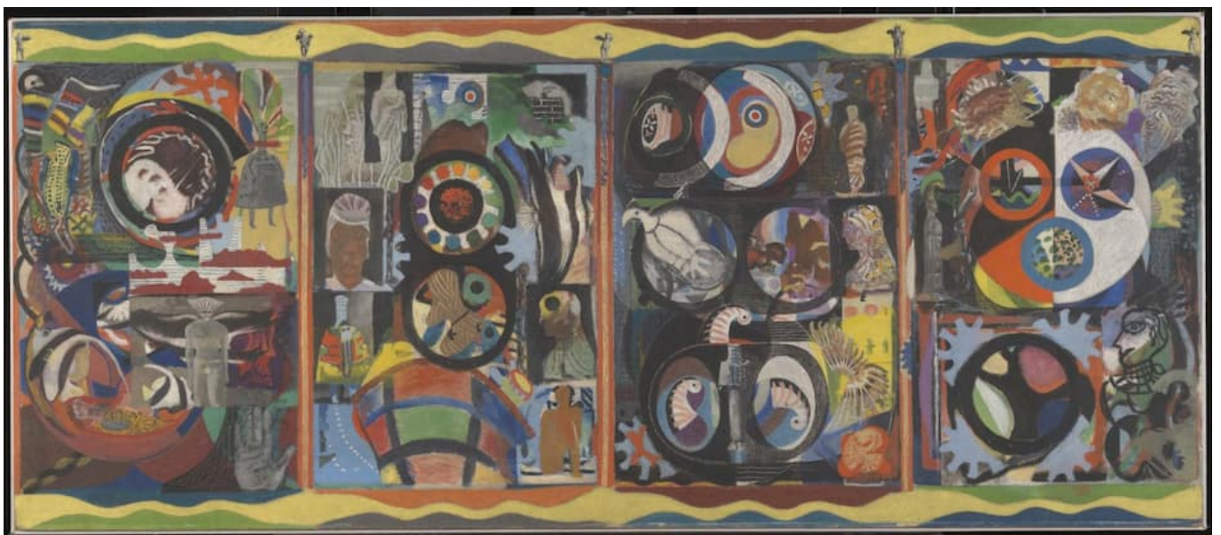
Eileen Agar, 一个胚胎的自传, 1933-34

“共担责任，全球团结”，这是一份重要的联合国 报道 的标题，这一行字读来令人心生希望。标题下的正文中写道全球疫情“正在攻击着各个社会的核心部位”。世界上很多地区的社会以及国家机构都已被掏空，它们在处理当下的卫生、社会或是经济危机时显得有心无力。国际货币基金组织总裁Kristalina Georgieva 曾说过 ，在2021年之前，经济是不可能复苏的。现在是2020年4月，好像整个2020年都被抹去了。