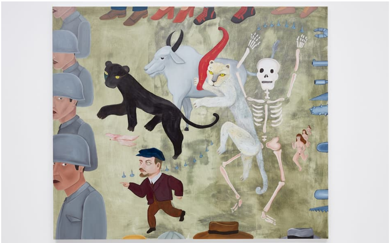
Cecilia Vicuña, El Paro/罢工 , 2018.

要求当权者在实施应急措施时，优先考虑我们的健康安危而不是他们的私人利益。因为生命是无价的，所以要争取带薪病假、免费的儿童护理；软禁监狱中的犯人；稳定基本生活用品以及卫生用品的物价；所有的生产必须围绕着社会需求运转并按计划稳步进行（而不是受利益驱动）；给予 所有 的护理员相应的劳动报酬（包括正式的以及非正式的）；为所有人提供免费的高品质理疗护理；延长债务以及红利的期限；保障民众能够自由获取水资源以及电力；以及禁止解雇工人。