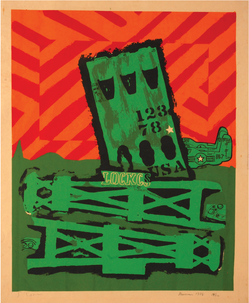
सिल्वानो लोरा (डोमिनिकन गणराज्य), सेरियाफ़ (प्रिंट), 1976, संस्करण 18/60, आकार: 640 x 570 मि.मी.