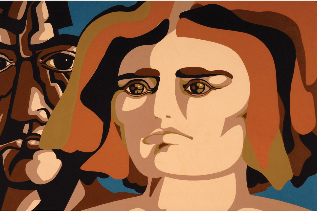
होसे वेंचुरेली (चिली), सेरिग्राफ (प्रिंट), 1970, संस्करण 15/90, आकार: 260 x 430 मि.मी.