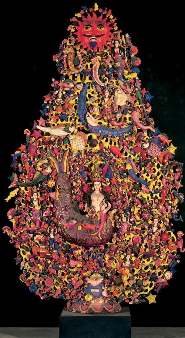
Alfonso Soteno Fernández. (Metepéc, Estado de México, México). Árbol de la vida , 1975. Barro cocido a fuego abierto y pintado con colores vinílicos barnizados. 6 metros.