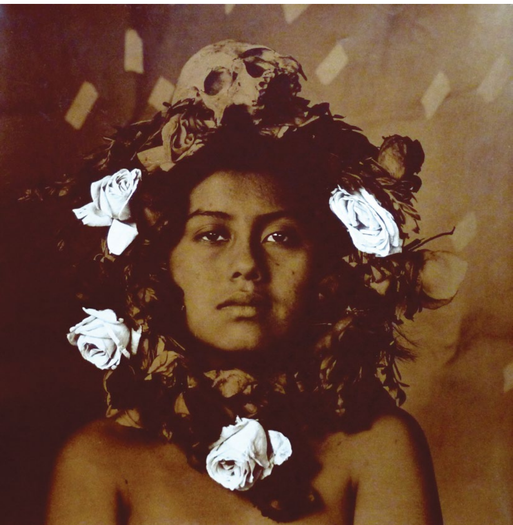
Luis González Palma (Guatemala), La Rosa (A rosa), 1991. Impressão em gelatina de prata com tonalização e aplicação de cor, 47 x 48.5 cm.