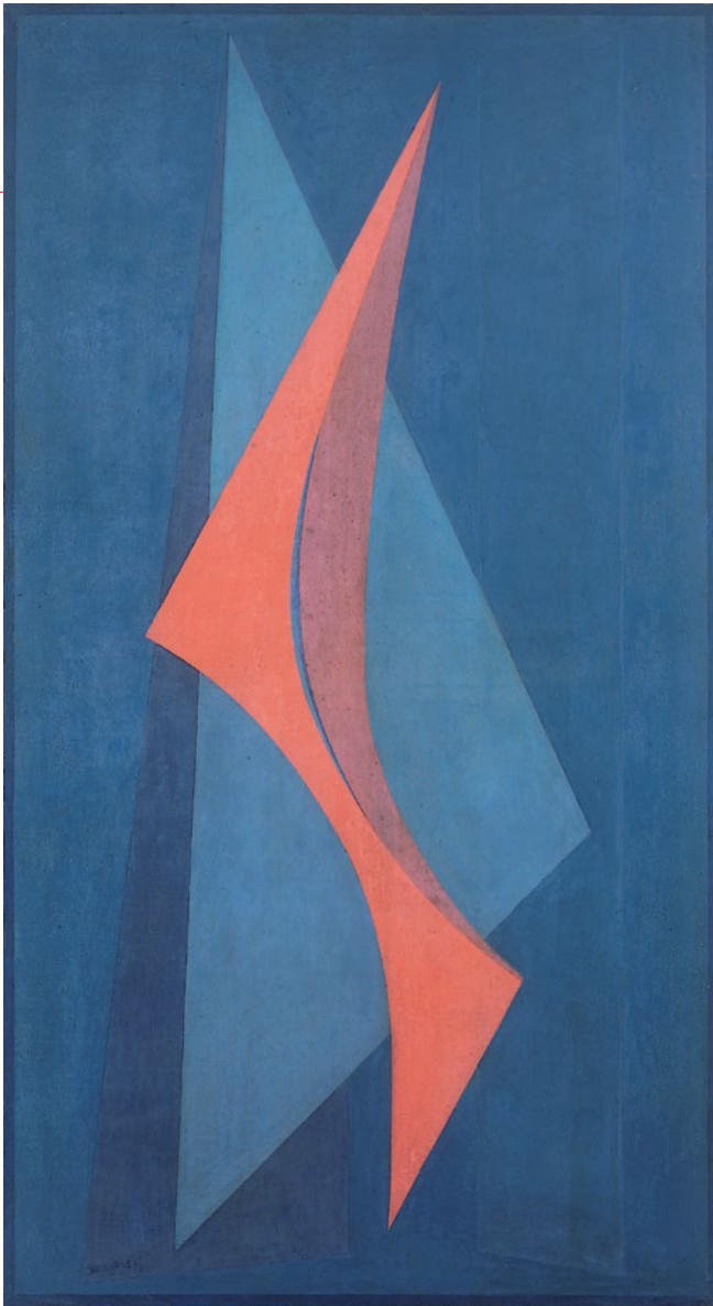
Emilio Pettoruti (Argentina), Pájaro rojo (Pássaro vermelho), 1959. Óleo sobre tela, 116 x 63 cm.