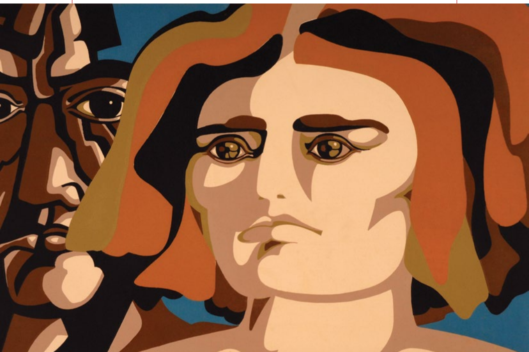
José Venturelli (Chile), Serigrafía (Serigrafia), 1970, ed. 15/90. 260 x 430 mm.