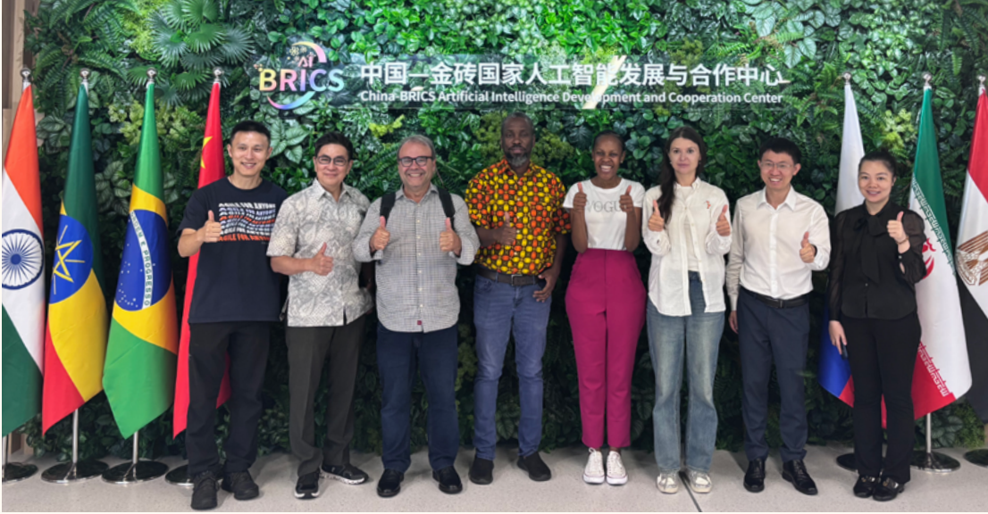
“全球南方AI与数字主权研讨会”专家访问中国-金砖国家人工智能发展与合作中心

论坛还打造《南方对话》系列学术工作坊，并结合工作坊成果制作同名访谈节目，通过电视和新媒体渠道全球发布。《南方对话》已与东方卫视《环球交叉点》栏目合作推出关于全球南方视角下的历史与未来、数字主权、极化帝国主义等节目。