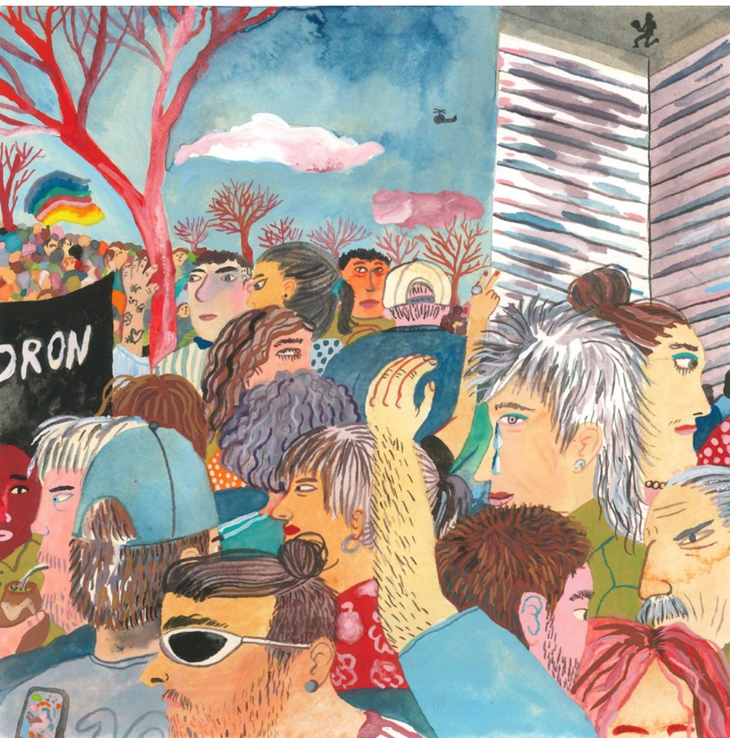
Powerpaola (Ecuador), Crying [Chorando] , 2022.