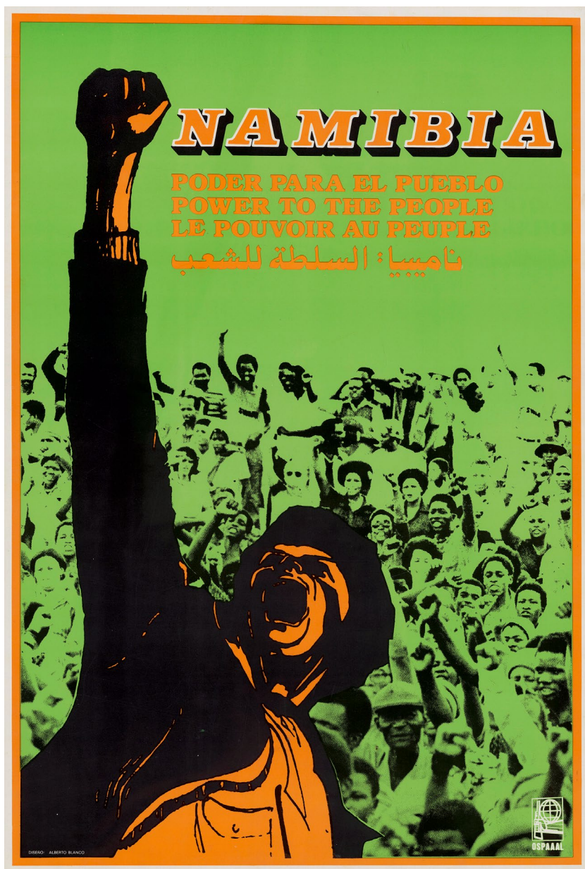
Alberto Blanco González (Ospaaal), Namibia: Poder para o Povo , 1981.