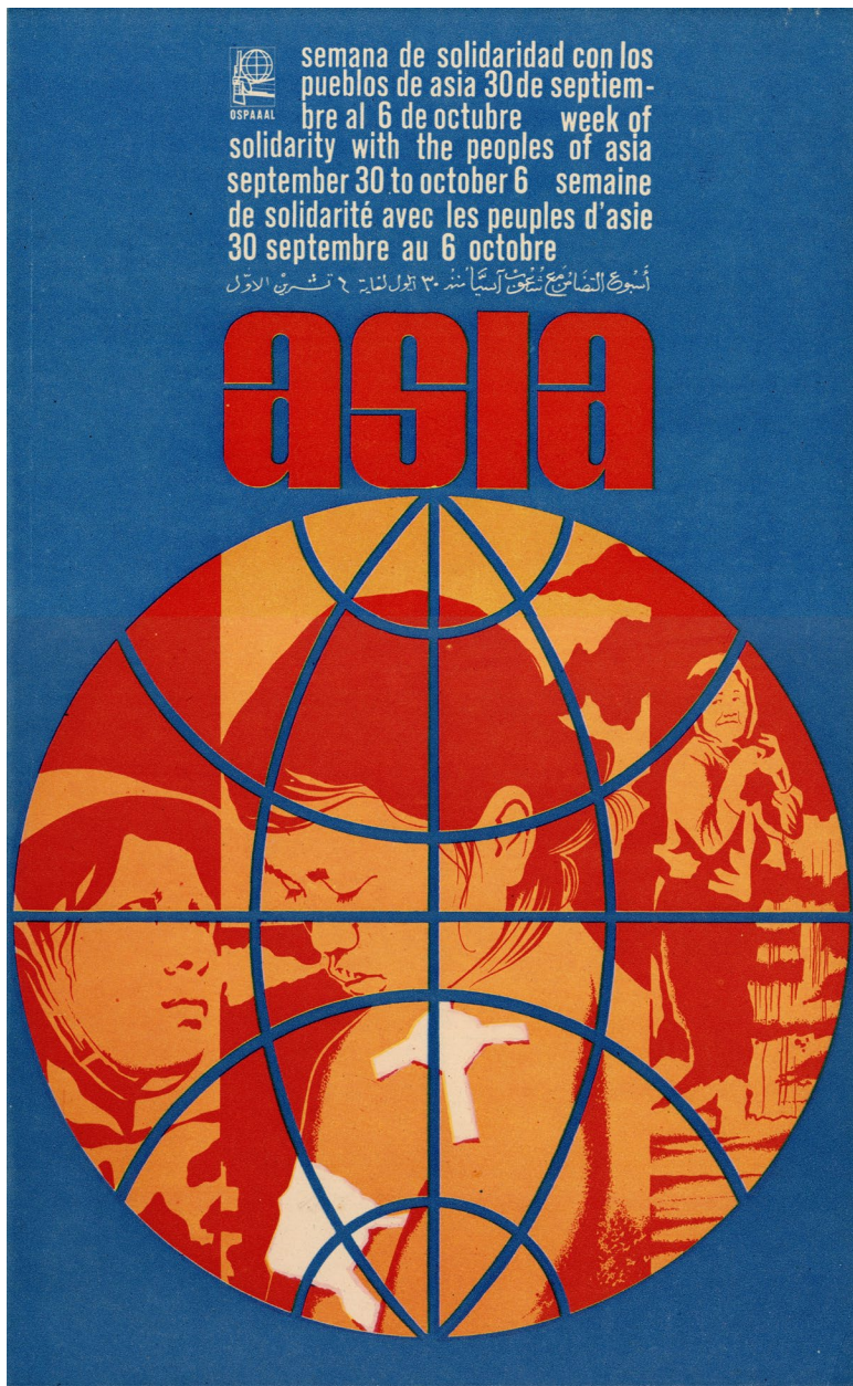
Artista desconhecido (Ospaaal), Semana de Solidariedade com os Povos da Ásia , 1968.