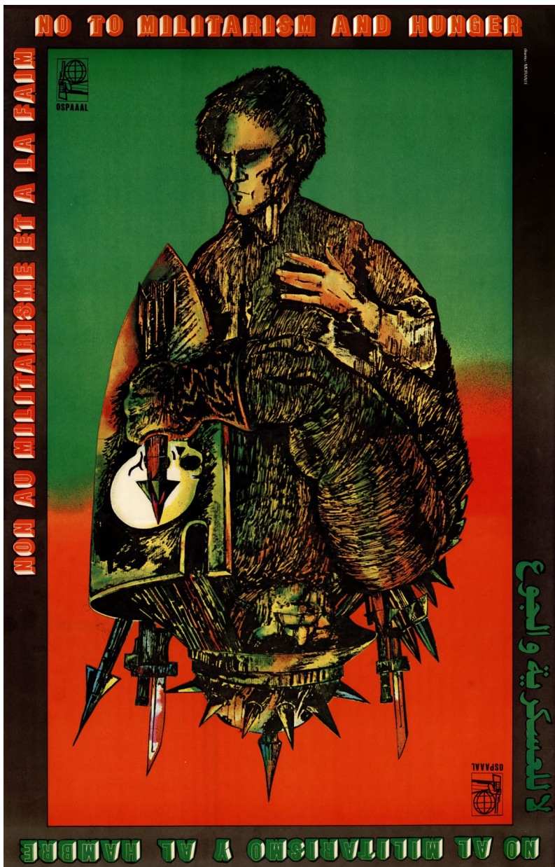
Rafael Morante Boyerizo (OSPAAAL), No al militarismo y al hambre , 1981.