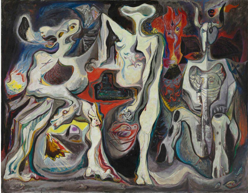
آندره ماسون (فرانسه)، دنیای ناتمامی در کار نیست، ۱۹۴۲

صد سال بعد، این سخنان هریس «بمب افکن» به درستی جنس قساوتی را که هم بر فلسطین و هم بر لبنان تحمیل شده است، توصیف می کند.