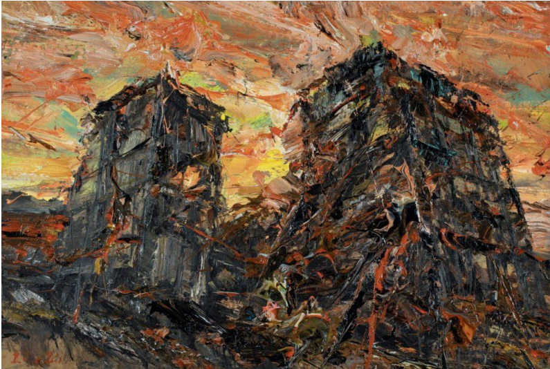
ایمن بعلبکی (لبنان)، بدون عنوان، ۲۰۲۰

اینک می‌دانند که بمباران واقعی یعنی چه: خبرنامهٔ چهل‌ویکم (۲۰۲۴) ۱۰ اکتبر ۲۰۲۴