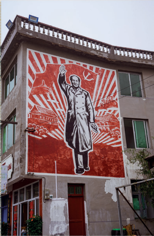
മാവോ റ്റസേ-തോണിന്റെ ഒരു ചുവർചിത്രം, ഗെയ്ജോ പ്രവിശ്യയിലെ വാൻഷാൻ ജില്ലയിലുള്ള ഒരു ഗ്രാമത്തിൽ. “ചുവപ്പൻ ടൂറിസം”ത്തിൽ താൽപര്യമുള്ള സഞ്ചാരികളെ ആകർഷിക്കുന്ന ഒരു കേന്ദ്രം കൂടിയാണ് ഈ ഗ്രാമം.