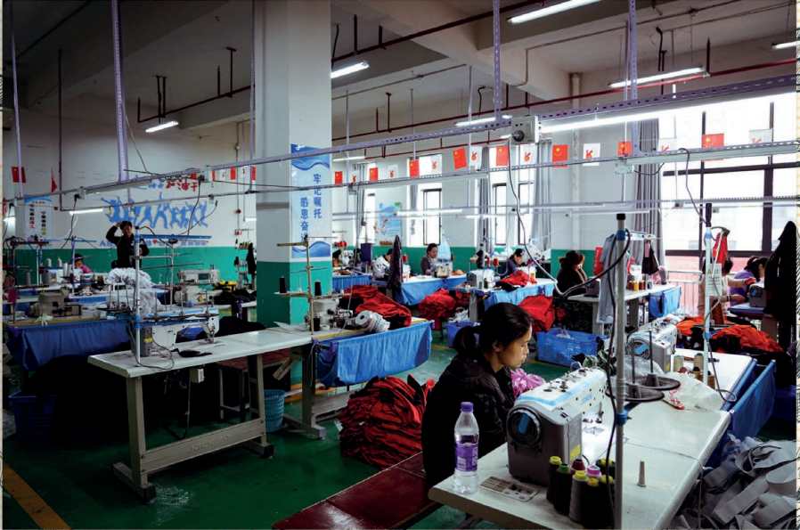
ഗ്രെയ്ജോ പ്രവിശ്യയിലെ തൊണ്ടൻ നഗരത്തിലുള്ള വങ്ജിയ പാർപ്പിടസമൂഹത്തിലേയ്ക്ക് താമസം മാറിയവരിൽ അവിടെ സ്ഥാപിക്കപ്പെട്ട ഒരു തുണിഫാക്ടറിയിൽ ജോലി ചെയ്യുന്നവർ. 2021 ഏപ്രിൽ.