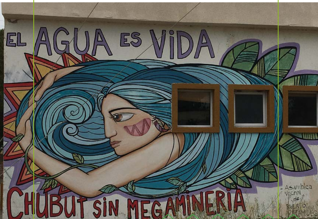
Mural de la Asamblea Vecinal de Puerto Pirámides