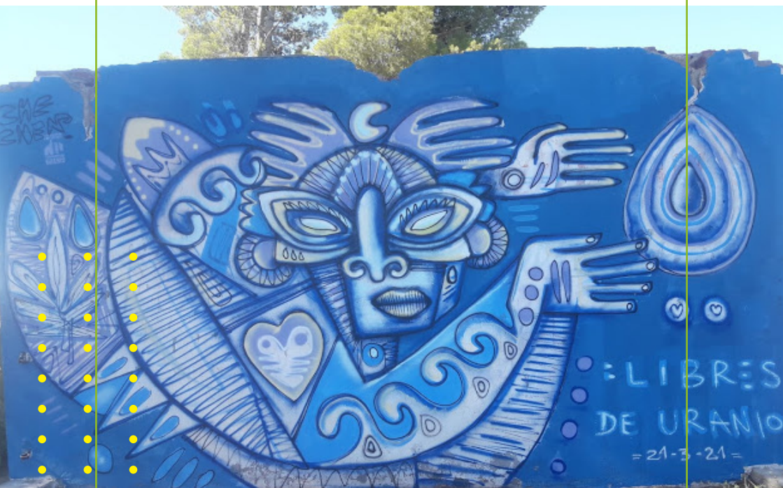
"Mago de la lluvia para defender el agua", mural realizado por Che Chen. Pared de una mina abandonada, Río Negro.