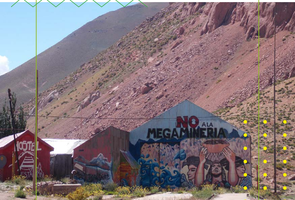
Mural en la ruta Mendoza-Chile.