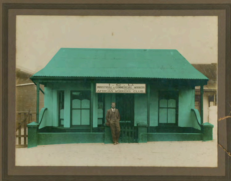
AWG Champion na entrada do Clube de Trabalhadores Africanos, na rua Leopold, 25, em Durban.