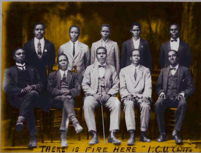
THERE IS FIRE HERE "I.C.U. Chiefs"