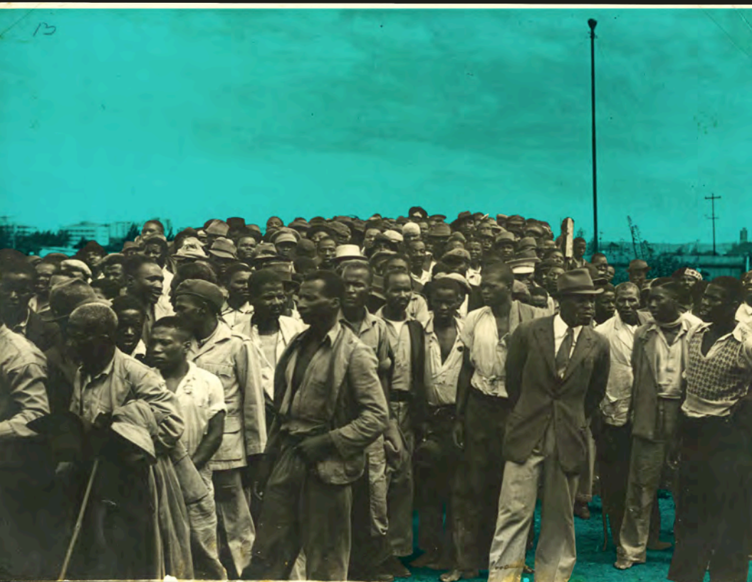
Reunião do STIC em Curries Fountain.