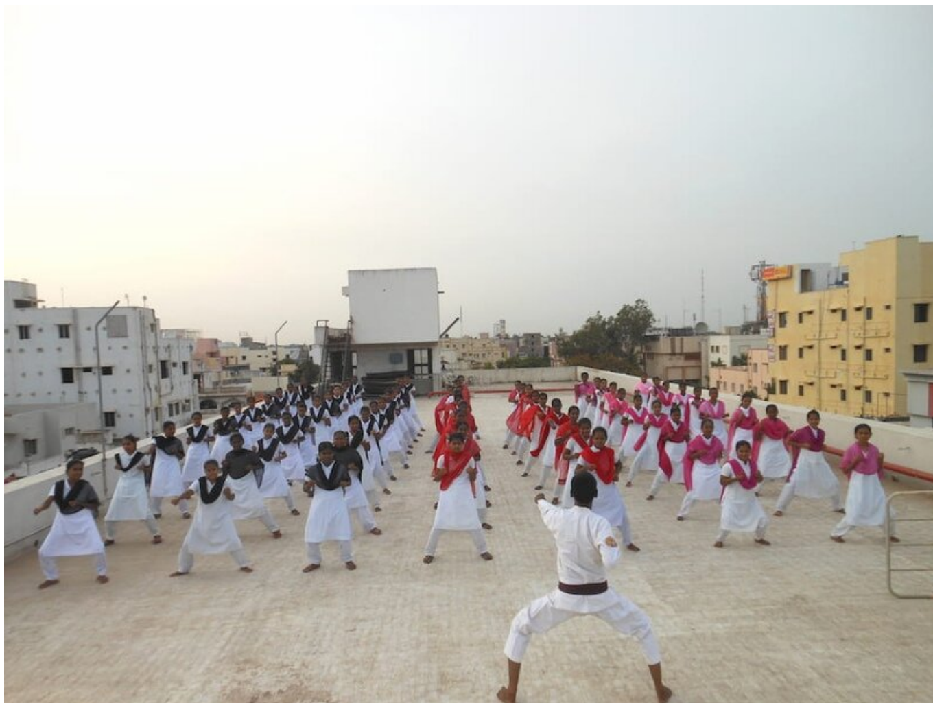
Студенты колледжа медсестер Народной поликлиники имени доктора П. В. Рамачандры Редди проходят обучение каратэ.

Эта вдохновляющая преданность объединяет их и с доктором Назихой аль-Дулайми, лидером Коммунистической Партии Ирака и Женской Лиги Ирака. Доктор аль-Дулайми училась в медицинском колледже в Багдаде в 1940-е. Она была вовлечена в антиимпериалистическое движение, в том числе Аль-Ватба («Прыжок») в январе 1948 года против возобновления англо-иракского договора. Она закончила колледж и после работы в королевском госпитале, начала работать в Кархской больнице. Доктор аль-Дулайми организовала бесплатную медицинскую клинику в Шавак, район Багдада. В наказание за её коммунистическую деятельность власти перемещали ее по разным районам страны — в Сулейманию, в Кербелу и Умру. Везде, где бы она не была, она организовывала бесплатные клиники для бедных. Доктор аль-Дулайми работала в южном Ираке, чтобы искоренить бактерию беджель, или фрамбезию, которая поражает детей с большой силой. После революции 1958, доктор аль-Дулайми стала министром по делам муниципалитетов; она сыграла важную роль в создании района Таура («Революция») в Багдаде и в принятии феминистского закона 1959 года О гражданских делах. Когда партия Баас пришла к власти, она отправилась в изгнание, но до последних дней