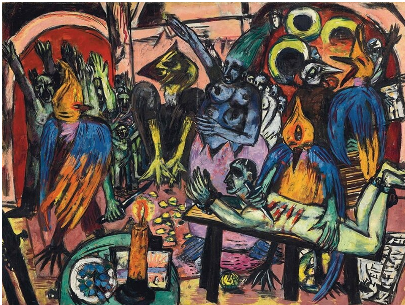
Hölle der Vögel / Ад птиц, 1937-38. Max Beckmann / Макс Бекманн.

Буржуазный строй, однако, имеет недостаток. Демократия нуждается в массовой поддержке. Почему массы должны поддерживать партии, чья повестка не удовлетворяет насущных потребностей рабочего класса и крестьянства? Это здесь, где культура и идеология играют важную роль. “Обман успеха” является другим способом размышления о гегемонии — рамки того как социальное сознание рабочего класса и крестьянства формируется, не только их собственным опытом, который позволяет им осознать обман, но также идеологией правящего класса которая проникает в их сознание через СМИ, через институты образования и через религиозные формации.