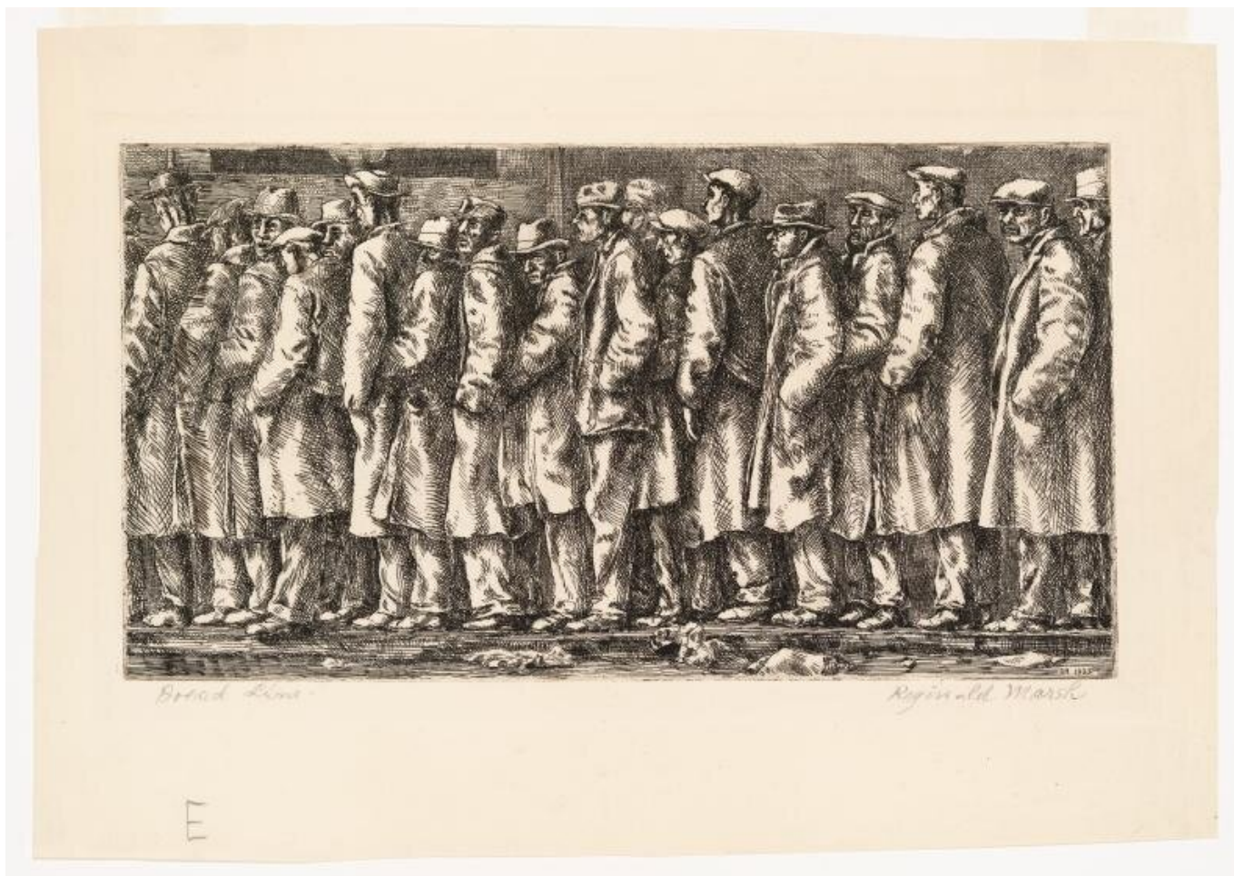
Bread Line - No One Has Starved / Очередь за хлебом – Никто не голодал, 1932. Reginald Marsh / Регинальд Марш.

были бы недоступны люди начали бы умирать — в больших количествах на улицах, что поставило бы под вопрос обман успеха. Но, как результат долгосрочного кризиса прибыльности, эти программы сокращались в течении последних десятилетий. Результатом этого кризиса либеральной демократии вследствие неолиберальной политики жёсткой экономии стала высокая экономическая нестабильность и растущее возмущение системой. Кризис прибыльности становится кризисом политической легитимности.